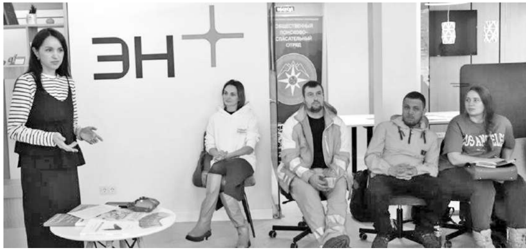
Идеи объединяют единомышленников

- Наконец-то можно собраться вместе и передать свой опыт. Посоветовать, оценить проекты, провести какую-то экспертизу, порекомендовать грантовую программу, помочь правильно оформить заявку и так