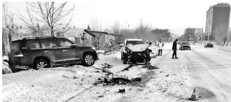
В результате водитель перелом рёбер. В воскресенье, 3 марта,

Она выехала на встречную полосу, где совершила лобовое столкновение с ВАЗ-21093 под управлением мужчины 1952 года рождения.