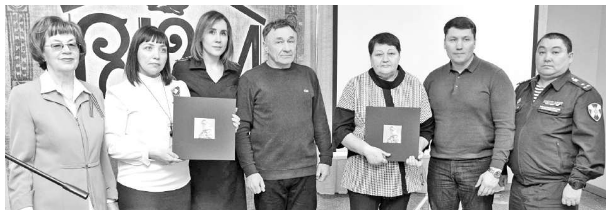
Фотокарточка в альбом - память на века