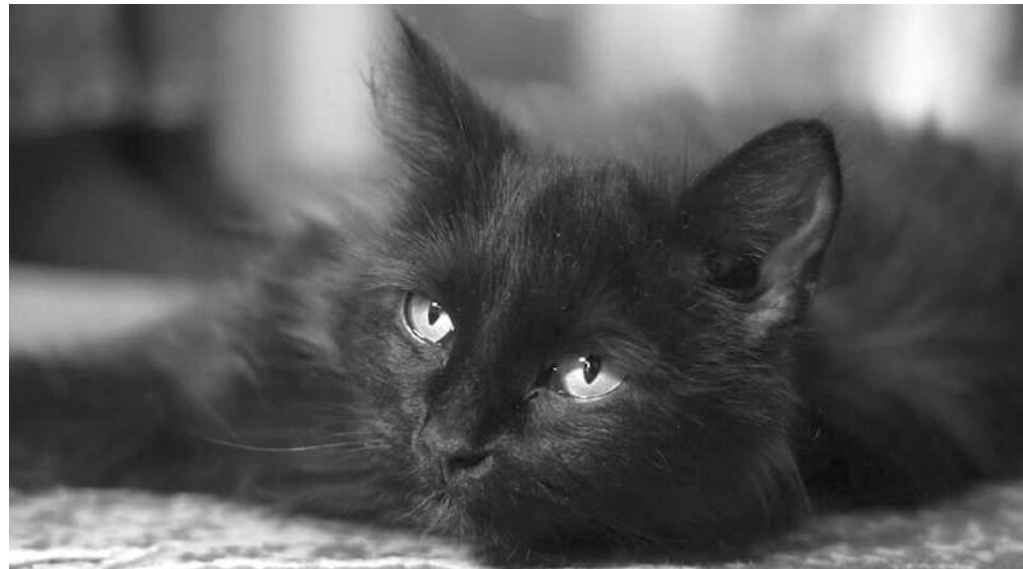
Та самая Кошка из зоны СВО

БЛАГО, ЕСТЬ среди нас те, кто не может пройти мимо страданий братьев наших меньших. Например, в конце июня прошлого года в Саяногорске сотрудник Госавтоинспекции спас котёнка. События развивались по тому же сценарию: бродячие собаки загнали испуганного малыша на дерево, откуда он не смог спуститься самостоятельно. Животное просидело на ветках всю ночь, пока его не заметил один из сотрудников Госавтоинспекции, заступивший на службу.