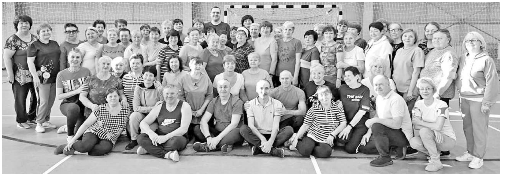
Занятия физкультурой - хорошая подзарядка для ветеранов