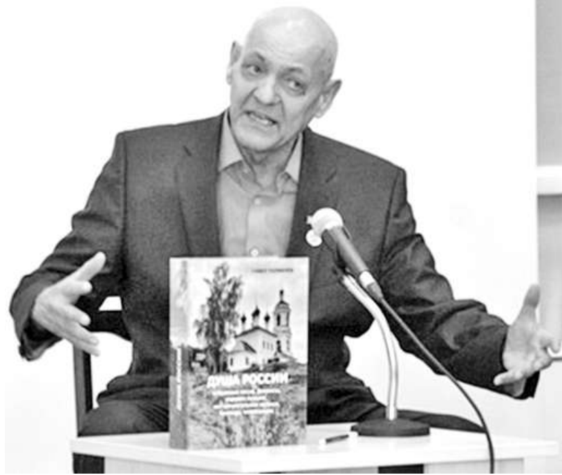
Талантливый композитор представляет свой сборник песен

ются по всей стране. Ни много ни мало, а 40 прекрасных сочинений написаны именно в Хакасии и конкретно в Саяногорске. Например, «Саяногорский вальс» стал у многих жителей города у подножия Саян любимой песней.