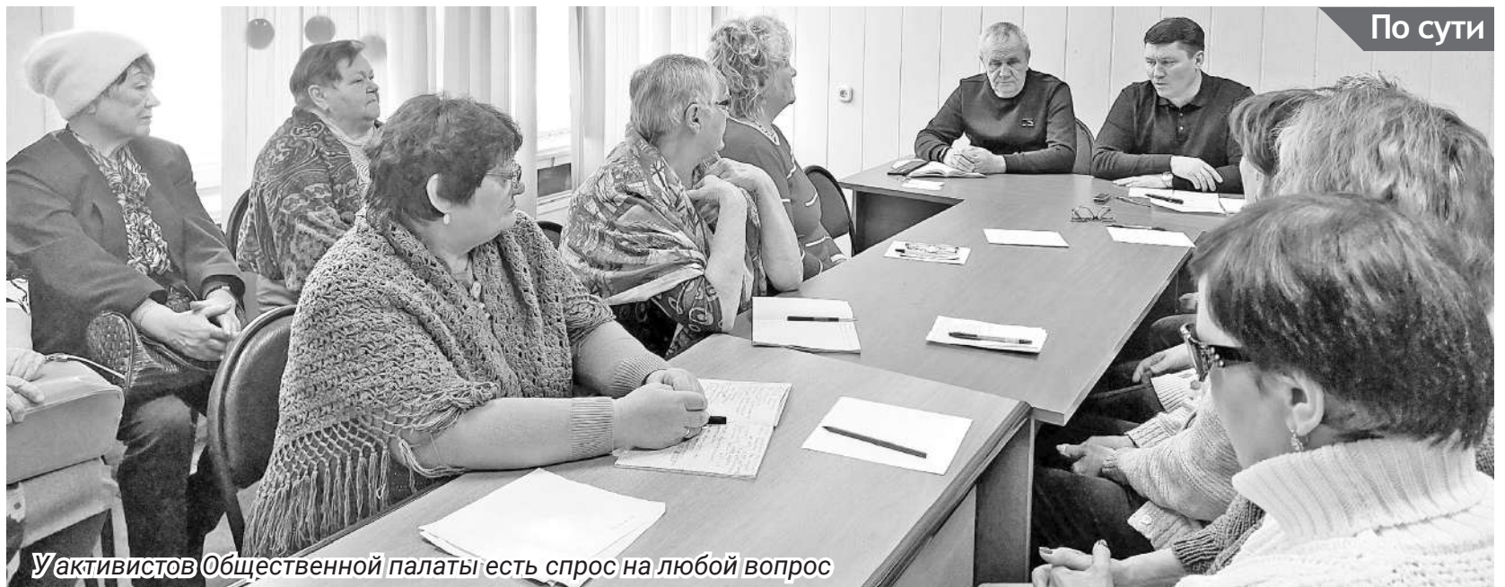
У активистов Общественной палаты есть спрос на любой вопрос

- В этом году мы заходим на благоустройство пяти общественных пространств и двух дворовых территорий, - поясняет Глава муниципалитета. - Благоустройству подлежат дворовая территория у дома № 87 в посёлке Черёмушки и возле дома № 9 напротив Детской музыкальной школы. В Черёмушках продолжится благоустройство парко-