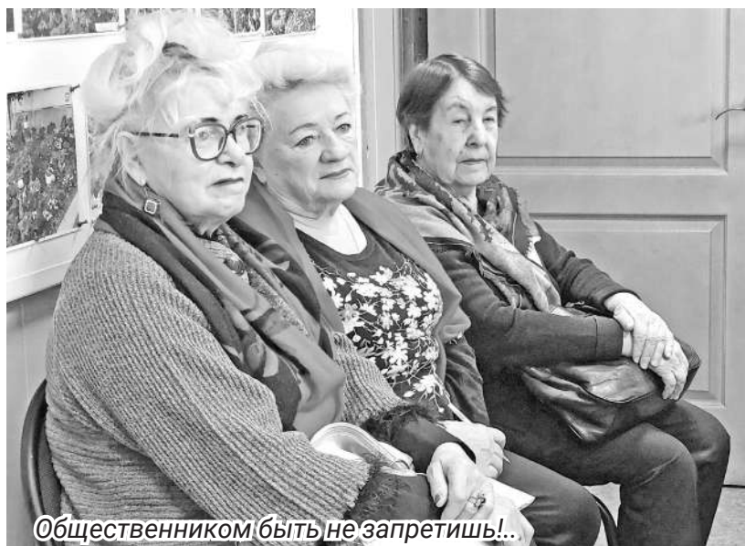
Общественником быть не запретишь!..

вой зоны. Ещё четыре общественных пространства, о чём мы уже неоднократно говорили, также будут обустроены.