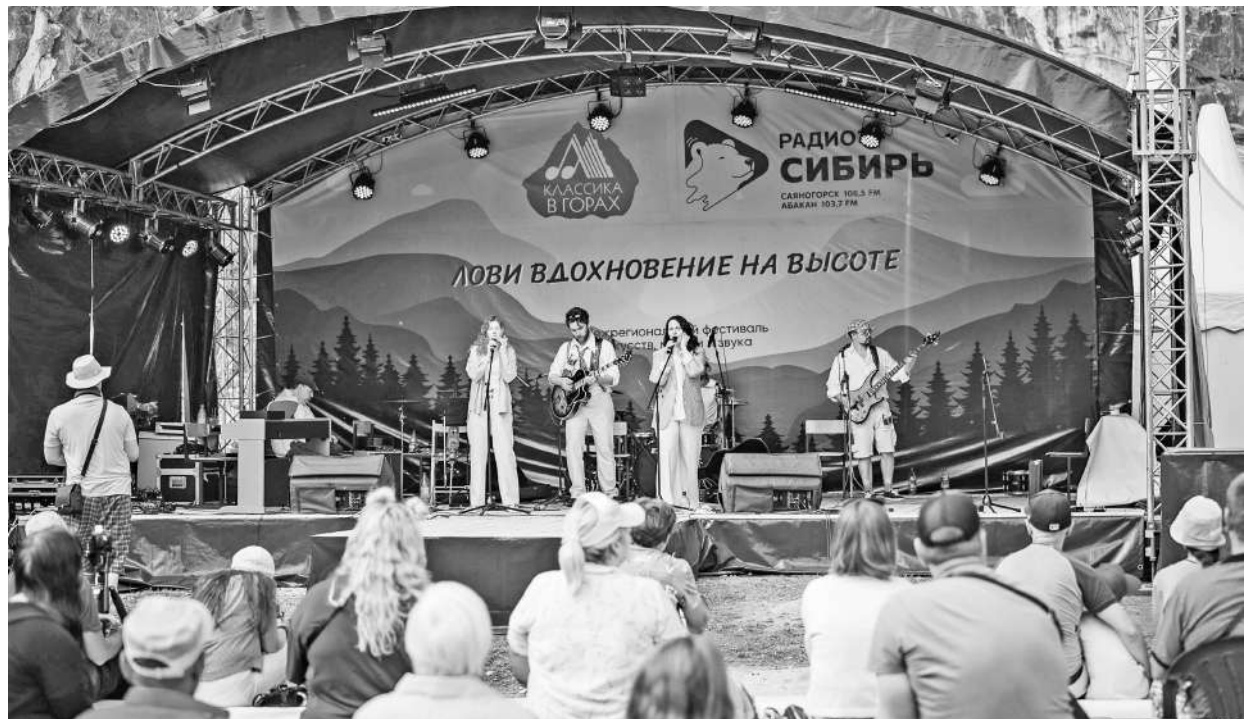
В горах музыка звучит по-особому!

Расположение и оформление локаций, помощь волонтеров, ярмарка мастеров юга Сибири, безопасность и трансфер до «Мраморки» и обратно - вот далеко не полный перечень