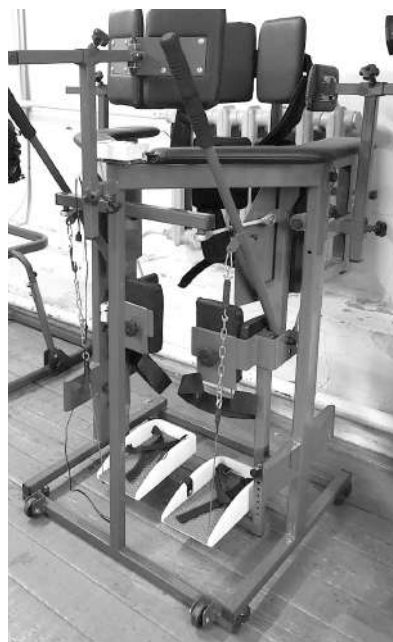
Имитатор ходьбы для реабилитации опорно-двигательного аппарата

При этом цены на тренажёры «ВелоСтарт» имеют конкурентное преимущество по срав-