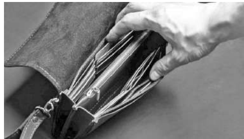
Случайная находка обернулась для 44-летнего саяногорца уголовной статьёй.

Всем саяногорцам надо знать: банки НИ-КОГДА не переводят деньги на безопасные счета. Единственное - они могут заблокировать счёт, если заподозрят что-то неладное.