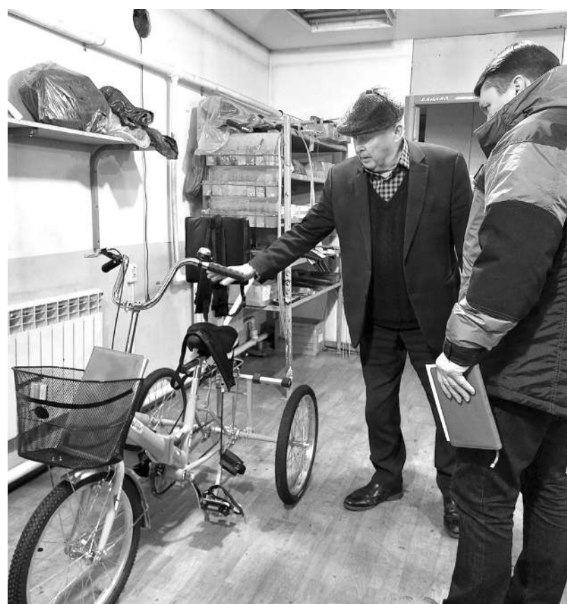
Ортопедический велосипед для летних прогулок и ЛФК

Истории брендов-участников проекта «Сделано в Саяногорске» будут освещены в газете «Саянские ведомости», сюжетах Первого городского телевидения, а также на официальных страницах в социальных сетях Администрации муниципального образования г. Саяногорск.