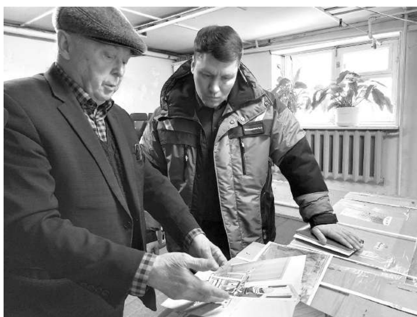
Восстанавливающие здоровье разработки - в руках мастера

Перепрофилировавшись и поменяв название на «Вело-Старт», ныне предприятие предлагает своим клиентам линейку трёхколёсных ортопедических велосипедов, на которых можно кататься летом, а зимой заниматься дома как на тренажёре в составе комплекса лечебной физкультуры. Каждый заказ выполняется индивидуально и продумывается до мело-