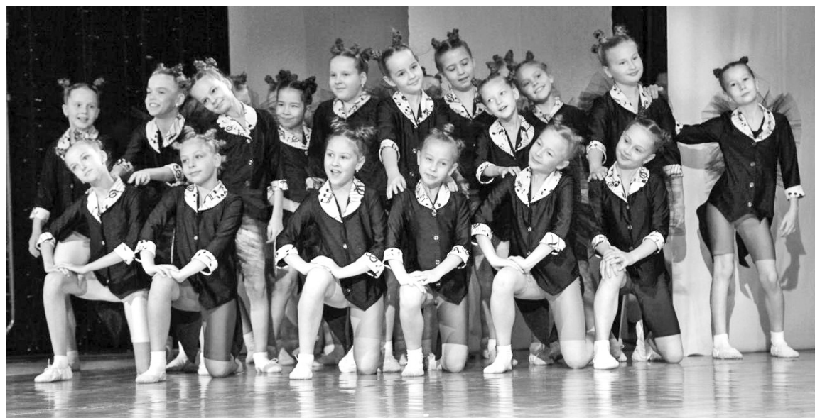
Танец «Самые лучшие звери» от «Сударушки» покорила жюри

На Международном фестивале-конкурсе «ARTist Сибири. Крылья творчества» отметили саяногорских танцоров и черёмушкинских вокалистов.