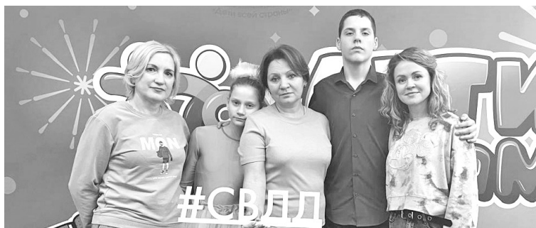
Москву повидали и себя показали!

Открытый Всероссийский конкурс народного творчества «Дети - детям» проходит в шестой раз. Творческие номера на суд жюри прислали из разных городов России. Всего на участие претендовали 3000 участников. В финал отобрали 200 самых талантливых детей из восьми федеральных округов.