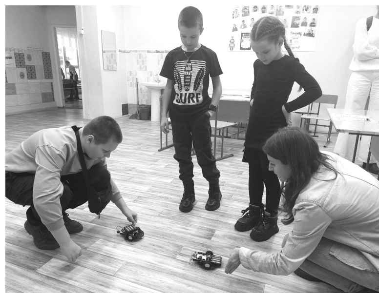
На ринг выходят роботы

заинтересовало изучение мира, незаметного нашему взгляду, - поделилась впечатлением десятилетняя Ева.