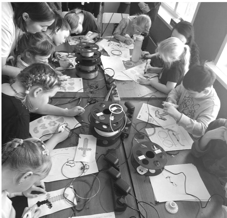
Маленькие гении творят волшебство

Более весёлая, но не менее информативная часть фестиваля проходила в двух точках: республиканский детский технопарк «Кванториум» поддержал инициативу и на один день разместил свои увлекательные площадки в Центре детского творчества, а на сцене выступали саяногорские маленькие звёздочки из коллективов Центра. В рамках фестиваля состоялась розыгрыш призов и торжественная церемония награждения победителей одноимённого конкурса на лучший рисунок, эштег и лозунг.