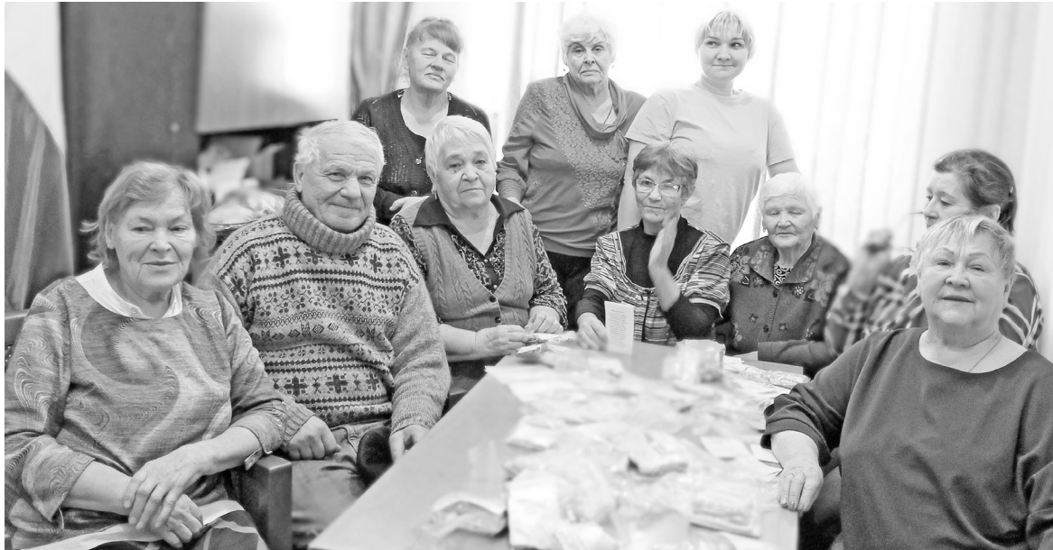
Вот такой сплочённый коллектив