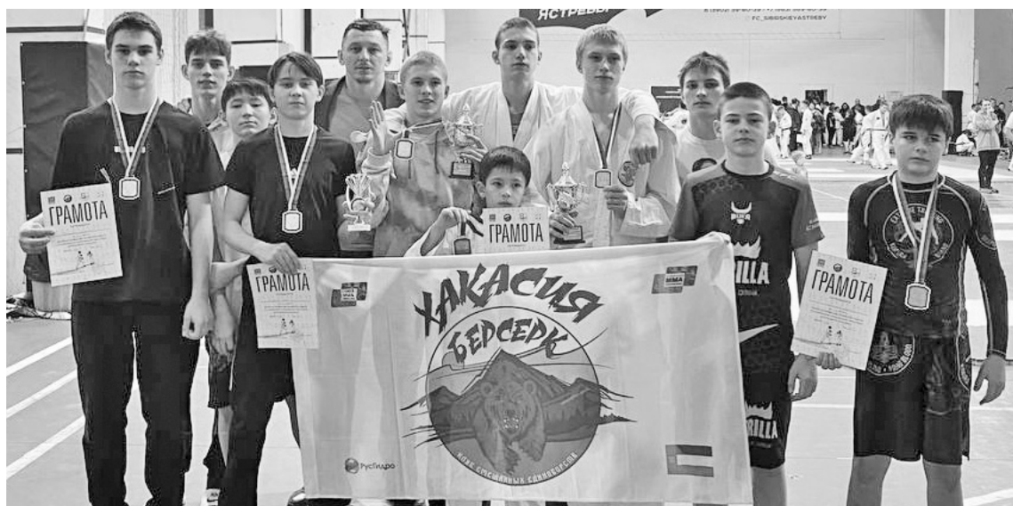
«Берсерковцы» всегда стремятся только к победам

Первенство Алтайского района по армейскому рукопашному бою прошло в Абакане. Юные спортсмены из черёмушкинского клуба «Берсерк» награждены медалями.