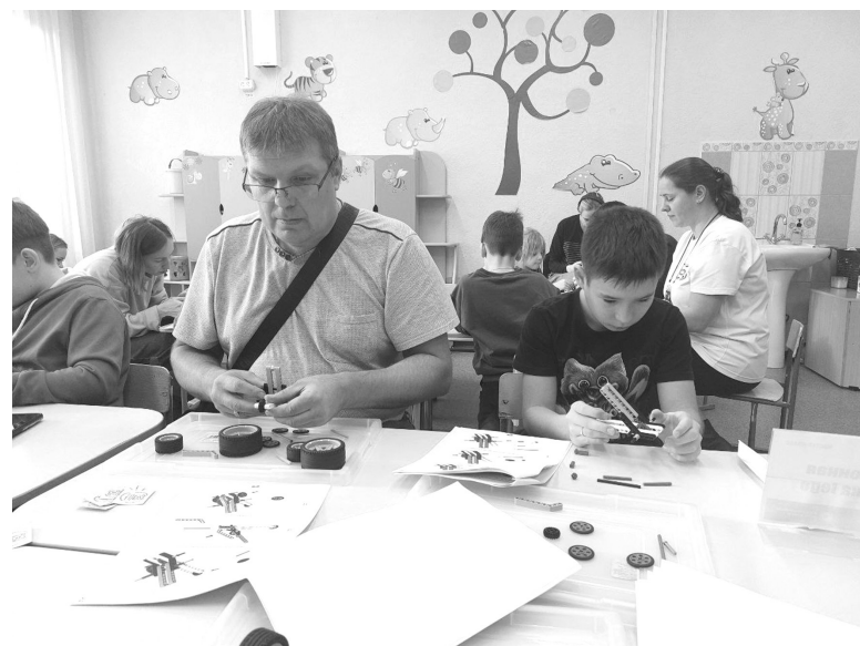
А мы с папой машинки строим!