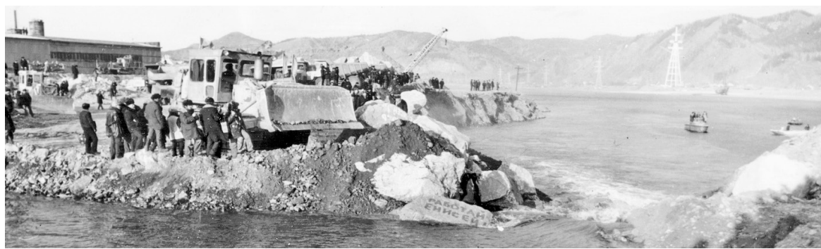
Год 1984-й. Вновь покоряем Енисей!

Двадцать четвёртого ноября 1984 года в 14.45 был дан старт перекрытию Енисея в створе Майнской ГЭС. Как и 11 лет назад на Саяно-Шушенской ГЭС в перекрытии Енисея принял участие советский космонавт. На это грандиозное событие пригласили дважды Героя Советского Союза Валентина Лебедева.