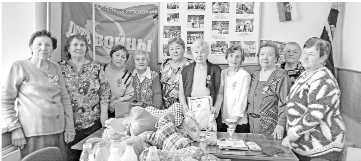
Дети войны знают, кому помогают