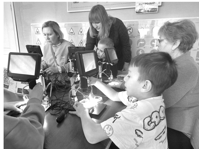
Что микроскоп нам показал?

- Я осмотрела в цифровой микроскоп ракушки, пятидесятикопеечную монету, лист домашнего растения. Такой микроскоп очень мощный, приближает настолько, что на поверхности видно каждую шероховатость. Сама я больше творческий человек, чем «научный», но меня очень