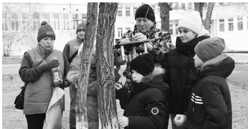
Новенький синичкин дом готов угощать зимних птиц

Аккуратные новенькие кормушки - плоды детских стараний. «Ласточата» корпели над ними не один день под чутким руководством старших товарищей, которые в будни серьезные металлурги, а в свободное время волонтеры. Каждый экземпляр домика для птиц - произведение искусства. Подкрепиться синичке теперь можно в деревянной избушке на территории детского дома или возле шестой школы. На выбор - целый ассортимент