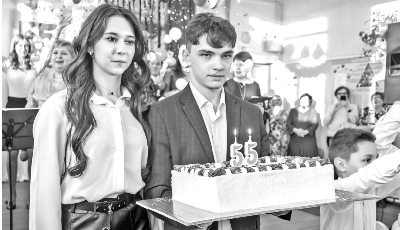
В чудесный вечер: зажжём на торте свечи