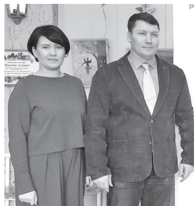
Российское движение детей и молодежи «Движение Первых»

- Решила проявить себя, доказать, что способна занять руководящую долж-