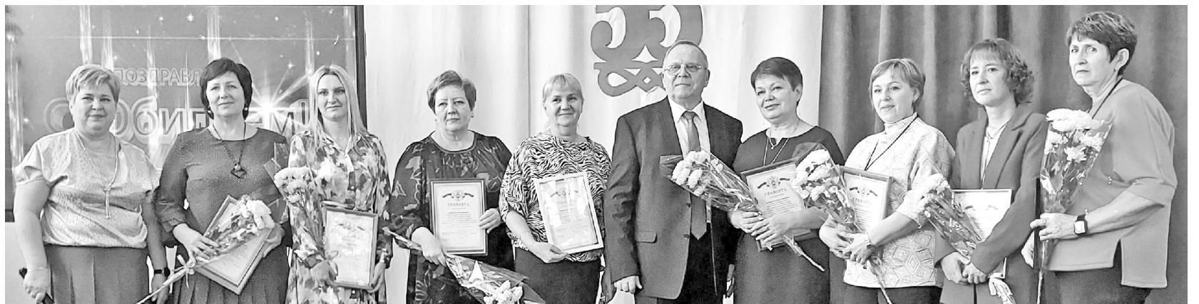
Каждая награда - это история труда

Девятого ноября прошло невероятно тёплое праздничное мероприятие: Саяногорская средняя школа №1 встречала тех, кто пришёл разделить радость замечательного события - 55-й юбилей. Выпускница школы и по совместительству наш корреспондент побывала на празднике и вот что может рассказать читателям газеты.