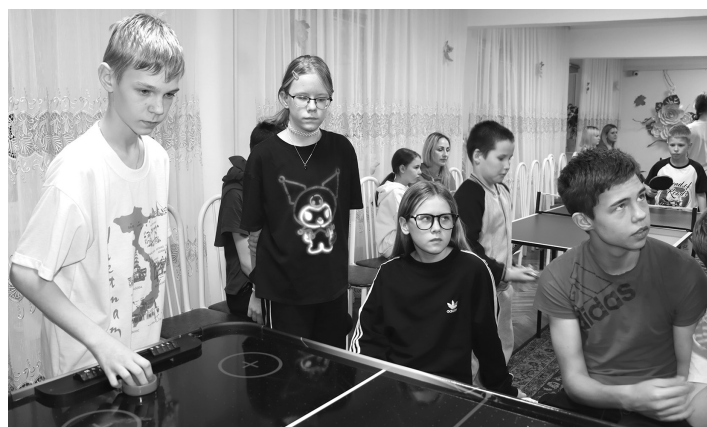
Аэрохоккей - игра увлекательная

Проект стартовал в Саяногорском реабилитационном центре с турнира по теннису, дартсу и аэрохоккею. Волонтеры познакомили своих подшефных с правилами игр, и ребята с огромным интересом и азартом включились в соревнования, чтобы выявить сильнейших. Соревнования проводились в индивидуальном зачёте, и каждый из двадцати участников был настроен на победу. На игровых площадках царил оживление, ребята волновались, переживали за неудачные попытки, вместе с