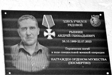
Наши. Родные. Вечно живые...

Мелодии патриотических песен гулко отражались в окнах близстоящих домов, пока юнармейцы сменяли караул у закреплённых на стене школы, скрытых занавесью портретов, а у крыльца выстраивались шеренги кадетов и гостей с трепещущими гвоздичками в руках. Увековечить память земляков пришли представители Администрации муниципалитета, городского отдела образования, военного комиссариата, ветераны боевых действий, педагоги и, конечно, родные и близкие героев СВО.