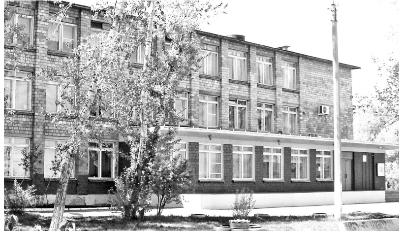
Живи и процветай, родная первая!