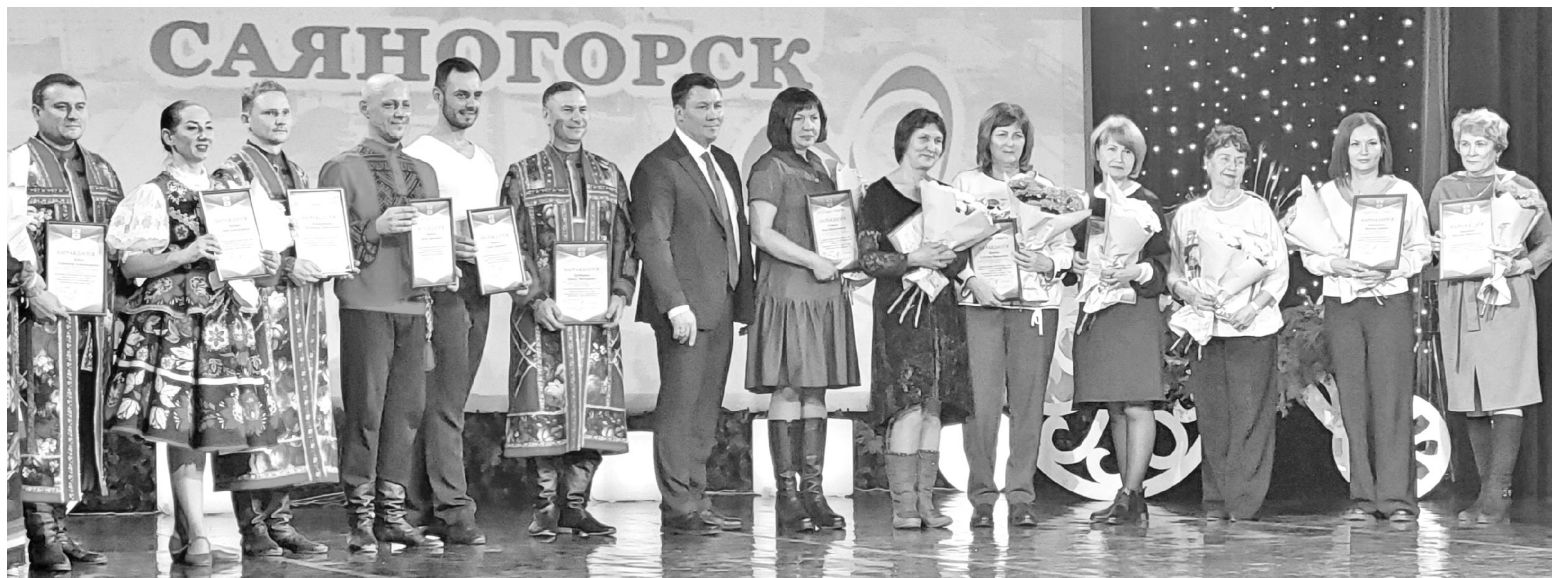
Глава города и команда награждённых

Эта фраза объединила всех, кто 6 ноября - в День рождения города, собрался в зале ДК «Визит» на празднование 49-летия со дня образования нашего родного Саяногорска.