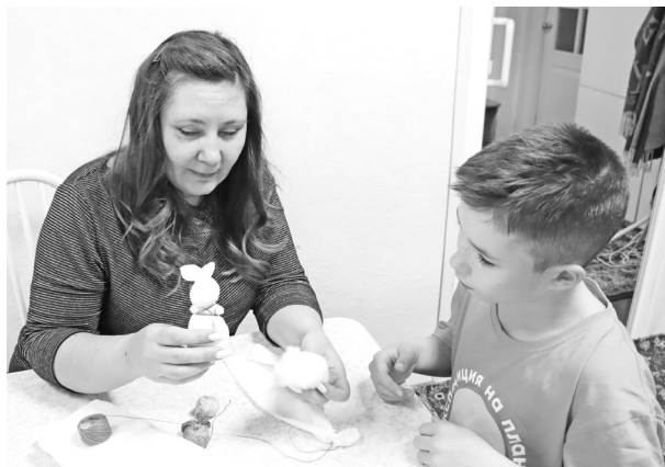
Поделка своими руками - самая лучшая

Родителей заинтересовала ещё одна локация - клуб настольных игр «Эра» ДК «Энергетик» под