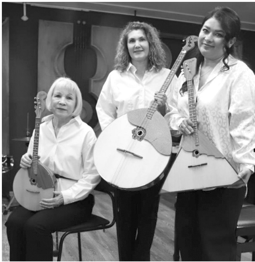
Пусть всё идёт, как по нотам!

- Мы и наши ученики ждали обновления инструментальной базы оркестра 40 лет. За это