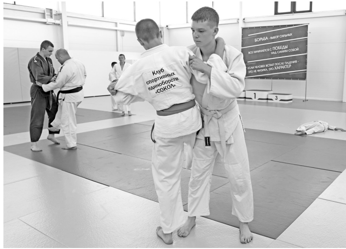
Искусство боя вселяет уверенность и силу

Центр спортивных единоборств в Саяногорске - это сбывшаяся мечта многих юных саяногорцев и их тренеров. Сегодня в ЦСЕ занимаются 360 человек, а в секциях дзюдо, которое по праву считается одним из самых зрелищных видов борьбы, - около 100.