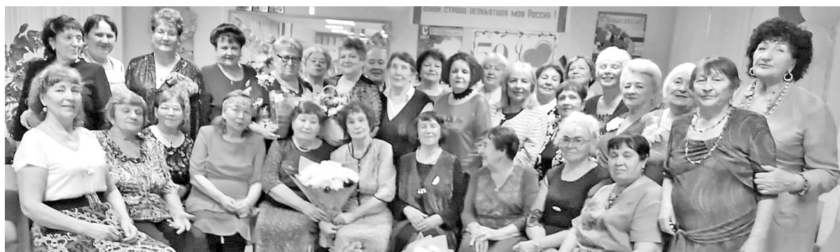
И вновь слетелись мы на огонёк

Клуб «Мудрость» при Общественной палате города Саяногорска отметил 28 лет со дня основания.