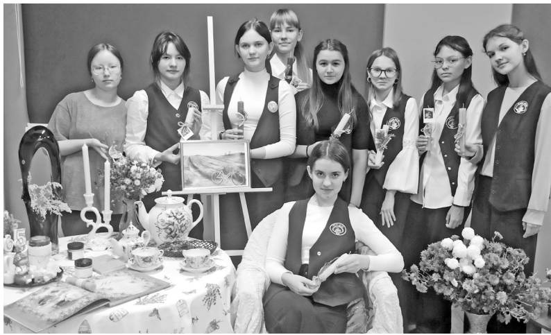
Уютный вечер при свечах собственноручной работы

Юные свечевары вложили в художественное оформление заготовок из пчелиного