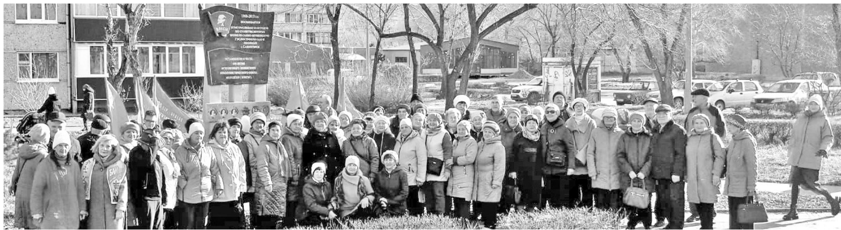
Вся наша жизнь под знаком комсомола

К нашему торжеству присоединились члены КПРФ: они создали праздничное настро-