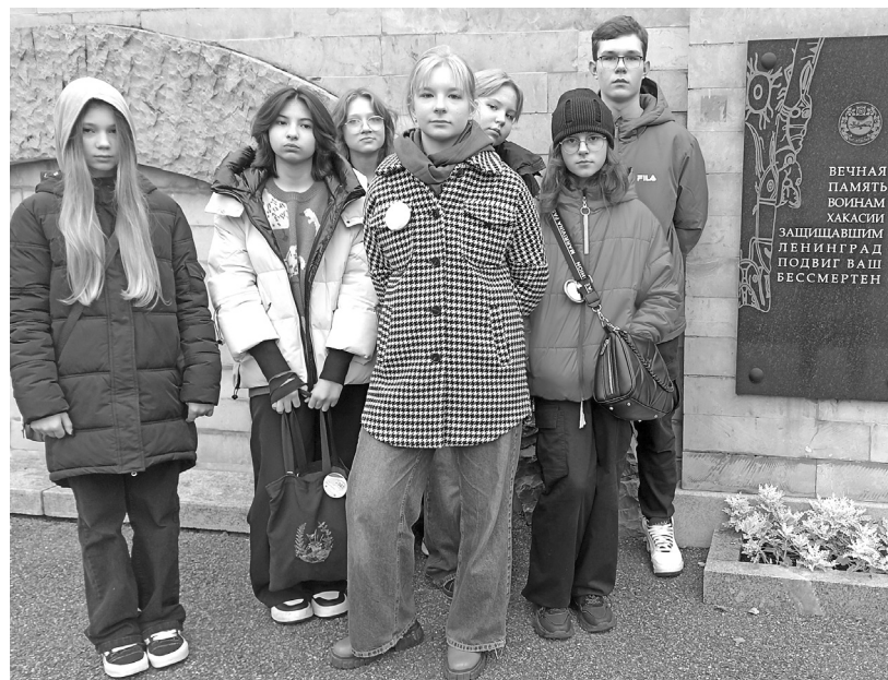
Петербург оставляет автографы своим гостям в душе

Завершилась поездка в Северную Пальмиру посещением Петропавловской крепости и Центрального военно-морского музея имени Петра