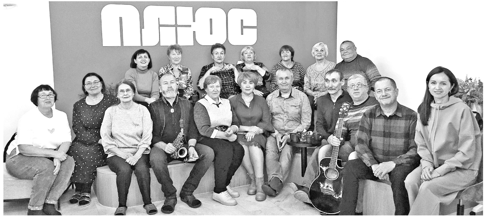
Музыка нас связала

представителей совета Общественной палаты в посёлке Черёмушки, которое традиционно прошло в клубе «Мудрость». Обсудили ряд вопросов. Встреча, как всегда, была полезной для гостей и хозяев и очень приятной в плане душевного общения. Понятное дело: тон мероприятию, как всегда, задавал щедрый на положительные эмоции председатель Общественной палаты.