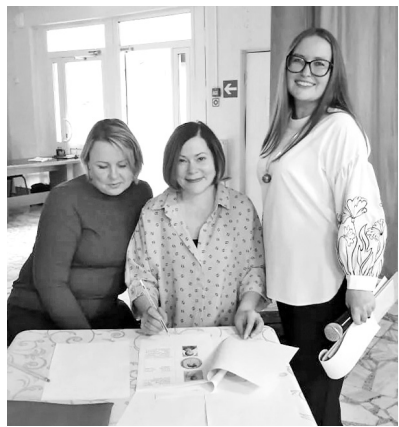
Жюри не дремлет, оно считает баллы

В отделе культурно-досуговой деятельности посёлка Майна состоялся квиз «Включайся!», посвящённый 225-й годовщине со дня рождения великого русского поэта.