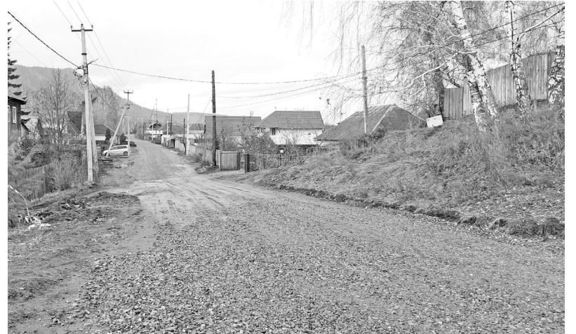
Процесс восстановления дороги - участок за участком

- Здесь убраны глина и грязь, подсыпана песчано-гравийная смесь, произведена укатка поверхности, - сообщает в соцсетях о ходе работ на улице Промышленная Глава муниципалитета. - Для отвода воды на одном из участков было сделано небольшое углубление, куда засыпали крупные камни. В дальнейшем этот участок сверху закроется слоем песча-