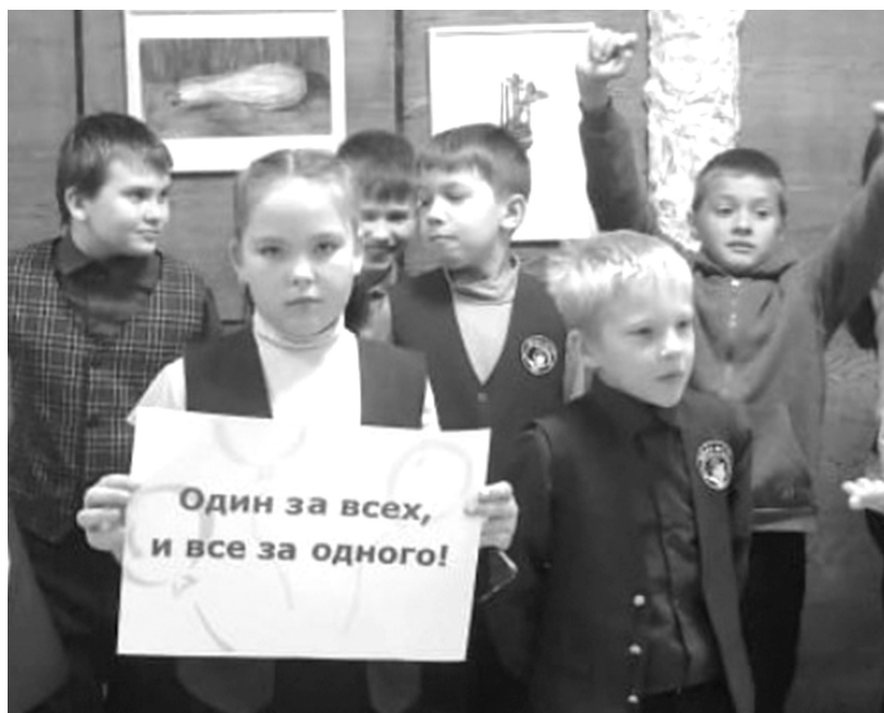
Третьеклассники дружбе верны

Конечно же, они не просто заглянули, но надолго задержа-