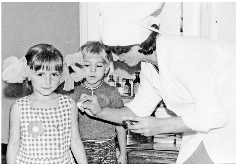
- Я прививки не боюсь, если надо - уколюсь!

тия детского сада проходила в спортивном зале при большом стечении народа: представителей Саянского алюминиевого завода, родителей, «артистов» из числа первых воспитанников-дошколят. Конечно, всё шло по сценарию, с обязательным литературно-художественным монтажом, «задником» импровизированной сцены, оформленным бумажными цветами и высказываниями асов педагогики о воспитании юных строителей светлого коммунистического завтра.