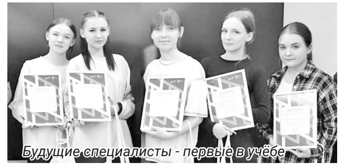
Будущие специалисты - первые в учёбе

В качестве поощрения для стипендиатов провели экскурсию на фольгопрокатный завод САЯНАЛ, вручили дипломы и памятные подарки.