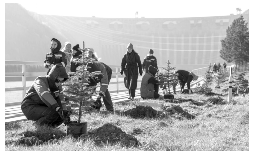
Заложили будущую зелёную аллею

На следующем этапе сотрудники гидроэлектростанции