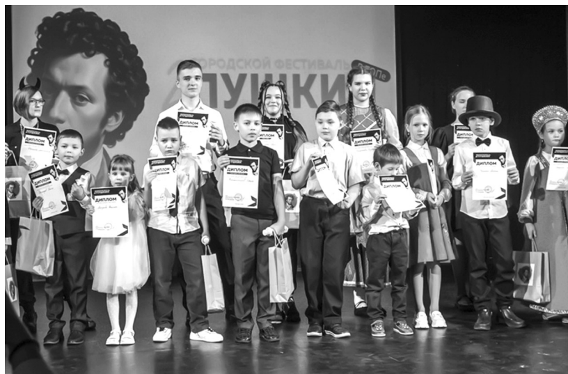
Приятно получить награду за успех