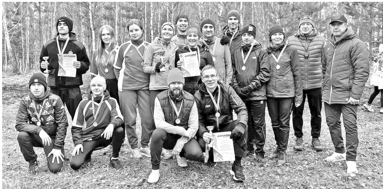
За каждым финишем - старт новых возможностей

- Мы очень рады, что смогли охватить весь муниципалитет: участвуют не только организации Саяногорска, но и коман-