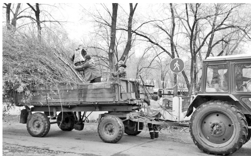
Пришли, напилели, погрузили

Здесь была прочищена и облагорожена живая изгородь вдоль новых «пешеходок». Произведена прочистка крон и стволов высокорослых деревьев на пустыре за детским садом «Почемучка», а в районе городской стоматологии коммунальщики облагородили растительность небольшого скверика. Одним словом, убрали нависающие ветки, сажали на пенки бесфор-