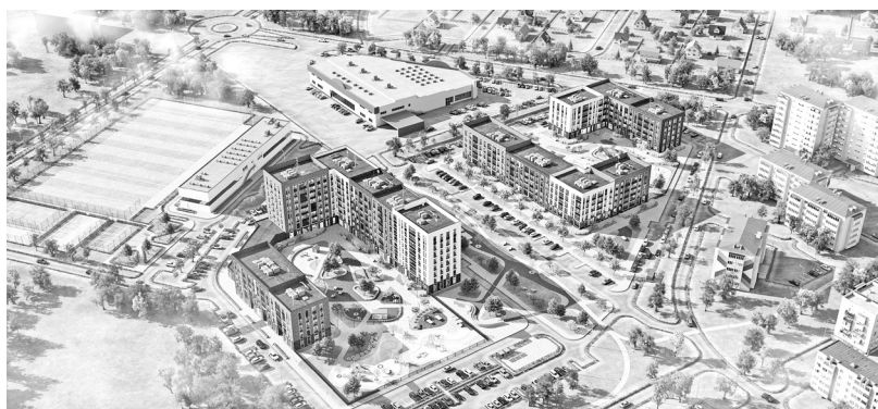
В таком жилом комплексе захочется жить!

Квартиры в новом жилом комплексе привлекут молодых