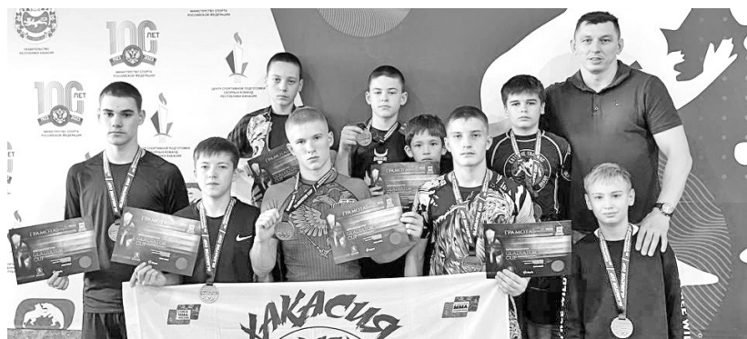
С высокими наградами - домой

В столице республики прошёл межрегиональный турнир по борьбе «бразильское джиу-джитсу». За победу в соревнованиях боролись 360 спортсменов из Хакасии, Тывы и Красноярска.