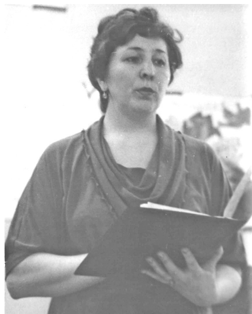
В кадре времени: молодость и зрелость