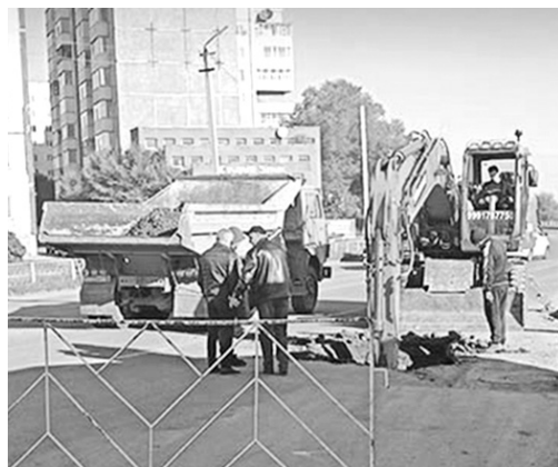
Лужи - долой!

Ливневый колодец установлен на улице Ярыгина в районе остановки «Заводская», где постоянно разливается большая лужа.