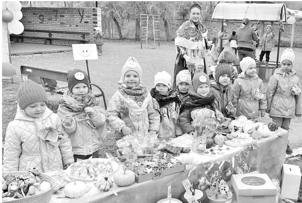
Воспитанники группы «Улыбка» и их родители готовили дары осени

взрослых своей сценкой «Как воспитатели и дети в детский сад собираются». Развесёлый Скоморох вынес огромный самовар, в котором вместо чая появились угощения для малышей. Закончилось представление общим флешмобом «Кадриль» и приглашением в город Мастеров.