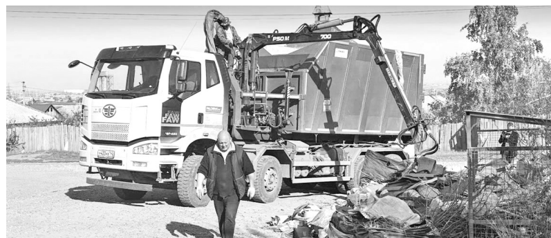
Спецтехника - на вывозе мусора

Кроме того, работники городского КБО продолжают уборку на контейнерных площадках собственными силами. Делать это нелегко, но крайне