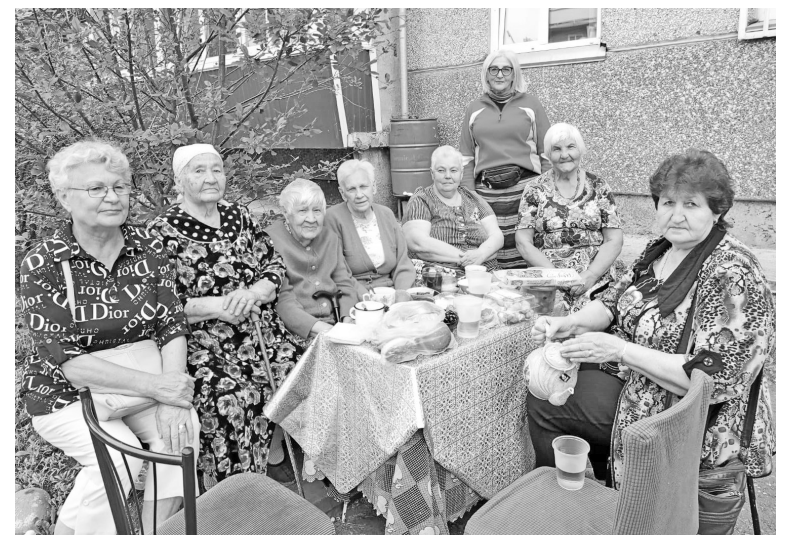
В ТОС «Зона комфорта» уютно и весело и детям, и взрослым

ми структурами, участия в конкурсах, грантах, а как результат - воплощать ещё больше интересных задумок на своей территории. Как можно было нам и дальше оставаться за бортом такого перспективного движения?