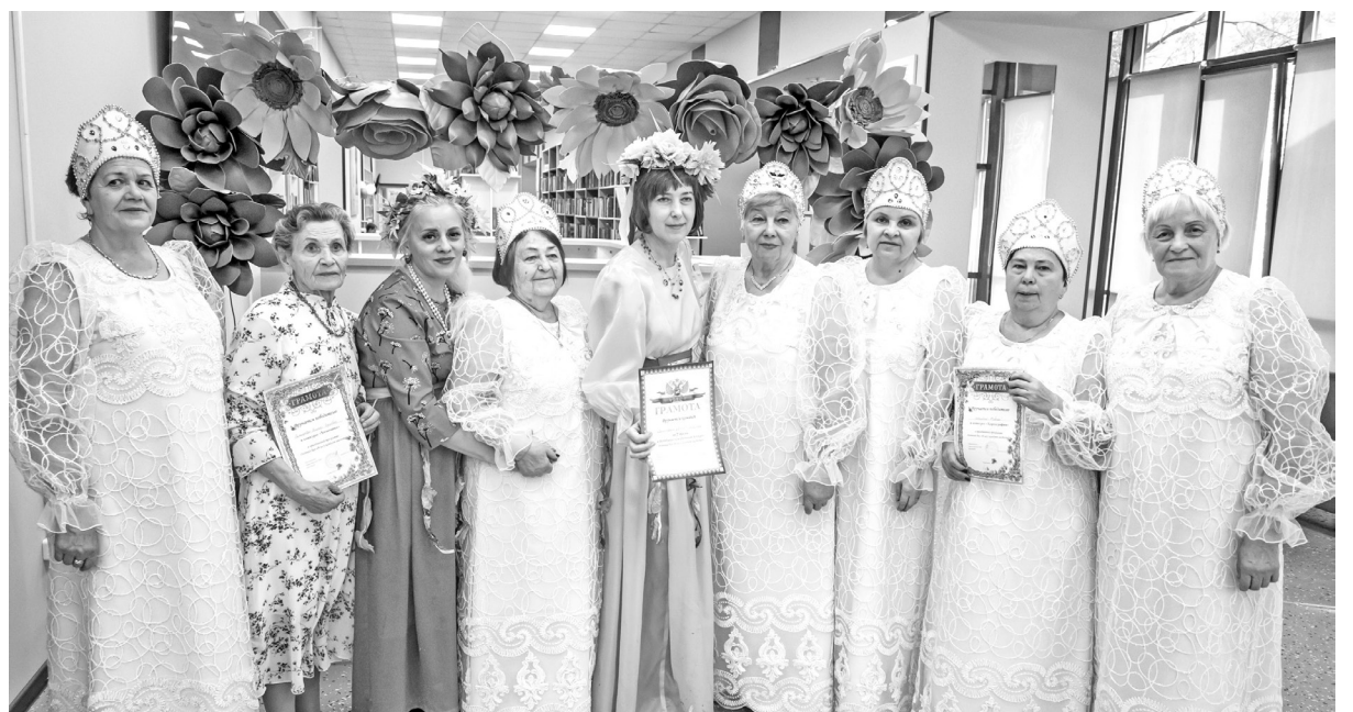
С дружным коллективом приятно разделить победу!

В Центральной городской библиотеке имени А.С. Пушкина Черногорска отгремел республиканский осенний бал «В садах опять колдует листопад» для людей с инвалидностью.