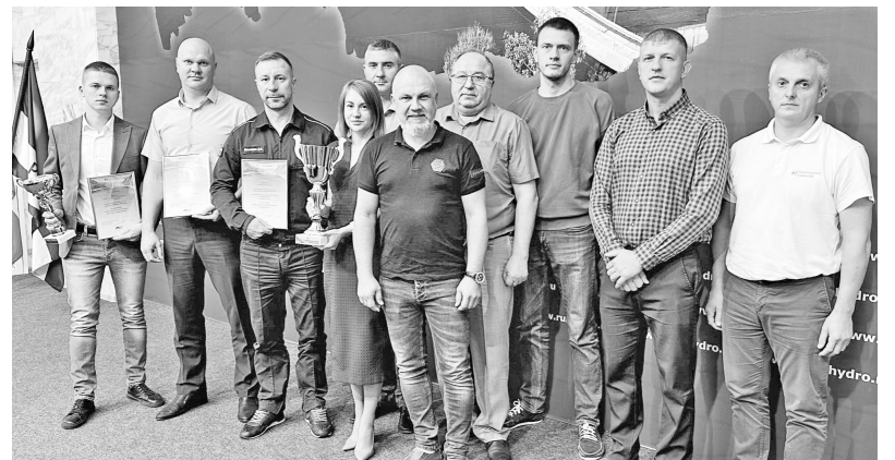
Участники Спартакиады результатами довольны

Победителем Спартакиады стала команда Оперативной службы СШГЭС. Второе место заняла команда Саяно-Шушенского филиала Транспортной компании РусГидро, а бронзовые медали достались сборной производствен-