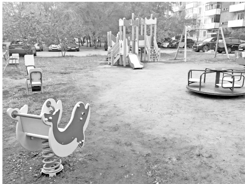
Ребятню порадует новый городок!

Дополнением к сказанному может послужить информация о том, что не сегодня-завтра состоится торжественное открытие двора счастливого детства, обустроенного в рамках проекта «Инициативное бюджетирование». Об этом редакции «СВ» сообщила главный организатор инициативной группы жителей дома по