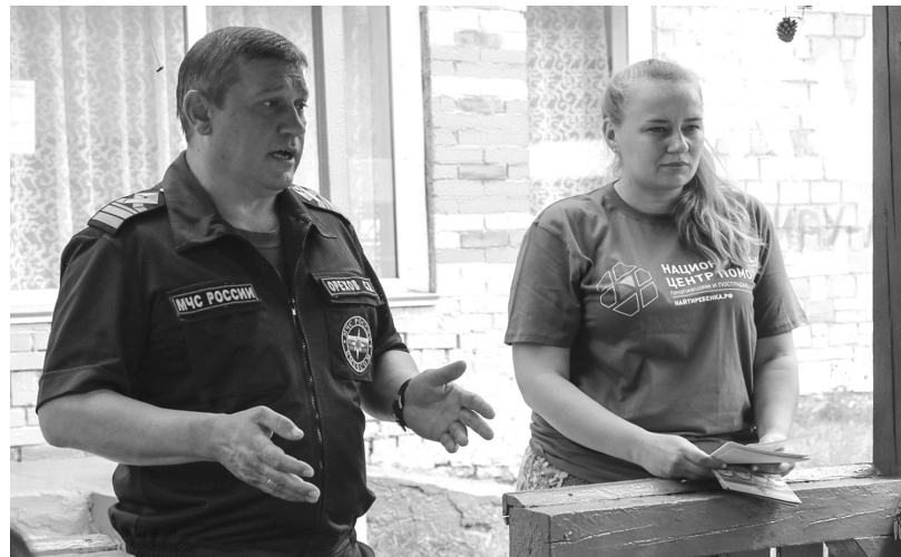
Профилактический рейд совместно с сотрудником МЧС

По словам Романа, первые сутки поисков для волонте-