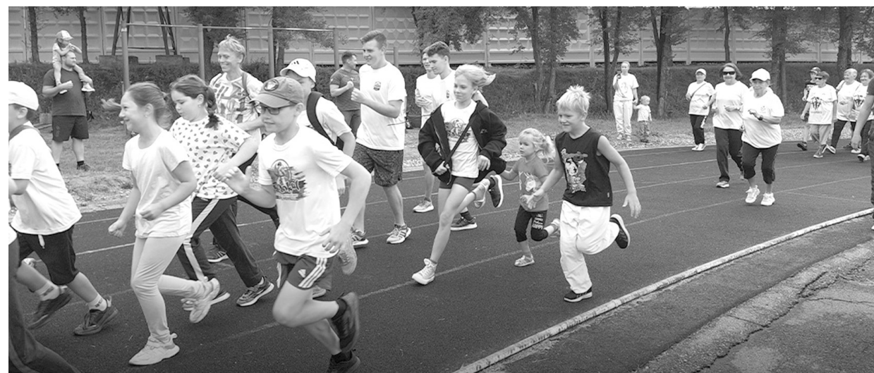
Саяногорцы - активные участники Дня физкультурника

проведут для присутствующих зажигательную зарядку.