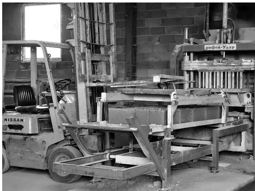
Современный кирпич для современных домов

Алёна ВАТРАЛЬ