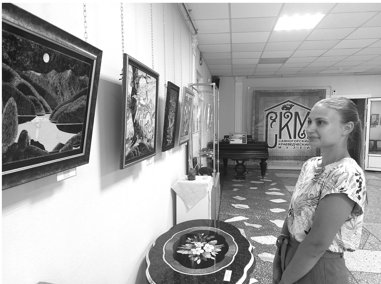
Остановись, мгновенье, ты прекрасно!