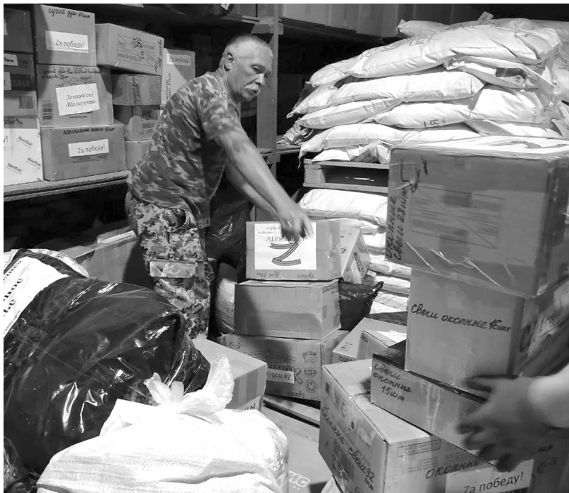
Гуманитарный упаковывается груз

Гуманитарный груз формируется на главном городском складе, откуда направляется либо напрямую в зону СВО, либо в республиканский распределительный центр, затем - «за ленточку». В сборе и формировании грузов задействованы городской Союз предпринимателей, различные общественные организации, учреждения образования, предприятия, волонтеры и, конечно же, все неравнодушные жители города и посёлков. А это десятки тонн гуманитарного груза, в состав которого входят, в том числе, автомобили, мотоциклы, генераторы, машинные масла и антифризы, комплектующие для беспилотников, маскировочные сети, печи для бань, рабочие инструменты, генера-