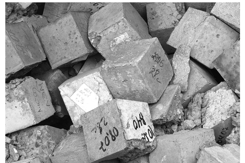
Испытательные образцы. Качество на контроле