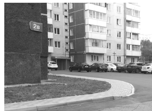
Двор поменял внешность

- благоустройство дворовой территории по адресу: Советский м-он, дом № 9. По состоянию на 1 августа работ