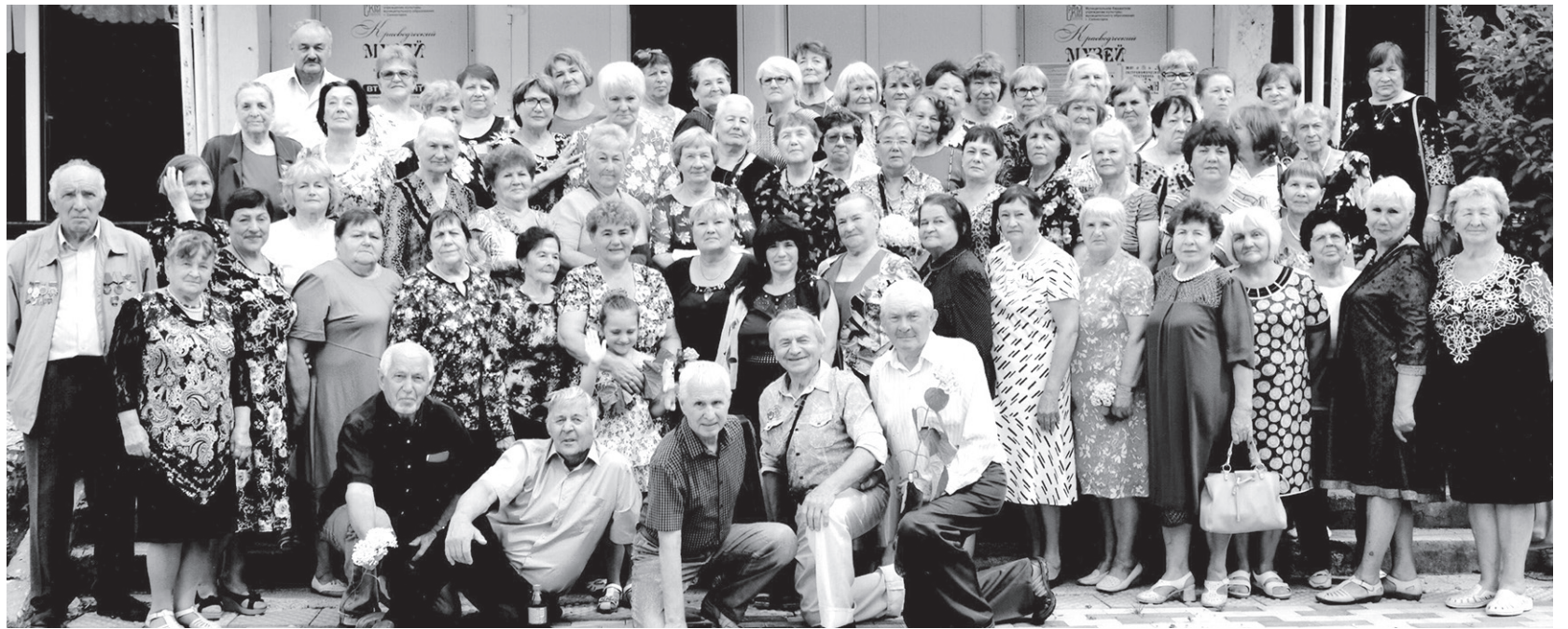
Обладатели гордого звания - стоители!