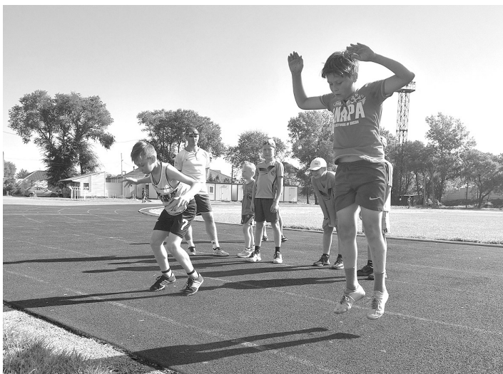
Быстрее, выш, сильнее!

Энергичные юные футболисты, пробежав несколько кругов вместе с участниками марафонов, начинают зарядку. Если бегуны-любители разминаются для общего тонуса и не особо ухищряются в разнообразии и необычности упражнений, то будущие звёзды спорта ведут серьёзную