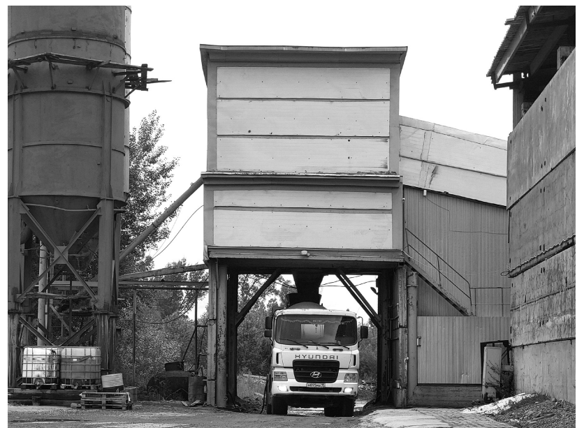
Партия бетона отправляется к заказчику