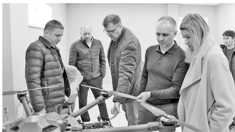
Наши квадрокоптеры - воинам в помощь!

Екатерина использует возможные меры поддержки от правительства республики. Например, льготные ставки