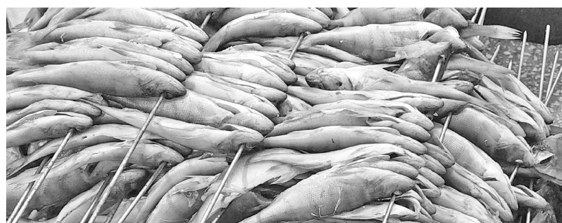
Коптись, рыба, большая и маленькая

регионального этапа всероссийского конкурса «Сто лучших товаров России».