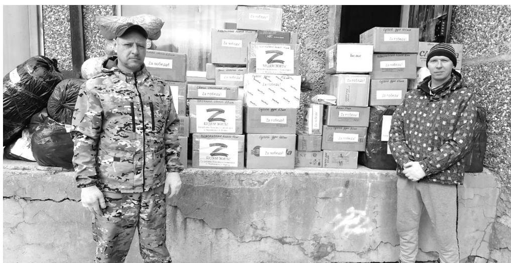
К отправке «гуманитарки» на общий склад из краеведческого музея готовы

«Седьмого апреля рукодельницы городского «Спицназа» упаковали 200 пар вязанных носков. Судя по опыту прошлогодних отправок, носки востребованы в весенний период как в госпиталях, так и на передовой. Порядка 1000 пар с начала года уже отправлено «за ленточку». Пряжа для вязания пока есть, поэтому наши женщины в настоящее время вяжут носки для осенней отправки гуманитарного груза. Закончится пряжа - будем вновь обращаться за помощью к нашим благодетелям», - сообщает на своей страничке в