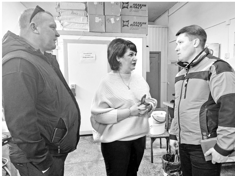
Производство Черепановых посетил Глава муниципалитета

Сами рыбу любят, рыбу любят родные и друзья, рыба всегда под боком - за чем же дело стало? Смело шагнули в воды бизнеса - и поймали волну! Погрузились в тему, стали общаться с профессионалами отрасли, посещали крупные заводы и мелкие предприятия, использовали каждую возможность освоить тонкости, подыскивали поставщиков и персонал. Наконец, попробовали сделать первую партию для себя - получилось!