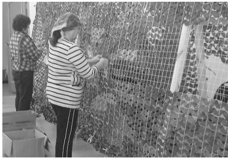
Пусть эта сеть укроет от врага и станет для бойцов надёжной защитой

нам выделили помещение в бывшем здании Красноярскгэстроя. Сначала там установили один станок для плетения, затем ещё один, потому что желающих участвовать в этом деле сегодня насчитывается более трёх десятков. Появилась потребность в дополнительном помещении - волонтерам предложили плести маски для в большом зале здания бывшего детского садика «Чебурашка».