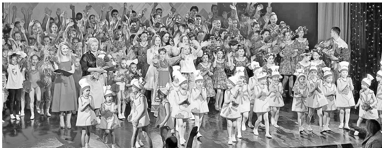
Каждый концерт - результат дружной работы всей творческой команды

получили дипломы лауреатов I и II степени международного конкурса «КИТ», а также взяли два первых места на международном конкурсе «New vision» и II место на всероссийском конкурсе хореографического искусства «Рашка».