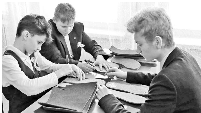
Дети делятся теплом души с защитниками страны

Параллельно с салфетками для сухого душа в классе вдруг (не могу до сих пор вспомнить, как это вышло) появились банки из-под консервированного горошка и кукурузы. Девочки моют их, с трудом отклеивая этикетки, а мальчишки орудуя мужским инструментом - молоточками и плоскогубцами,