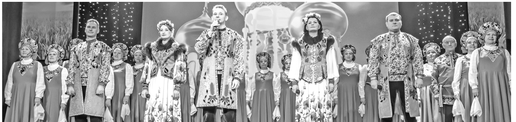
И вновь тебе пропойт ребята нашего Дворца

Пополнилась россыпью наград копилка рейтинговых достижений коллективов. Воспитанники ансамбля «Исток» стали дважды лауреатами II степени на международном фестивале хореографии «Сибирская карусель», завоевали звание лауреатов III степени XIV международного фестиваля-конкурса «Arena Festival»,