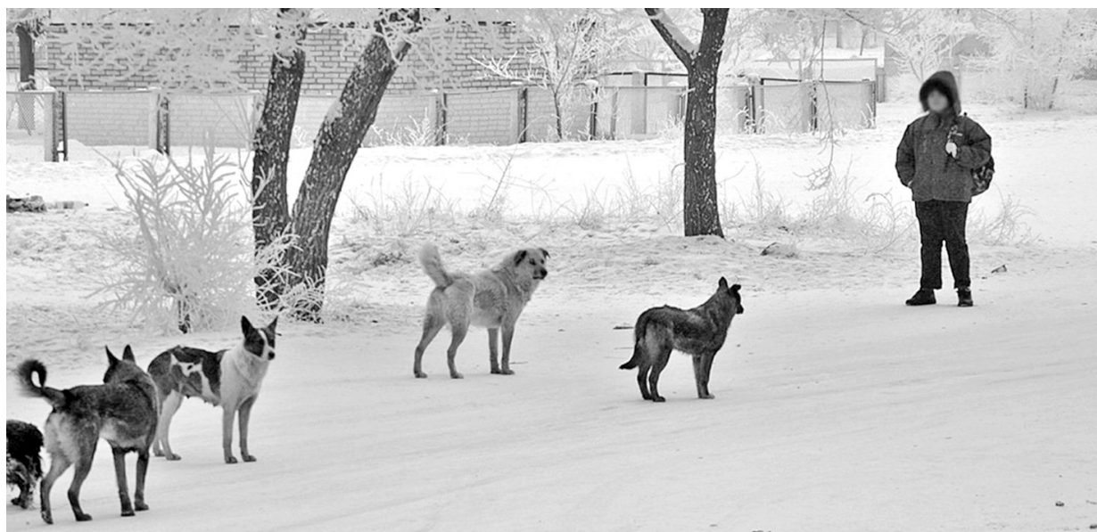
Хвостатые хозяева территории: никто не проскочит, никто не пройдёт

городского КБО, отловщики безнадзорных животных отработывают «свой хлеб», преимущественно, по заявлениям граждан. С начала года в комбинат подано около полутора тысяч заявок, треть из которых - через автоматизированную систему. Более всего заявок поступает на скопление безнадзорных животных в промзоне, в районе теплотрасс, в посёлке Летник, по улице Индустриальной, где упитанные собаки, «ростом с доброго телёнка».