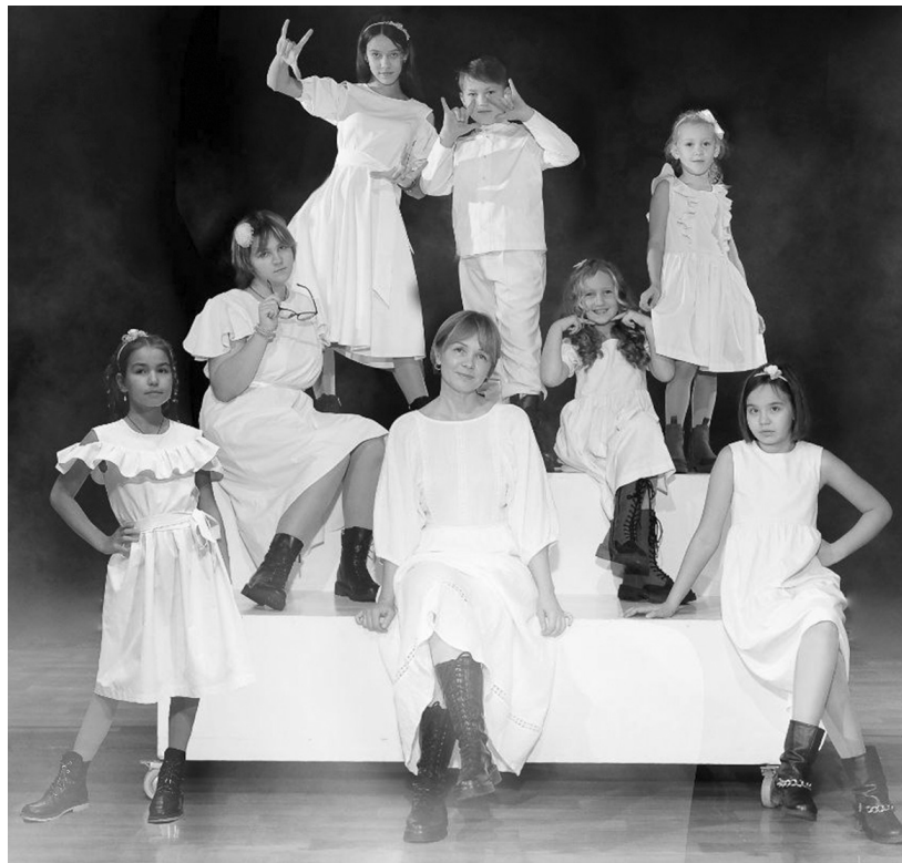
Юные таланты детской вокальной студии «Созвучие»