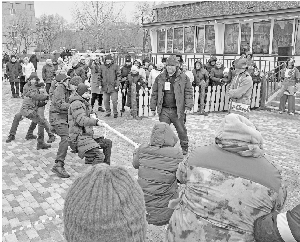
Канат сжимают руки крепко!

Конкурс весёлых частушек традиционно за старшими, а вот импровизированные командные лыжи - за ребятами. Ветер добавил интереса в первенство по метанию картонных блинов в сковороду, хоть те и норовили улететь в толпу.