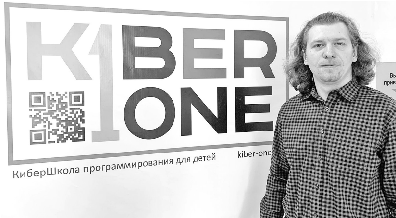
Кибершкола - база для освоения профессий будущего

лись очень востребованными, и вскоре мы пошли на расширение - оборудовали классы в посёлке Черёмушки, Абакане и Черногорске.