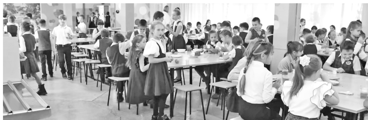
Работникам столовой дети за обеды ставят пять!

В меню ежедневно присутствуют те продукты, которые максимально полезны для растущего организма. Это и