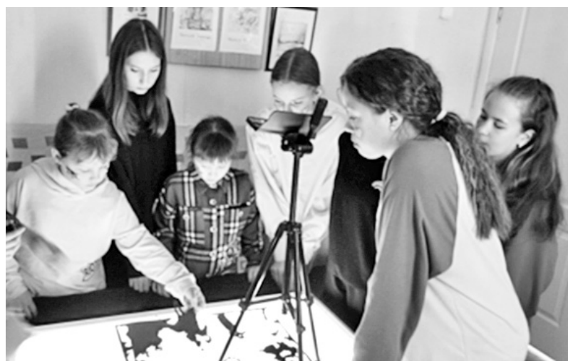
Театр теней - потрясающее зрелище!