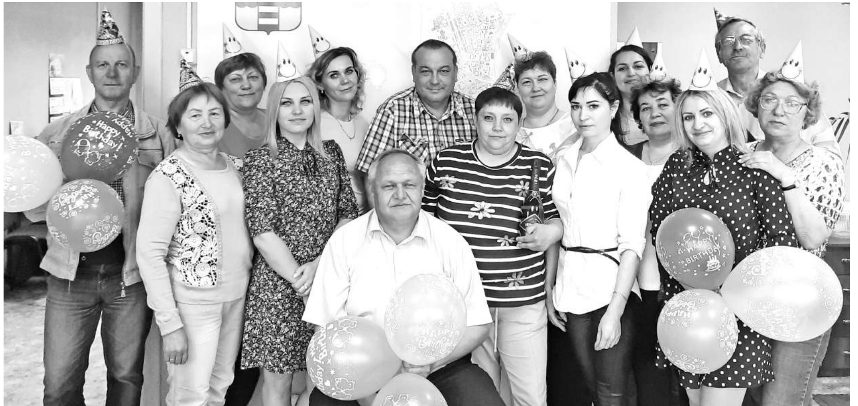
Частица коллектива КБО: какие лица, какие люди!..

Они именно такие, наши женщины из КБО. Не сказать, что им приятно или сильно нравится работать под открытым небом в жару и в холод, в дождь и пургу. Но для уборщиков территорий не существует понятия «не хочу» и «не буду». Есть слово: «надо»! Идут и делают даже тогда, когда «хороший хозяин собаку со двора не гонит». Прогибаться