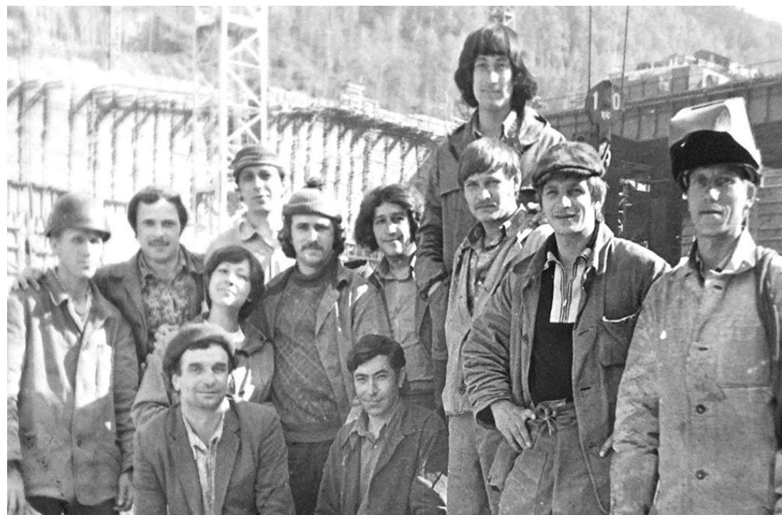
В окружении коллег - единственная девушка в бригаде сварщиков! (третья слева)

нужную область видно. После такой первой пробы неделю я на занятия не ходила - глаза сожгла, слёзы текли без остановки. А мастер тот мой аляповатый шов посмотрел, махнул «ладно» - он думал, что я по специальности работать потом не буду.