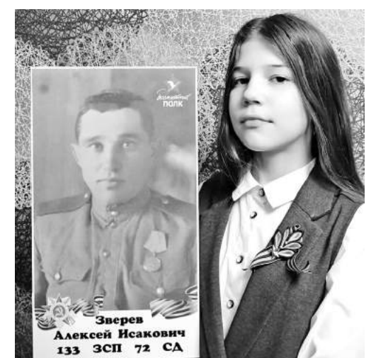
Пойдёт по улице опять