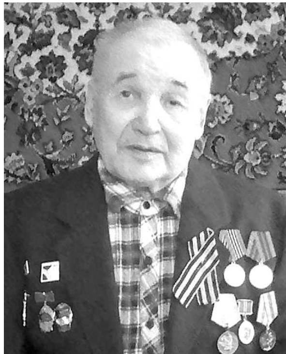
Русский Ваня где только ни бывал...