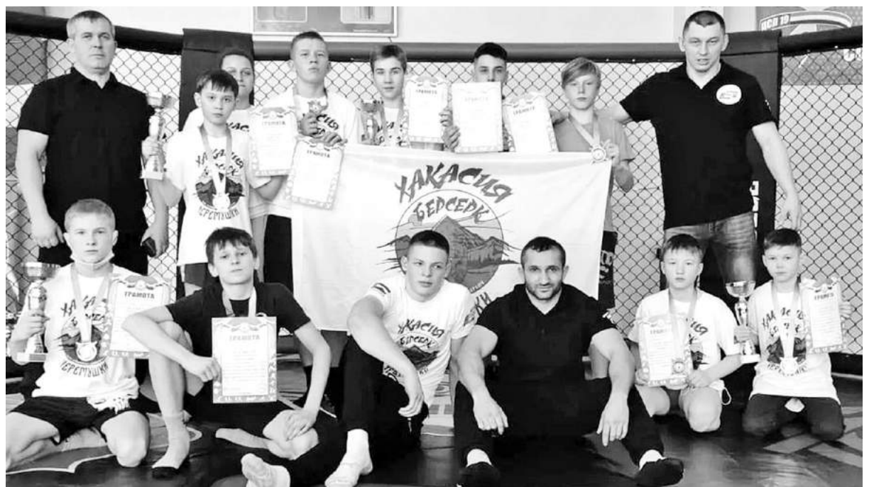
Командный зачёт остался за нашими ребятами

Саяногорцы привезли с чемпионата по смешанному боевому единоборству, который проходил в Черногорске, комплект наград.