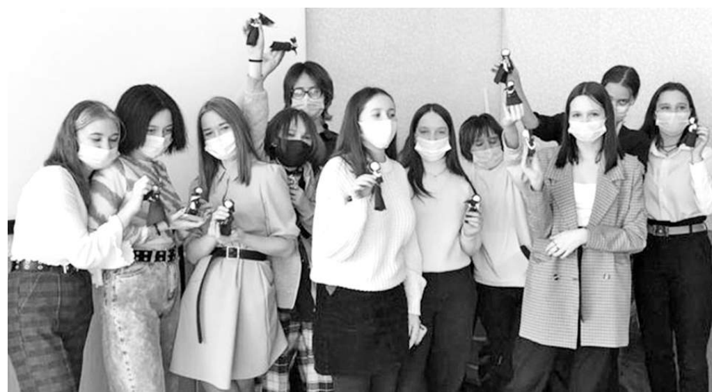
Куклы-обереги своими руками

ской они своими руками заменили колёса. Восторженные отзывы ребята оставили в электромонтажной мастерской, где освоили компетенцию «Электромонтаж» и справились со сложным практическим заданием «Сборка электрической схемы».