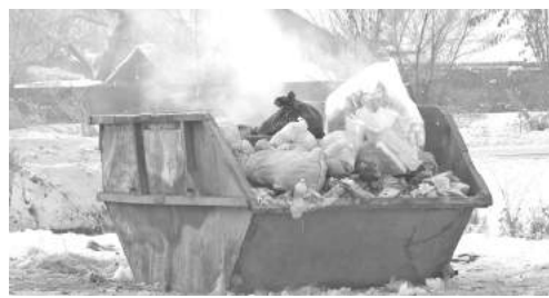
Поджигатели пакетов с мусором в мульде - угольки из печки...

Порядка десяти-двадцати хозяев домовладений выносят бытовые отходы в одну мульду. Может быть, им стоит собраться всем вместе, чтобы уговорить друга не выбрасывать туда