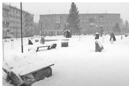
Весна придёт - снег в сквере превратится в гололёд

- Сложный вопрос... Бывают периоды, когда ходить по дорожкам сквера, действительно, проблемно. Была идея укрыть транзитные зоны, например, тротуар вдоль центральной остановки специальным материалом. Пока не получилось это сделать.