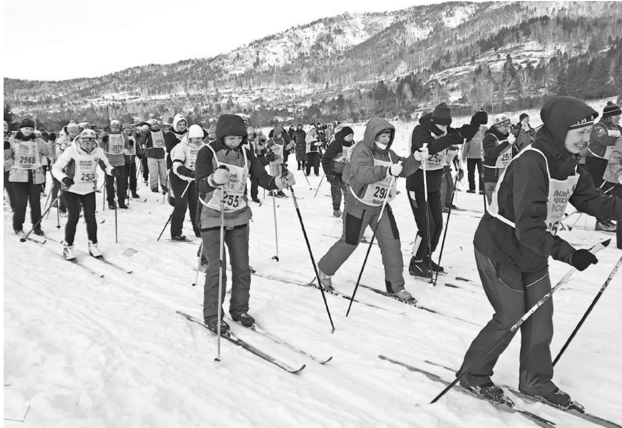
Все лыжники опять в строю!

В минувшие выходные был дан старт 40-й юбилейной Всероссийской открытой массовой гонки «Лыжня России-2022».