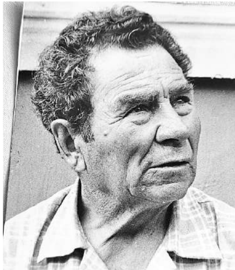
Жизни не жалевший ради нас

Имеют ли срок давности события Великой Отечественной войны? Уверен, нет. Для моей семьи, так же как и для многих других, они остались в памяти, документах и наградах своих героев. Великая Отечественная - это четыре года сражений, 1418 бессонных ночей, более 27 миллионов погибших. Это было время, когда наши мужчины стояли насмерть, чтобы защитить Отечество, родных и близких им людей.