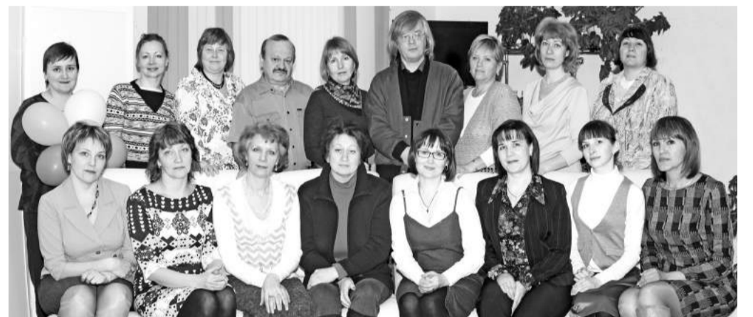
Эти люди воспитывают настоящие таланты

- Отрадно то, что мы вошли в национальный проект «Культура», и в следующем году проведём так необходимый нам ремонт. Как сдали школу в 1982