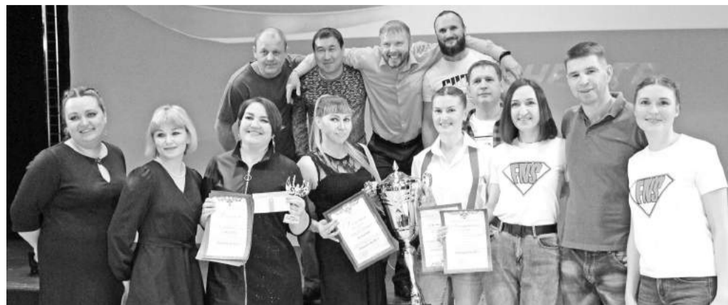
Самые смешные и остроумные - команда «F.R.I.E.N.D.S!»

В предвкушении веселья зрители не скупилась на аплодисменты в адрес партнёров и спонсоров фестиваля, благодаря которым праздник юмора таки состо-