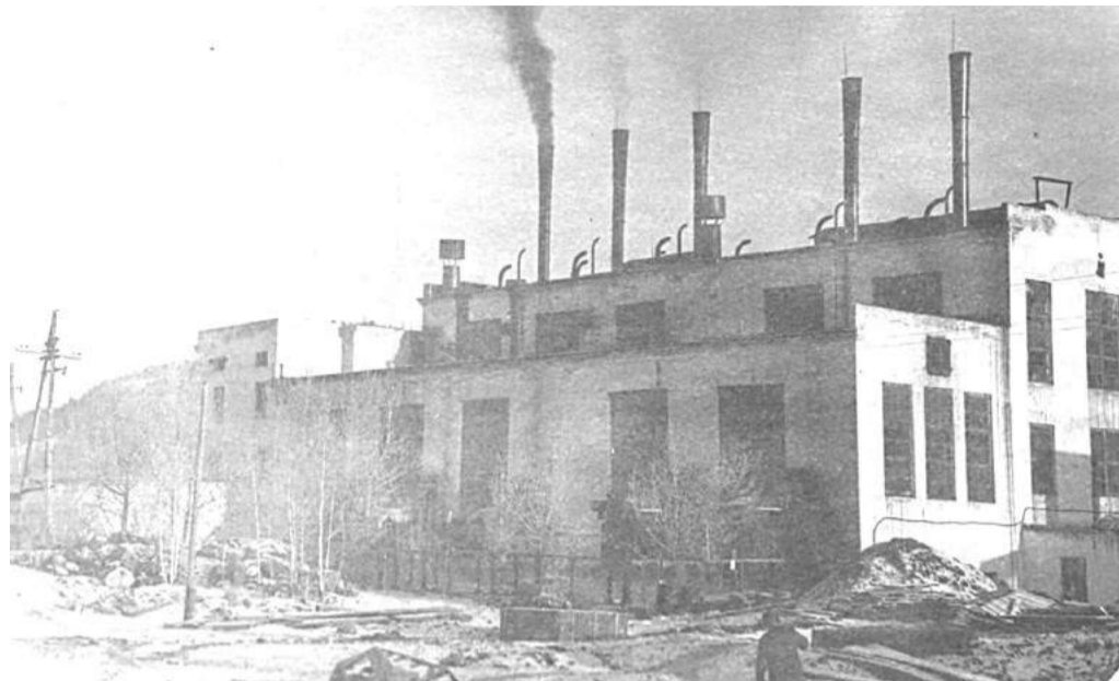
Майнская ТЭЦ, 1963 год