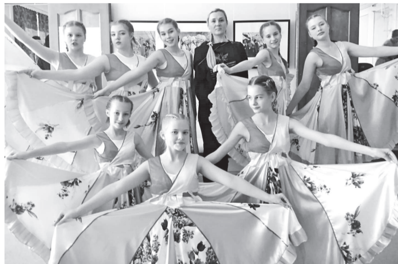
Старшая группа образцового ансамбля эстрадного танца «Ритм»

Образцовый ансамбль эстрадного танца «Ритм» представляли две возрастные группы -