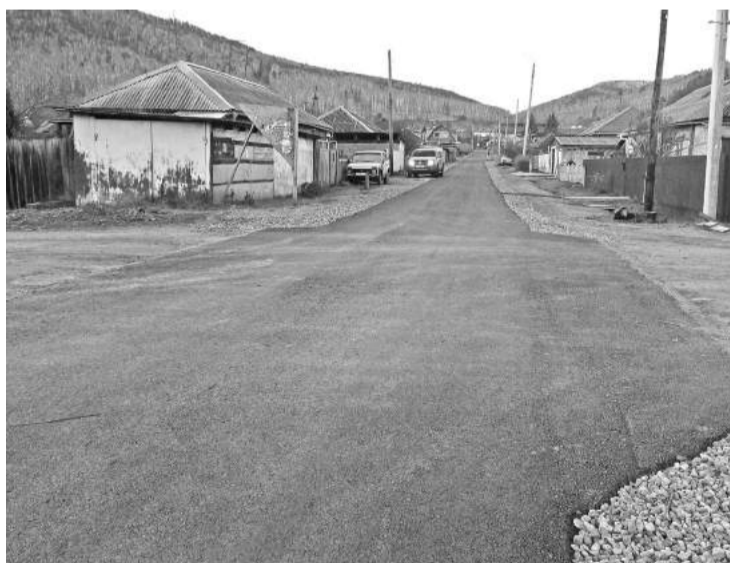
Улица Советская - сплошное полотно