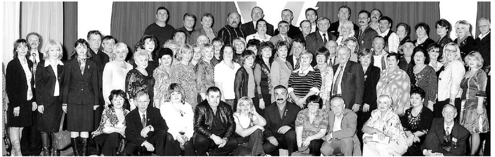
Комсомольцы 70-80-х годов