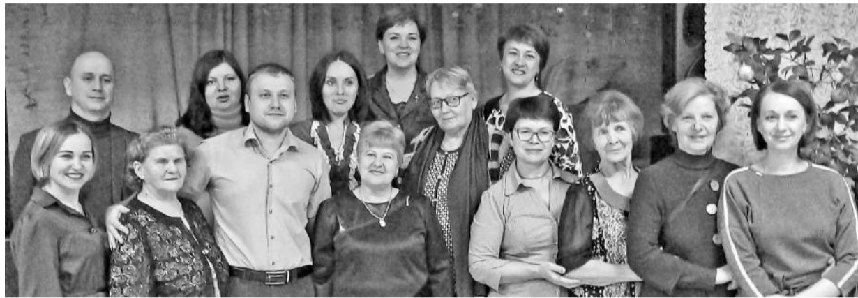
Как здорово, что все мы здесь сегодня собрались!