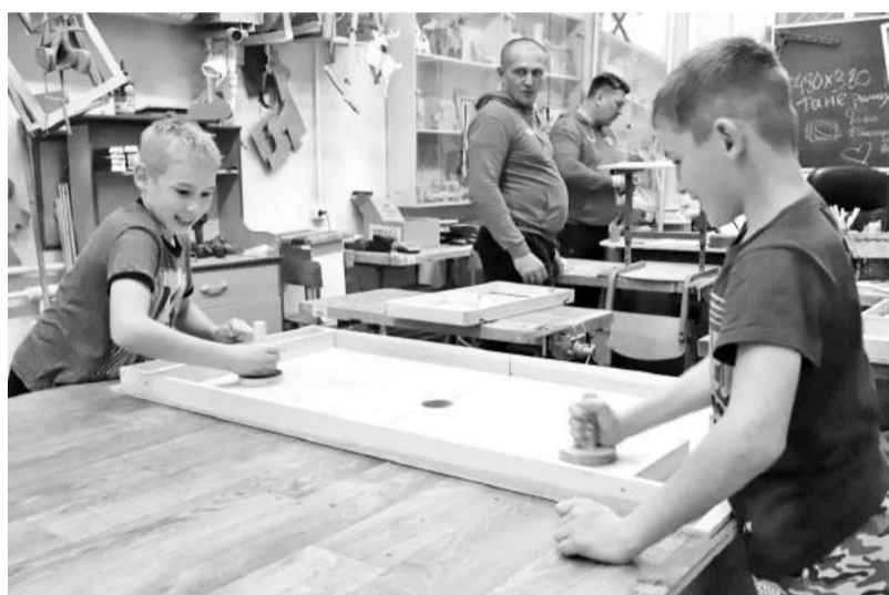
Юные мастера в деле

Конкурс «Вдохновляй и действуй» - часть большой социальной программы РУСАЛа «Помогать просто», которую ещё в 2015 году лично поддержал основатель компании Олег Дерипаска. По его же инициативе много лет назад металлурги взяли шефство над детским домом. За это время проведены сотни совместных мероприятий. Компания регулярно оказывает финансовую поддержку, а сами металлурги стали для «Ласточки» близкими друзьями, которые