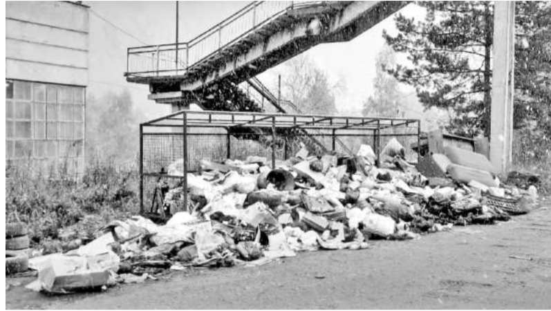
Снесли на свалку всё, что себе негоже

Соцсети буквально пестрят обращениями граждан, негодующих по поводу наличия глобальной стихийной свалки в районе виадука в посёлке Черёмушки. Люди говорят, что первые кучи мусора появились почти год назад, и с тех пор здесь выросли целые горы различного хлама.