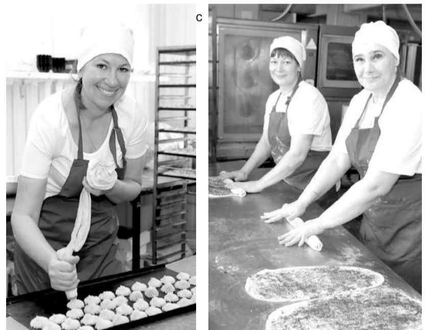
Традиции качества передаются из поколения в поколение

Также всем коллективом еженедельно тестируется вся выпускаемая продукция, а в перечне наименований уже около 80 разнообразных изделий - 40 сортов хлебобулочных изделий и столько же сладких вкусняшек. Традиционный первый и второй сорт, пшеничные и ржаные хлеба, сдобные и бутербродные батоны, элитные сорта - оригинальная «Семечка» с ядрами подсолнечника, ароматный «Пикантный» с кориандром, изысканный «Боярский»