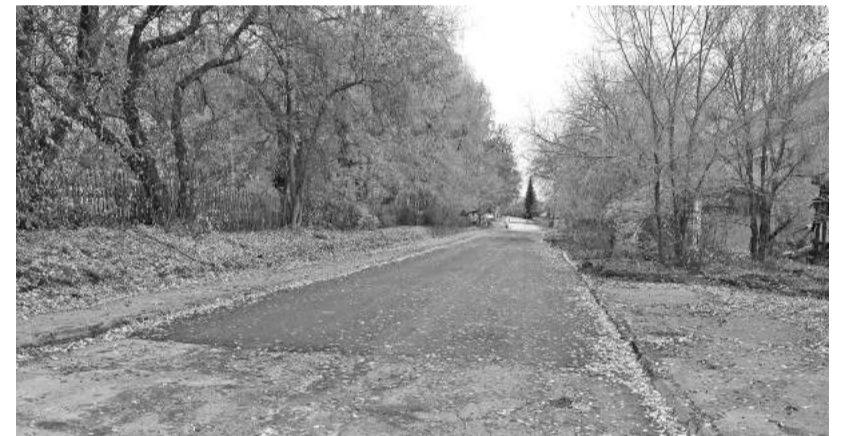
Ямы спрятались, «дорога серую лентою вьётся»