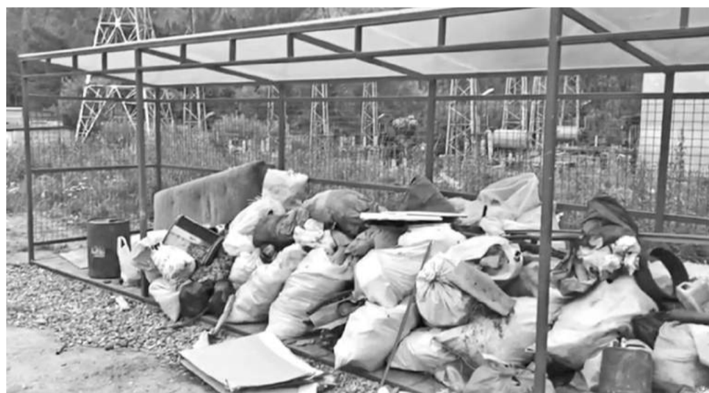
Площадка здесь, а где контейнеры?

Как правило, эти мусорные завалы убираются с привлечением работников КБО, на что дополнительно тратятся деньги из городского бюджета. Что получается в остатке? А ровно то, что выброшенный мусор оплачивается дважды: сначала жителями, согласно сумме в платёжных документах, затем - муниципальной казной. Мусор, собранный со свалок на контейнерных площадках, как правило, работники городского коммунального ведомства вывозят на территорию КБО, откуда «продуманный» регоператор забирает его за оплату, равную семистам рублям за кубометр. Экономическая выгода при таком мусорном раскладе просто зашкаливает. Пора эту «лавочку» прикры-