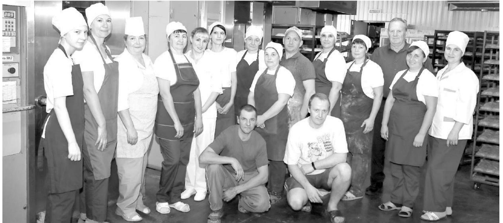
Четверть века «Мицар» радуется саяногорцев разнообразием хлебобулочных изделий