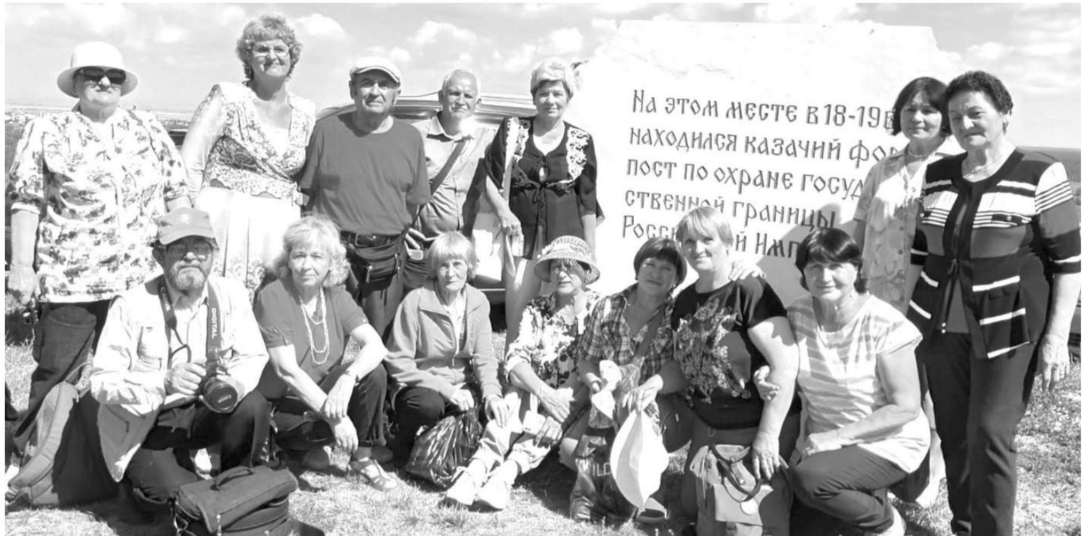
В день рождения «Стрежня», 6 июня, стревнецы побывали на караульной горе Крестик, где в этот день проходил фестиваль казачьей культуры