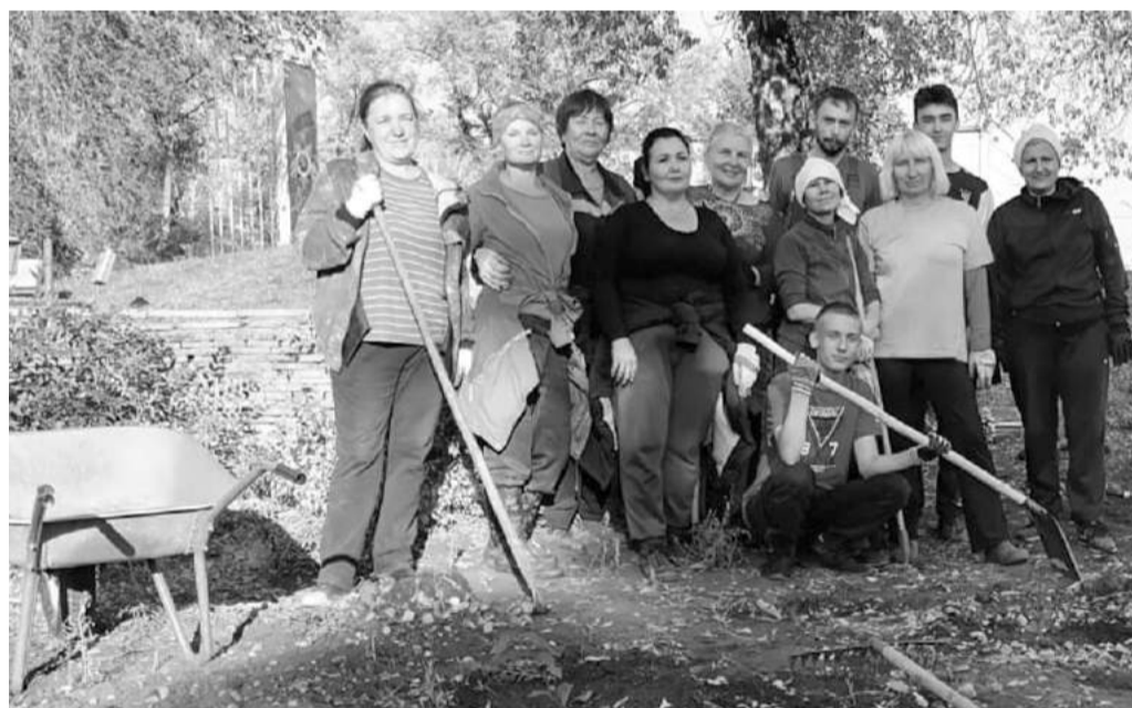
Высадку саженцев на трёх площадях завершили!

- Прежде чем заняться посадками, на газонах трёх площадей мы выкосили весь бурьян. Затем, согласно проектной