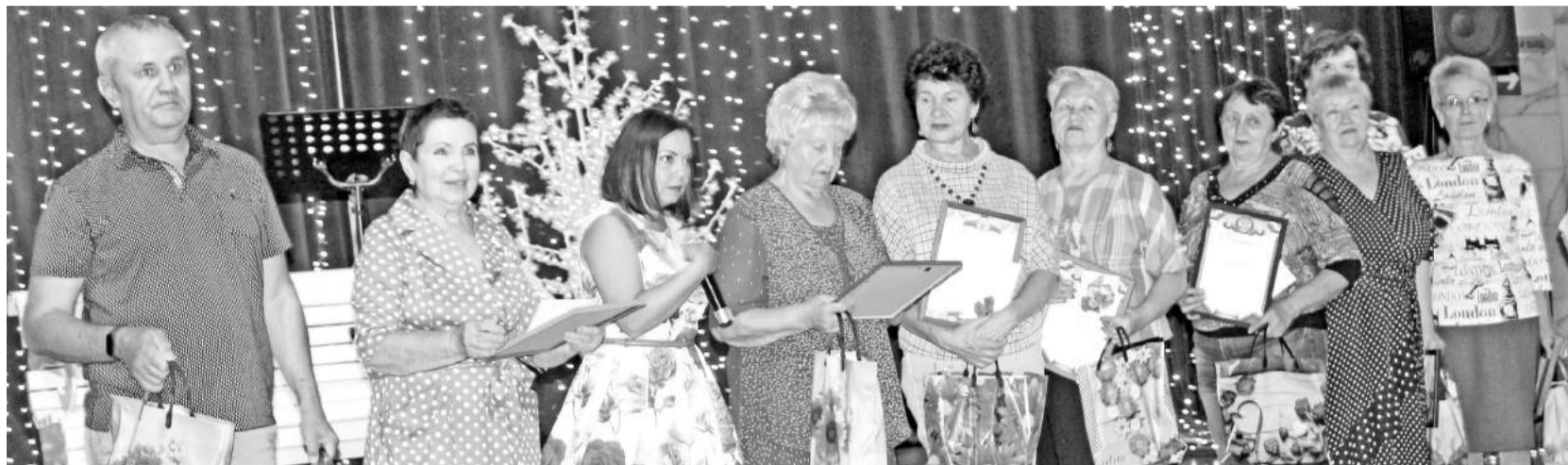
Их труд приносит людям радость