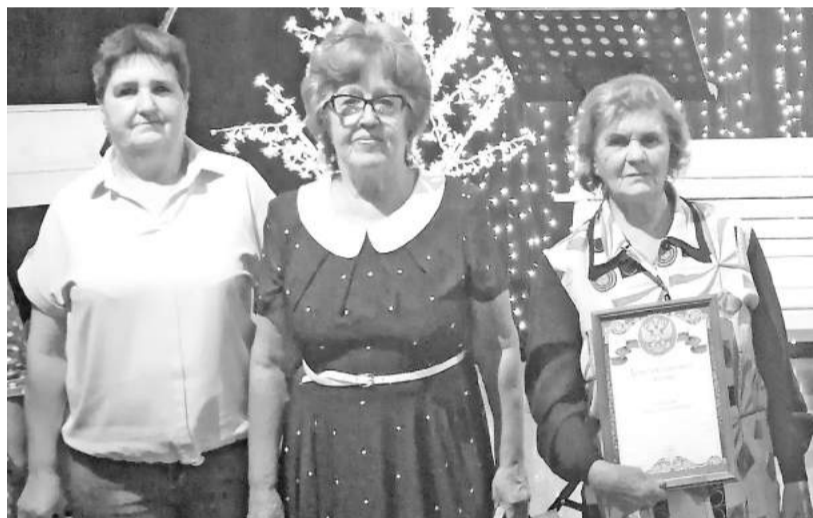
Давайте вместе землю украшать!