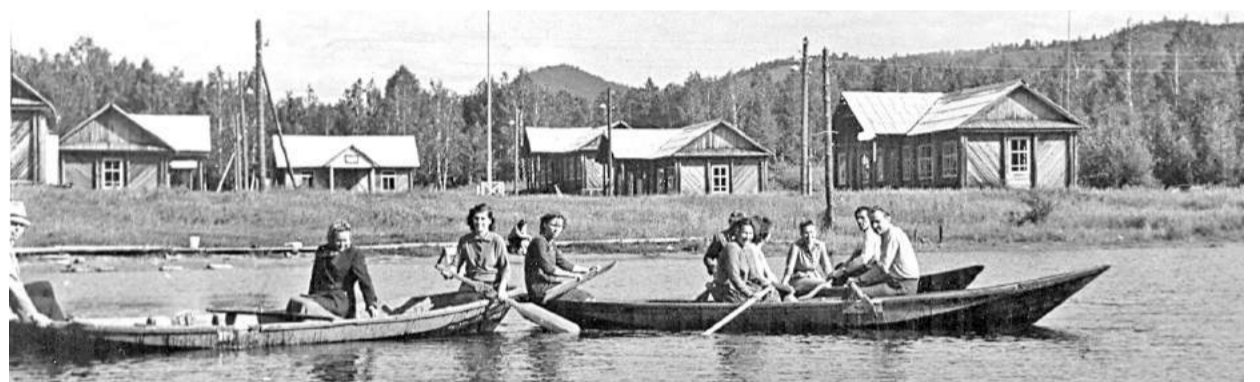
Вожатые пионерлагеря «Сокол» катаются на лодках по озеру. Год 1960-й

Второй раз Майна как промышленный населённый пункт возродилась в 1946 году, когда геологи Запсибцветметразведки из Томска приступили к подсчёту промышленных запасов Майнского медного рудника. В 1950 году разведка завершилась, и горняки Енисейстрой МВД СССР, в основном из числа репрессированных (немцев, украинцев, прибалтов, татар, молдаван, русских), стали добывать подземным способом медно-колчеданную руду, обогащая её на фабрике, построенной чуть позже. На строительство ТЭЦ, водозабора и обогащательной фабрики требовался кирпич, для этого в районе, где сейчас находятся индивидуальные гара-