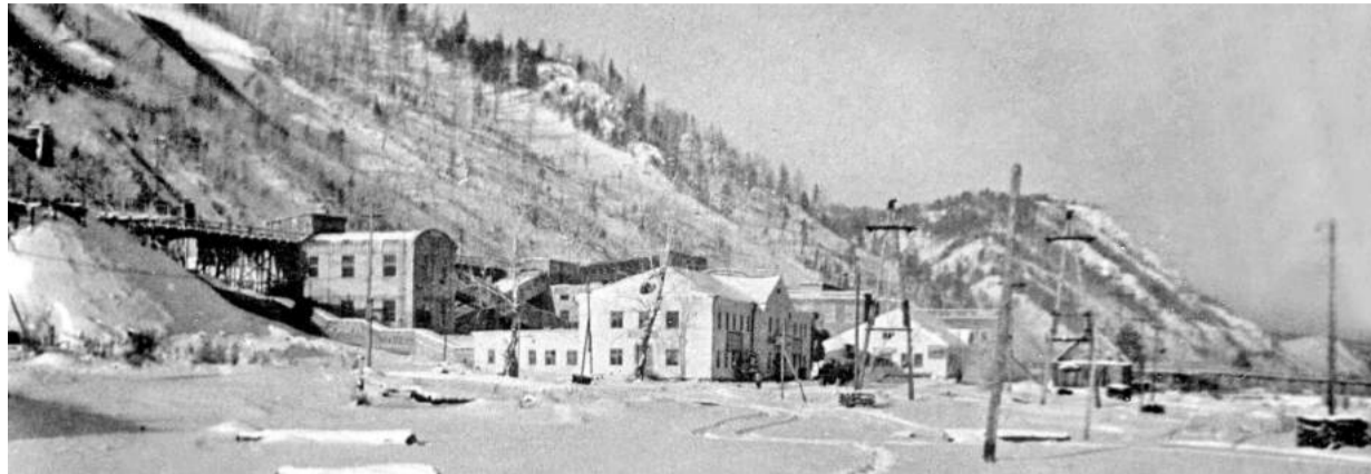
Обогащительная фабрика и рудоуправление. Год 1957-й

В конце 40-х - начале 50-х годов прошлого века сосланные в Майну из европейской части СССР трудармейцы заготавливали лес-кругляк в тайге у берегов Енисея и в долине реки Уй. Технология лесозаготовки была простой: лесорубы двуручными пилами, топорами, клиньями и стальными вилками на длинных шестах валили деревья, очищали стволы от сучьев, распиливали их на брёвна и при помощи деревянных ваг скатывали в воду. На Енисее из брёвен вязали большие и малые плоты, а затем сплавщики доставляли их к месту назначения. Транспортировали кругляк и с помощью лошади, запряжённой в передок от телеги. На него укладывался и фиксировался верёвкой один конец бревна, а второй тащился волоком.