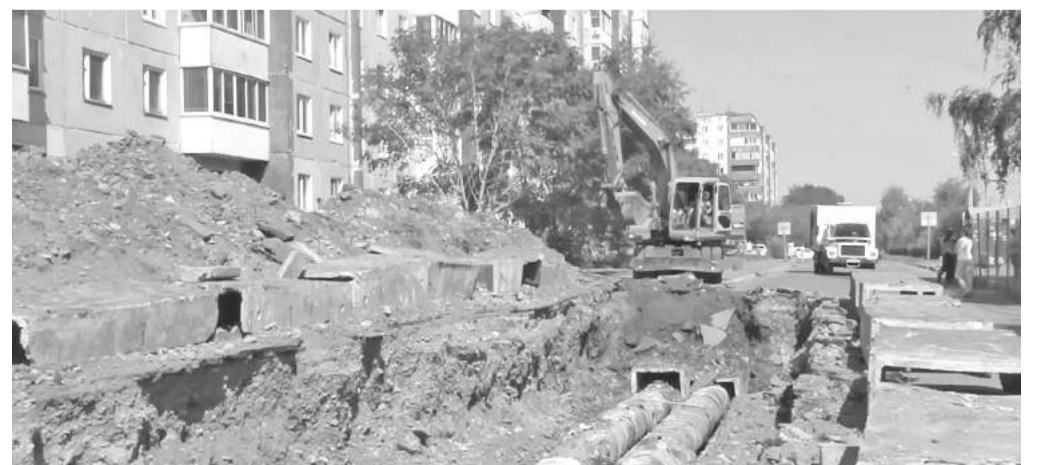
Материалы подготовила Валентина ЗНАМЕНЕВА

Восстановление территории после ремонтных работ компания «Байкалэнерго» должна осуществить осенью текущего года.