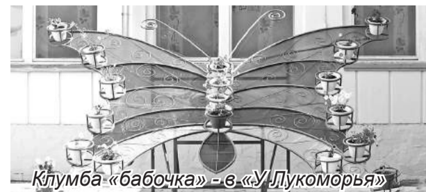
Клумба «бабочка» - в «У Лукоморья»