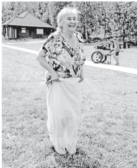
Бег в мешках: и трудно, и смешно

Вот и лето было очень насыщенным: мы отдыхали на берегу Енисея, с удовольствием осматрели известную на всю Хакасию «Тортугу». Неизгладимое впечатление оставила поездка в