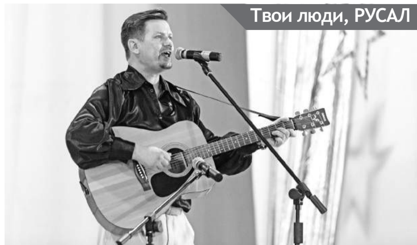
Твои люди, РУСАЛ