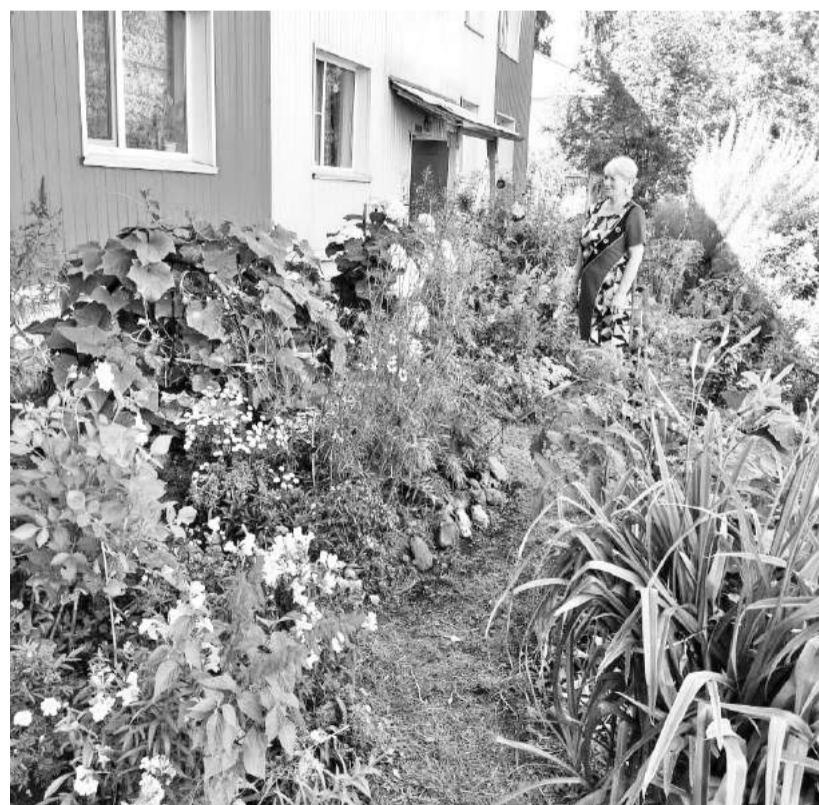
ТОС «Жарки» - мир цветов и ароматов

О каждом из этих территориальных общественных самоуправлений можно говорить много, долго, с большой благодарностью. Примерно так, как о ТОСе «Жарки», действующем в многоквартирном доме по улице Гагарина посёлка Майна. Усилиями его актива приведена в порядок придомовая территория. Вместо лужайки, на кото-