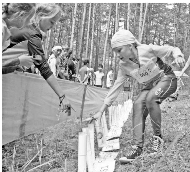
К победе - дружной командой!

Авторы проекта уверены, что участие в программе станет уникальным жизненным опытом для каждого ребёнка. Ведь спортивное ориентирование -