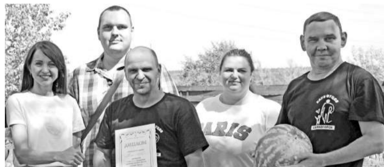
Задачи квеста щёлкнули как орешки

Тёплым и солнечным субботним сибирским утром с площади краеведческого музея стартовал увлекательный квест «Узнай свой город».