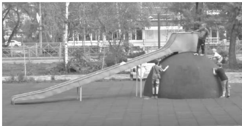
Дела благоустройства идут в гору!

предназначение - быть одним из самых востребованных местом отдыха и развлечения для саяногорцев и гостей города.