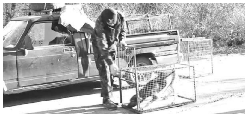
Шарик, подь сюда!