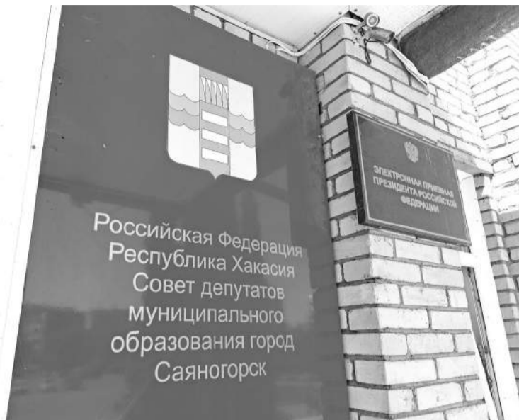
11 сентября выбираем главу города и депутатов Совета депутатов

В Саяногорске продолжается избирательная кампания: осенью горожане будут выбирать главу города и депутатов Совета депутатов.