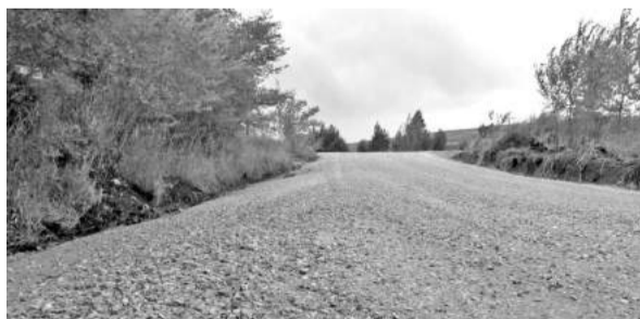
Ровная, как яичко: катись не хочу!

На Ай-Дайе подрядчик завершает долгожданный ремонт грунтовой дороги, протяжённостью 480 метров, ведущей от озера к остановке «Восточная». Основным этапом ремонтных работ выполнен. Дорогу отсыпали, расширили, укатали катком, а также сделали более плавным уклон дорожного полотна. В работе была задействована тяжёлая техника - мехлопата, грейдер, каток, экскаватор и автотранспорт.