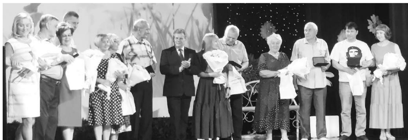
Семь семей Саяногорска получили памятные медали «За любовь и верность»