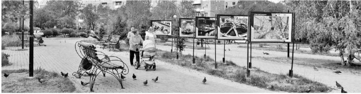
Горожанам интересно знать, чем живёт завод

Ко Дню металлурга в сквере имени первого директора Саяногорского алюминиевого завода В.В. Стриго открылась уличная фотовыставка, посвящённая 90-летию алюминиевой отрасли в России.