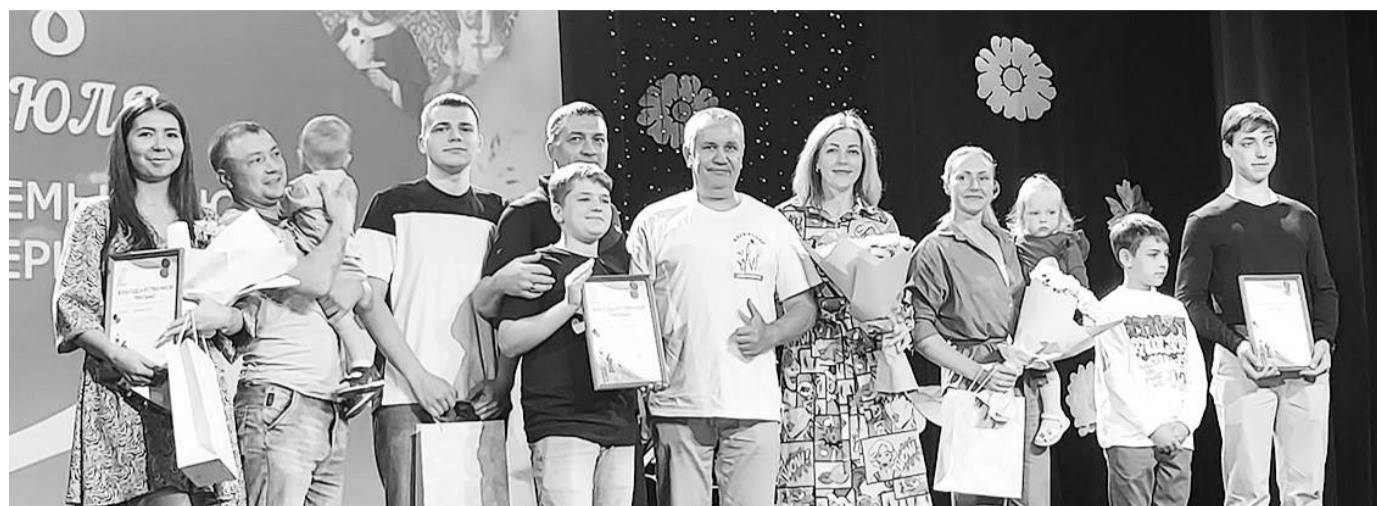
Победители фотоконкурса «Крепкая семья» от Клуба отцов