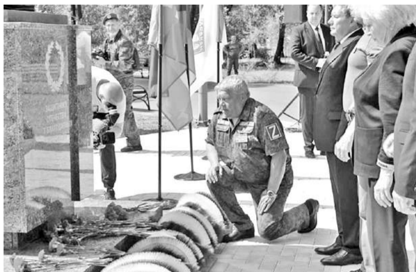
Преклоняем колени перед памятью павших...

вместе, мы сплотились, армии нужна наша поддержка. Мы все за Путина, все за Родину, все за Россию!