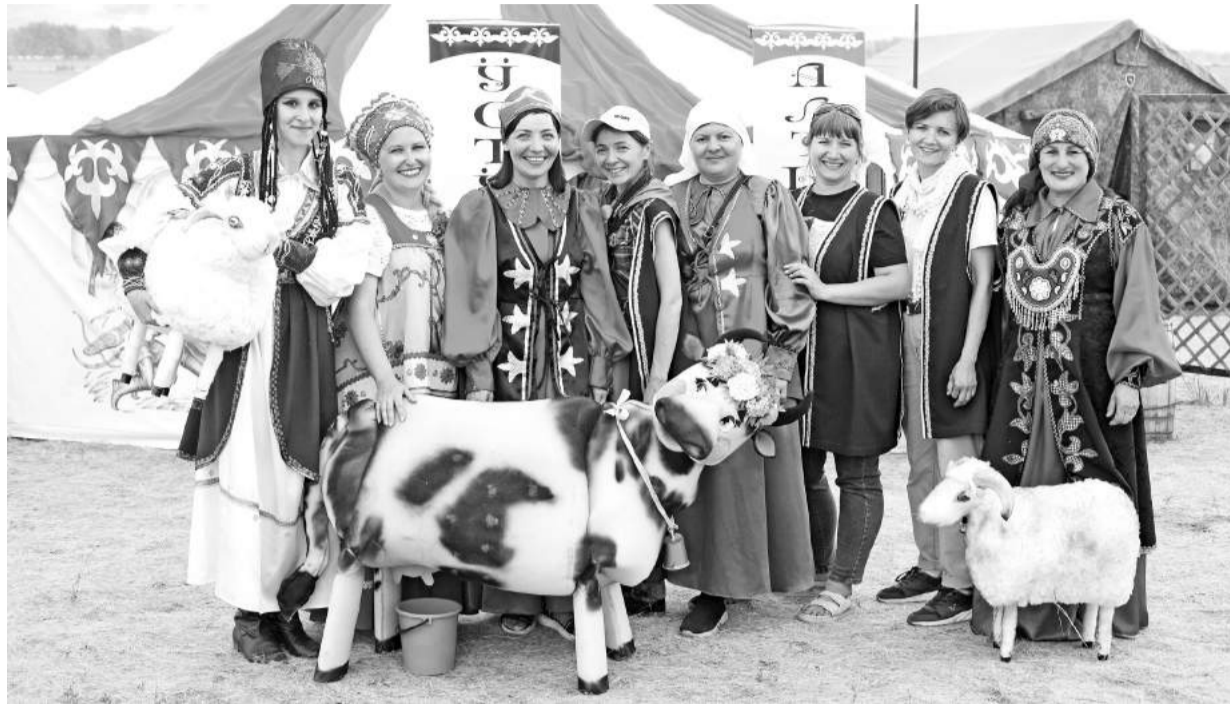
Саяногорская делегация на фоне летней усадьбы

В России - на земле родной - живём мы все большой и дружной семьёй