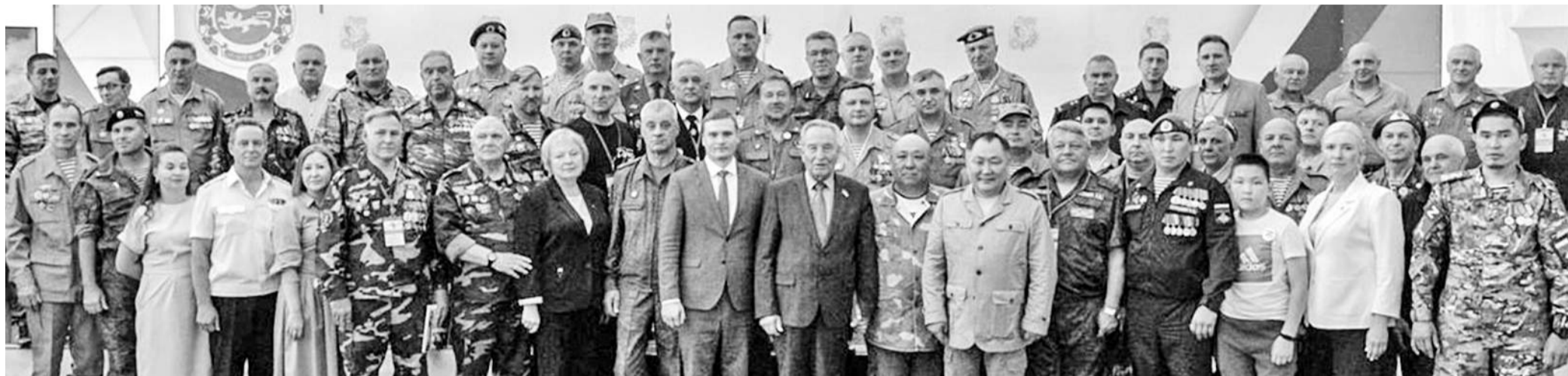
Наше дело правое, победа будет за нами!