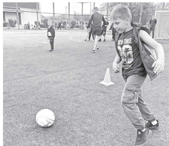
Будущие чемпионы времени даром не теряют