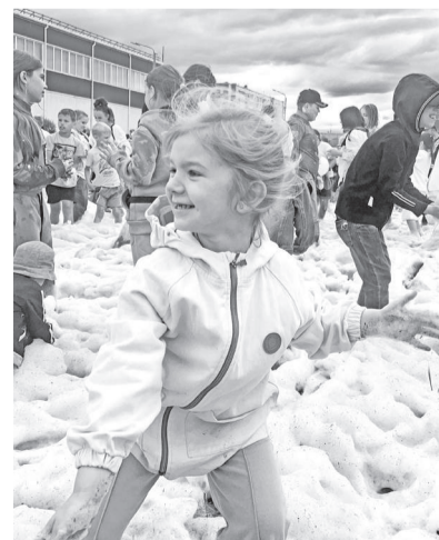
Пенная вечеринка: танцы в облаках