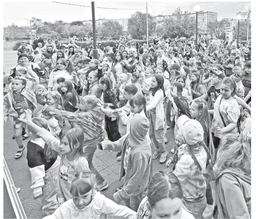
На праздник собрались сотни маленьких саяногорцев