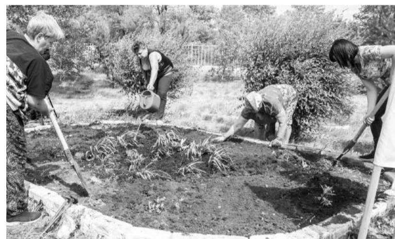
Садоводы нынче в ударе!

В завершение праздника организаторы выразили благодарность помощникам и благодарителям из общественной организации «Женская инициатива», коллективного члена Всероссийского общественного движения «Матери России», директору регионального отделения благотворительного