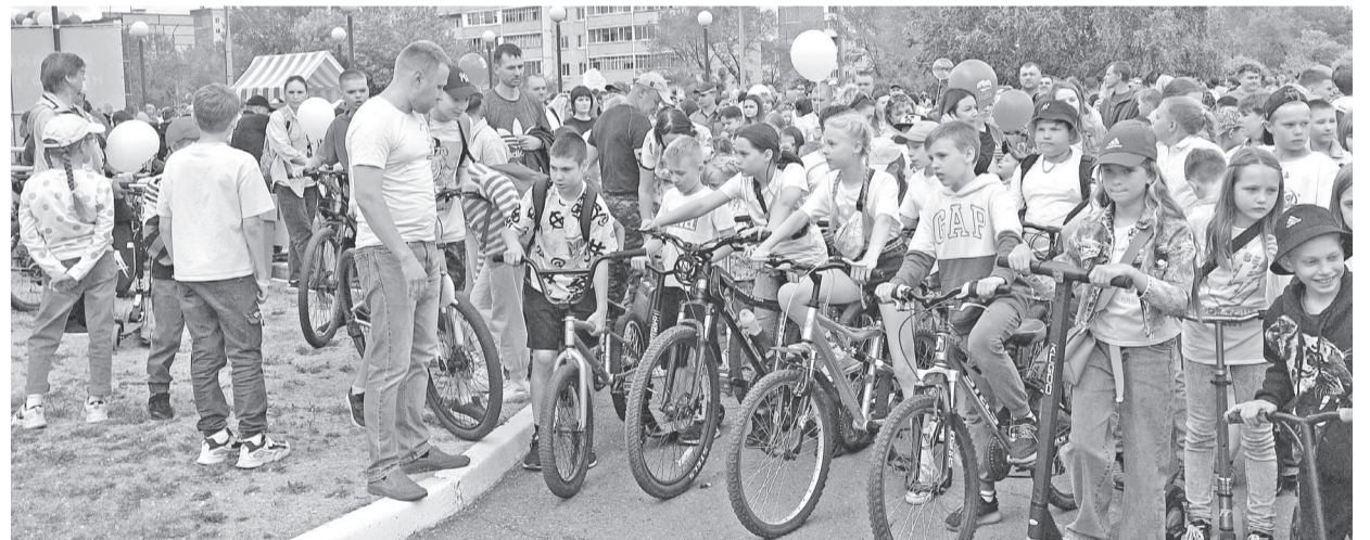
На старт, внимание, марш!