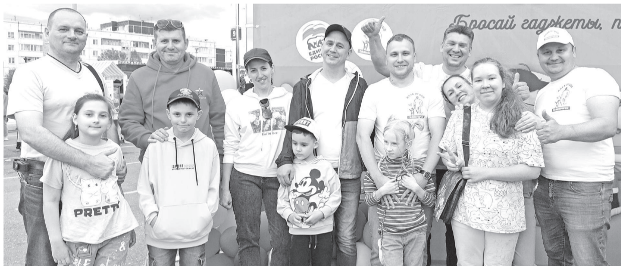
«Клуб отцов» поздравляет всех с праздником детства и началом лета!