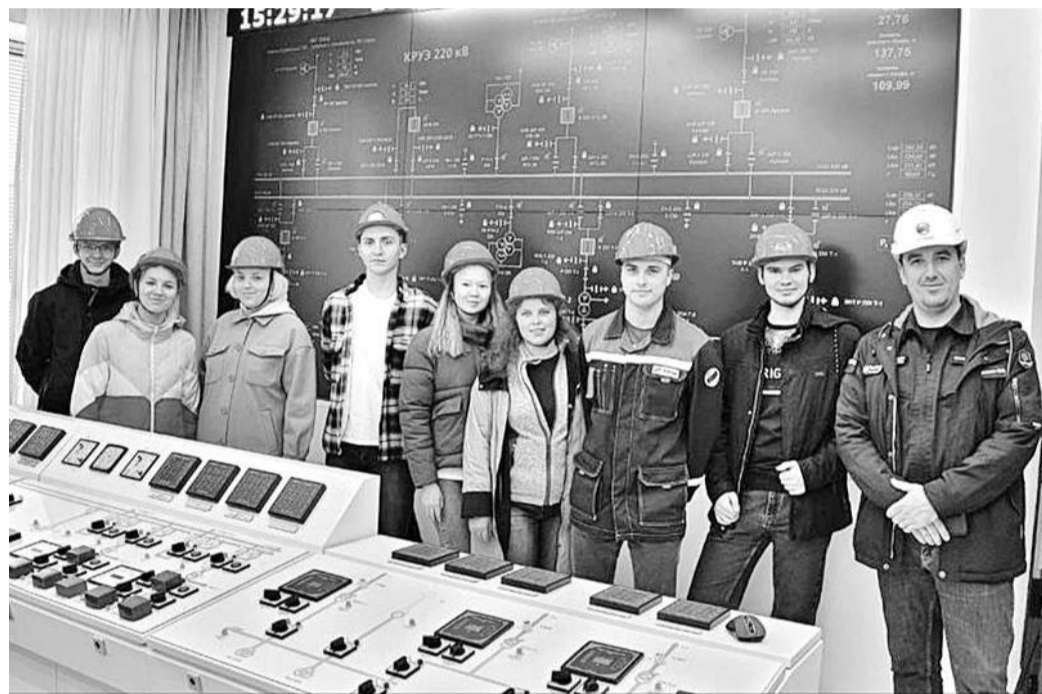
Студенты на технической экскурсии