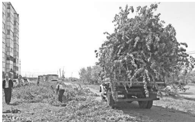
Была роща, стала просека (улица Шушенская)

- Часть живой изгороди, превратившейся в дикоросы, нам удалось почистить, произвести обрезку, привести в божеский вид, - говорит главный агроном. - Всем понятно, что город нельзя оставить без зелёных насаждений. Но большие