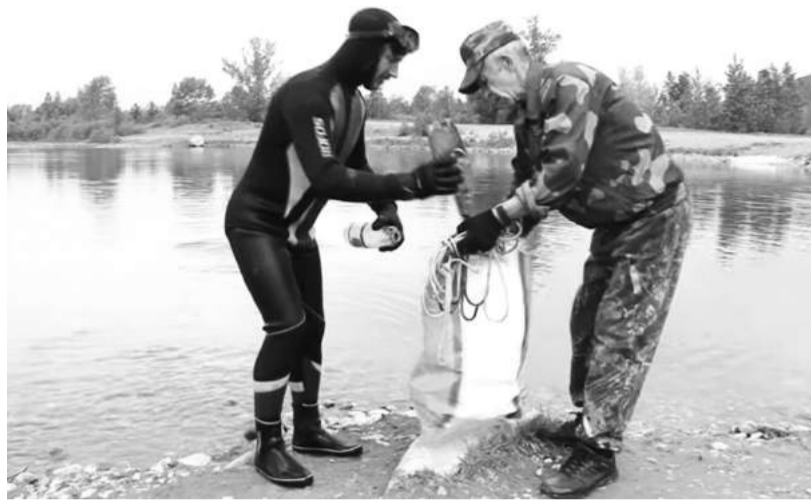
«Клад» со дна водоёма - в мусорный мешок

Согласно документу, на время купального сезона созданы общественные спасательные посты в местах отдыха и купания на водо-