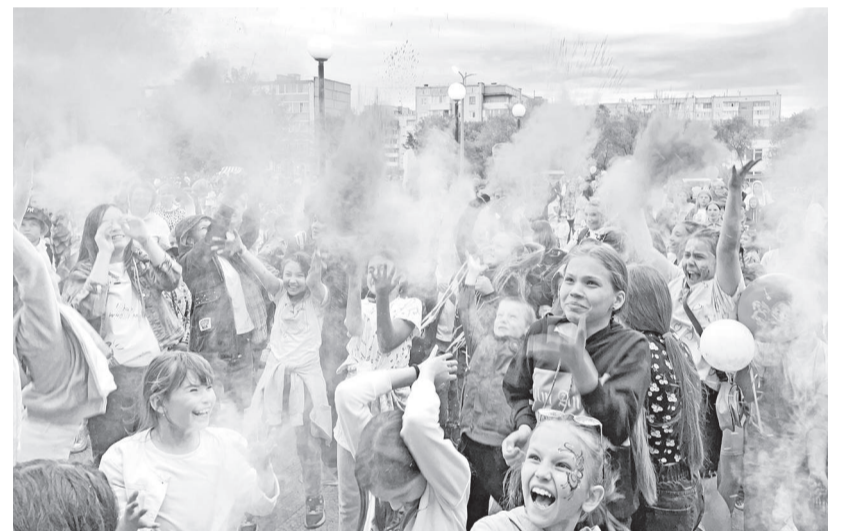
Краски холи: яркое развлечение для всех