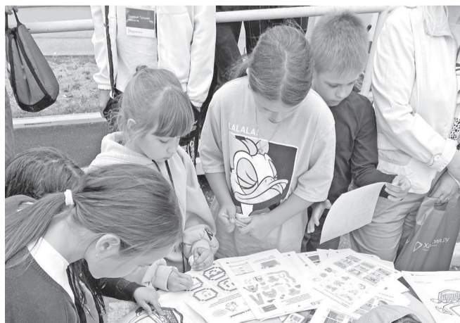
И развлечение, и обучение. Найти правильный ответ на задание не всегда просто