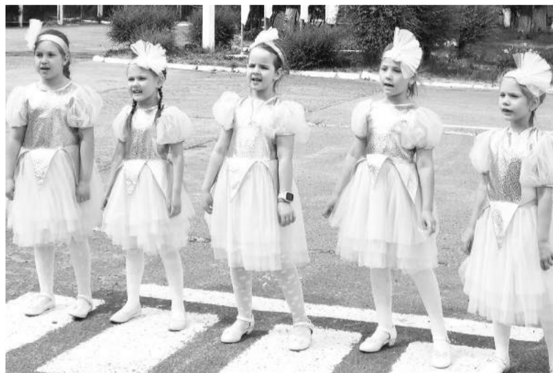
Пойте вместе с нами