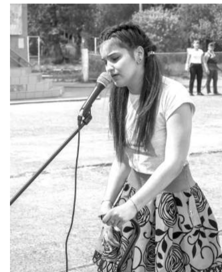
«Оранжевое солнце» светит всем