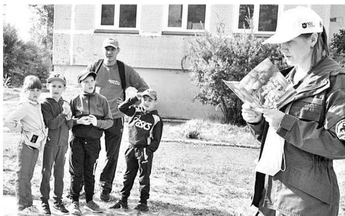
Изучали географию в познавательных заданиях

С большинством предложенных вопросов игроки справились, а те, кто не сумел дать точный ответ, выполняли шуточное задание, к примеру, изобразить цаплю, стоящую на одной ноге, показать, как ходит медведь и т.д.