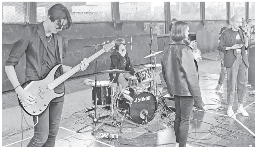
Концерт от кавер-группы VPN не испортил даже начавшийся дождик