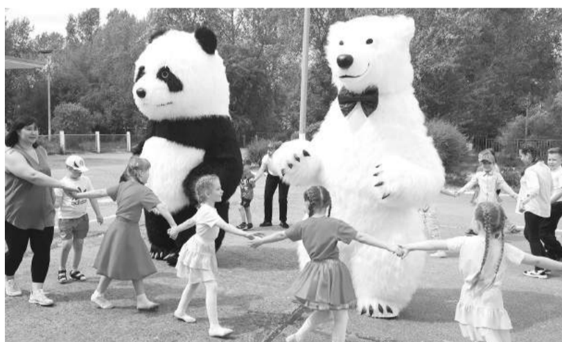
Встаньте, дети, встаньте в круг!

Поддержать хорошее дело и поздравить своих маленьких товарищей из «Милосердия» с началом каникул и Днём защиты детей в этом году пришли воспитанники Саяногорской детской музыкальной школы. Задорные песенки