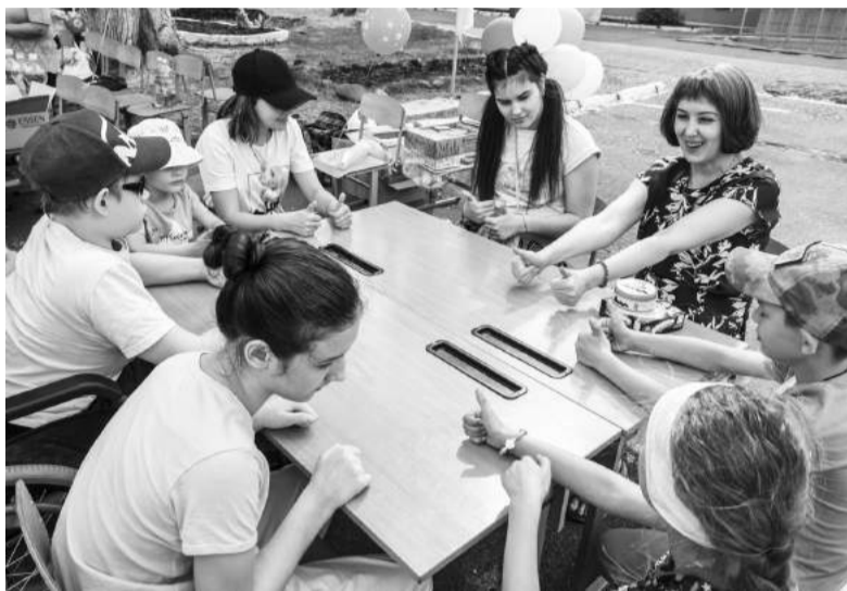
Нейрогимнастика развивает ум и мелкую моторику