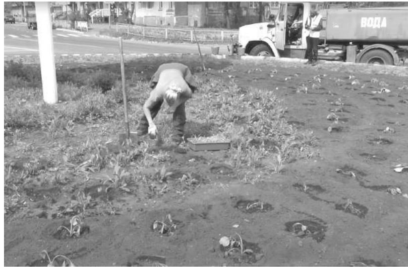
Высадка и полив рассады на кольце у кассы Аэрофлота

Тем не менее плотненько засажены цветами большие клумбы на дорожных кольцах в районе Узла связи и кассы Аэрофлота, возле кинопарка «Альянс», городской Доски почёта и на двух клумбах перед зданием администрации города. Там высажены бархатцы, однолетние георгины «Весёлые ребята», лаватера агератум,