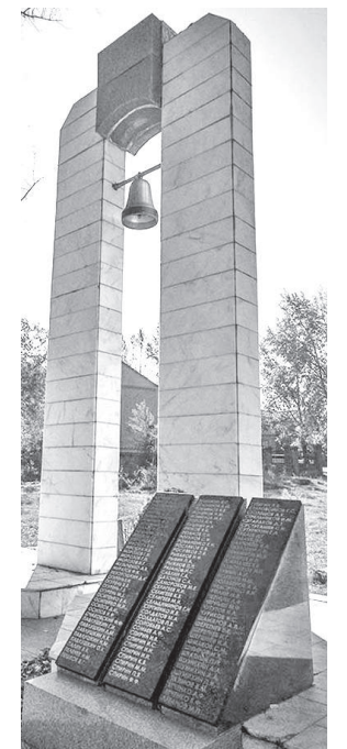
Памятник «Колокол» в Парке Победы