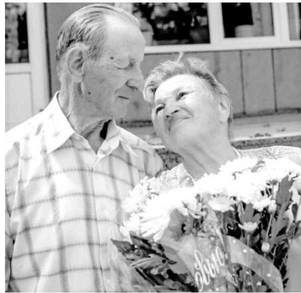
и... 57 лет спустя