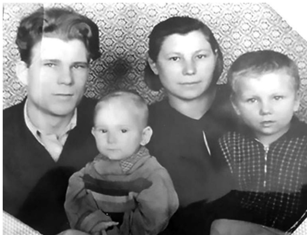
Папа с сыном, мама с дочкой - древа первые листочки!