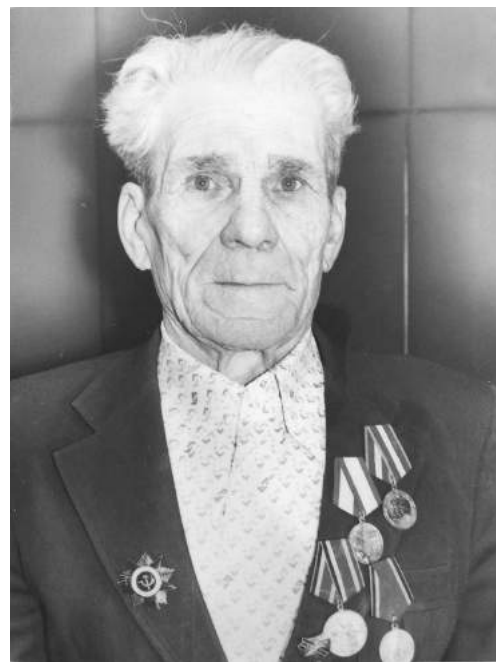
Навечно в памяти потомков