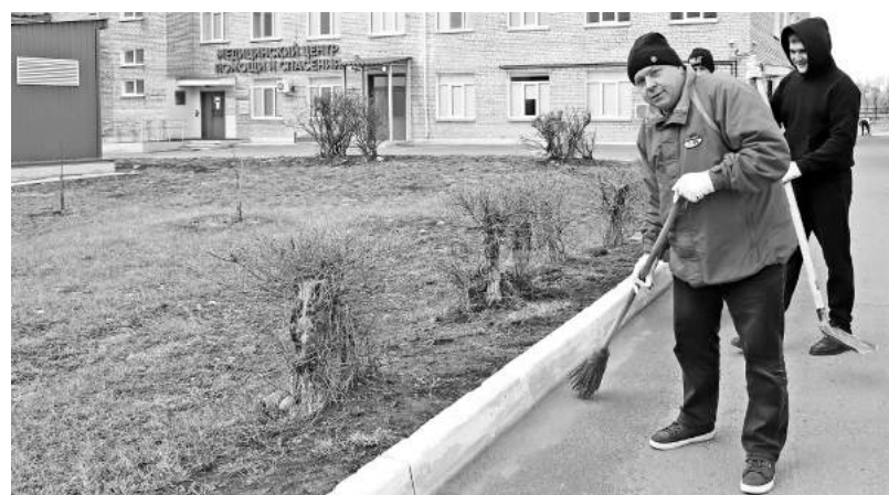
Трудовой десант металлургов работает на благо города

На газонах уже пробивается свежая трава, которую важно освободить от сухостоя. С этим заданием успешно справляются не только взрослые, но и дети. - А грабли тяжёлые?