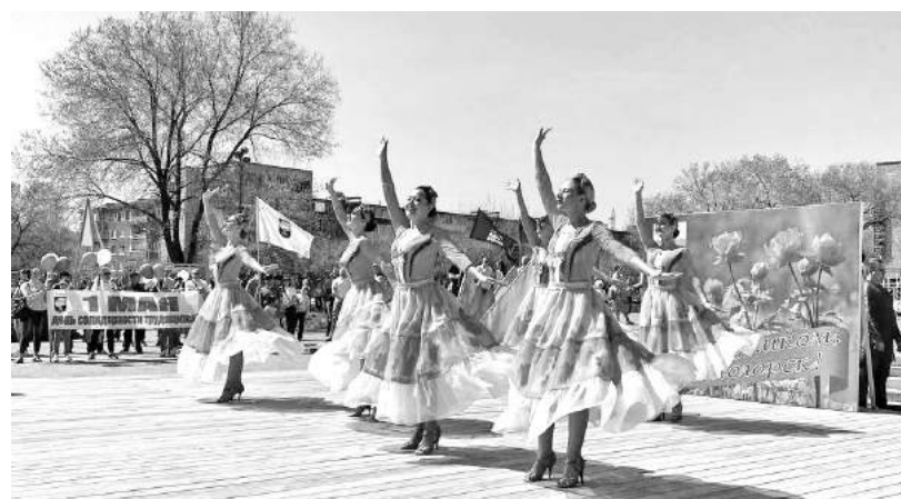
Праздничное настроение дарят «визитовцы»

По традиции, для зачитания резолюции митинга и поздрав-