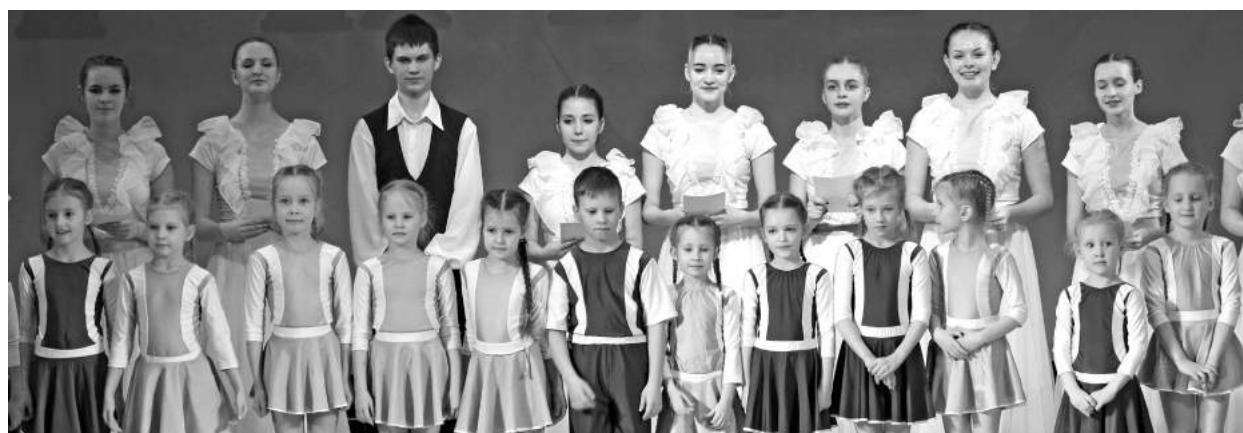
По традиции, начинающие танцовщицы готовятся произнести торжественную клятву