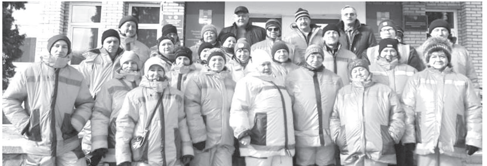
Вместе мы - сила!

- Ответственность, действительно, огромная. Поэтому мы создали в КБО водопроводный участок, где трудятся профессионалы своего дела, включая мастера участка Евгения Белоглазова, инженера по водо-