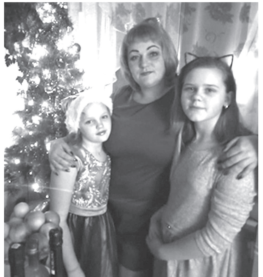
Вместе - душа на месте

- Первое время как-то хотелось поменять место работы, - напоминает моя рассказчица. - Драконила сама себя: иди, там и деньги другие, и профессия престижнее. А потом усовестилась: а чем уборщица помещений тебе не угодил? Буду трудиться там, где мне моё дело по душе. И пусть весь мир подождёт.