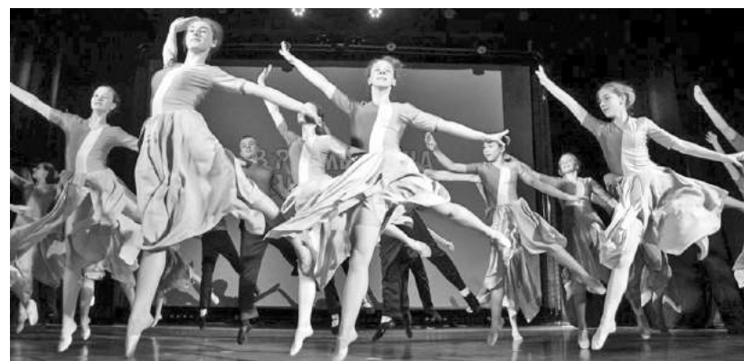
Настоящий полёт души!