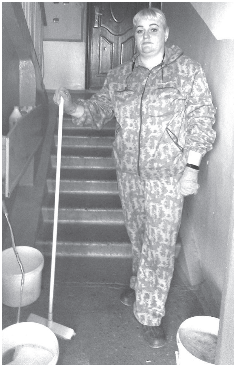
К работе готова

- Не буду прятаться по углам, заметив кого-то из знакомых. Корона не свалится только от того, что орудую шваброй и веником. Это мой выбор, моя работа, результат которой меня и жильцов моих пятиэтажек вполне удовлетворяет. Мне так удобно, вполне комфортно, и это я могу пожелать тем людям, которые идут на нелюбимую работу, сцепив зубы.