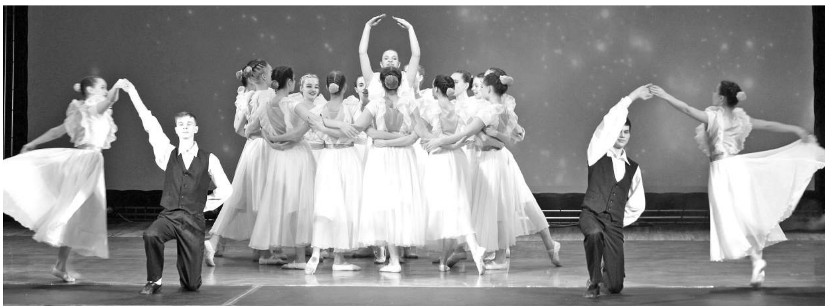
С первых занятий и до выпускного концерта вчерашние малыши вырастают в прекрасных лебедей