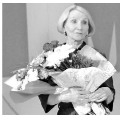
Поцелованная Богом! - так говорят коллеги о талантливом педагоге