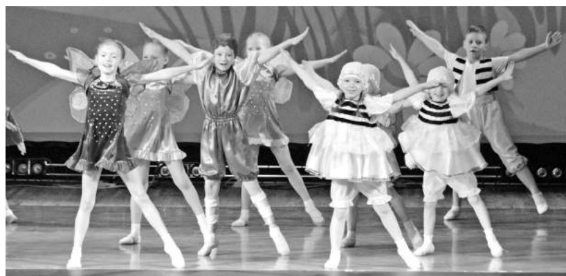
Детство не уходит - оно остаётся в «Ритме»!