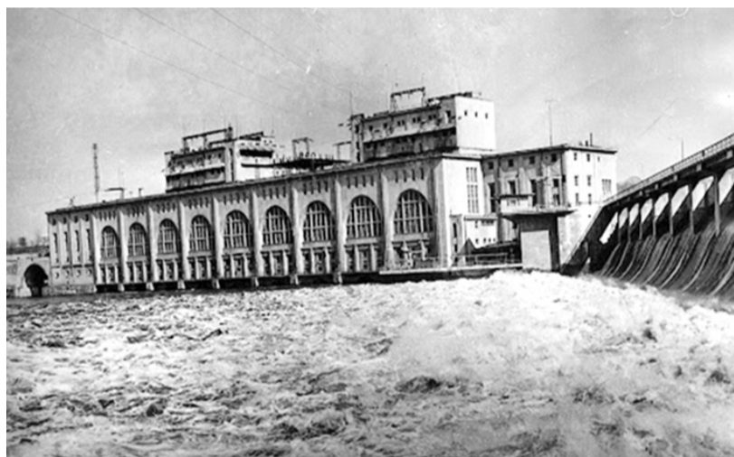
Волховская ГЭС (20-е годы прошлого века)

план ГОЭЛРО является общегосударственным планом создания материально-технического фундамента строительства социалистического общества, предусматривающий быстрый рост производительности труда и преимущественное развитие крупной машинной индустрии. Началось развитие отраслевых областей народного хозяйства на перспективу на основе их электрификации.