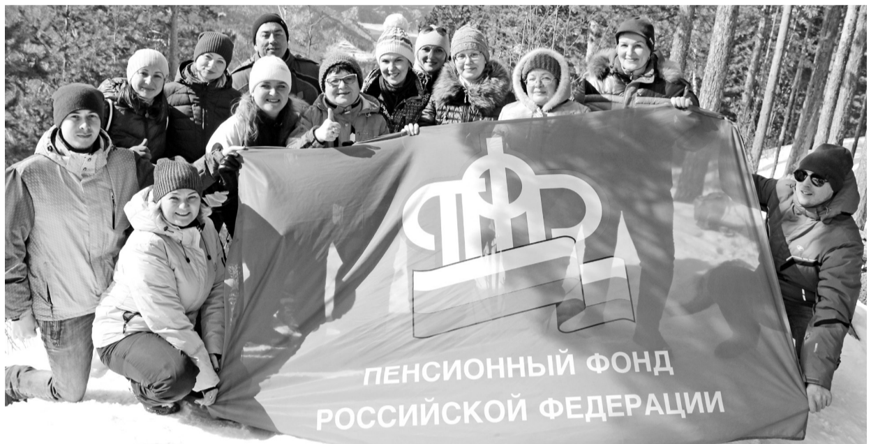
Дружный коллектив Пенсионного фонда умеет и работать, и организовать досуг

жизненных ситуациях. Чтобы обеспечить возможность пользования данными сервисами, проводится обучение пенсионеров старшего возраста. Важно отметить, что для повышения социальной адаптации ежегодно специалисты Управления обучают пенсионную грамотности студентов и школьников.