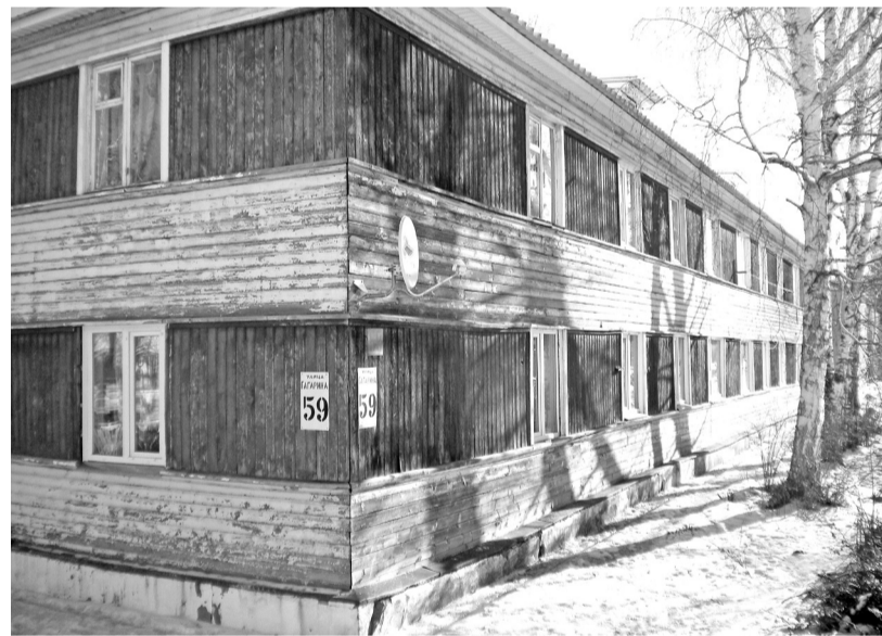
Обновление фасада по улице Гагарина, 59 (п. Майна) запланировано уже на следующий год

Документ рабочий, что доказано десятками домов, ремонт которых активные собственники приблизили с дальних периодов. В 2020 году по этому постановлению на 21 год приблизить удалось около десяти объектов в разных муниципалитетах республики. Один из примеров - дом в посёлке Майна, расположенный по адресу: ул. Гагарина, д. 59. В 2015 и 2016 годах на этом объекте уже был проведён капремонт. Подрядчик заменил кровлю и инженерные сети, а вот обновление фасада было запланировано на период