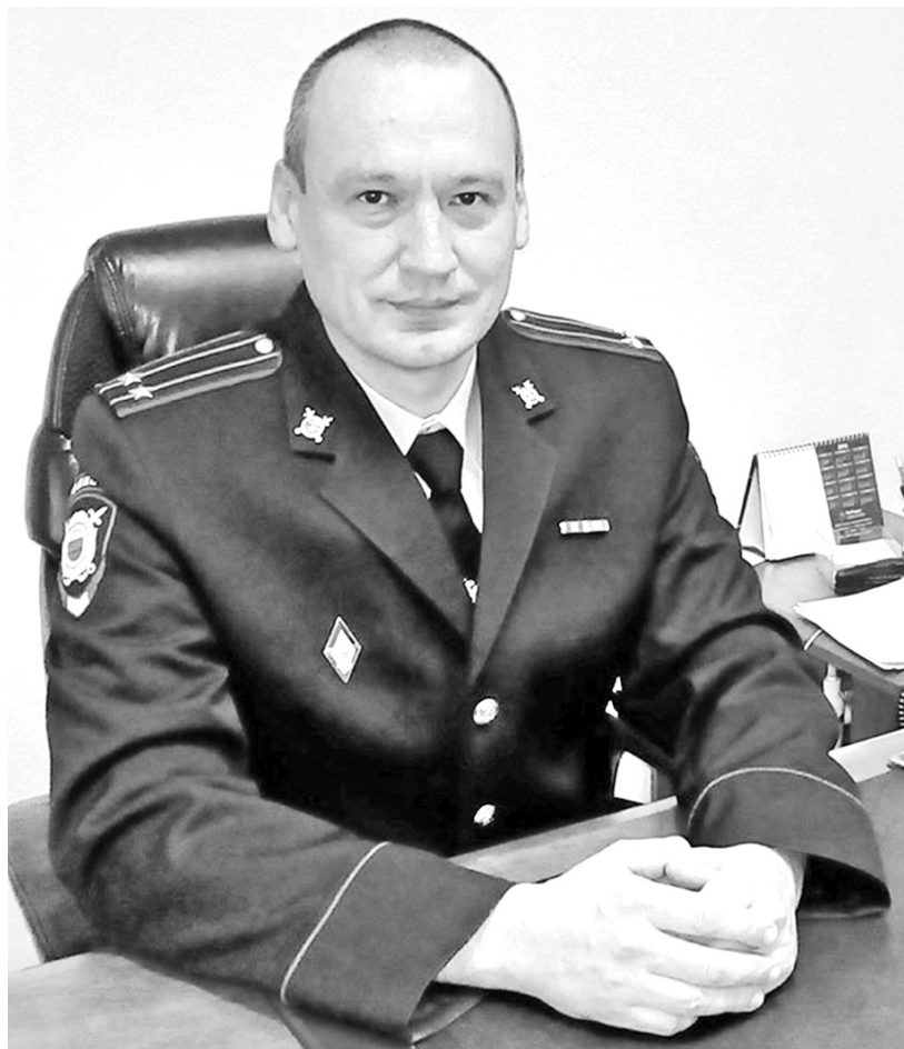
Андрей ГОЛОВИН, начальник ОМВД России по г. Саяногорску:

В отчётном периоде на 36 процентов больше раскрыто преступлений состава тяжких и особо тяжких. В целях повышения эффективности раскрываемости преступлений был проведён комплекс организационных и практических мероприятий, направленных на