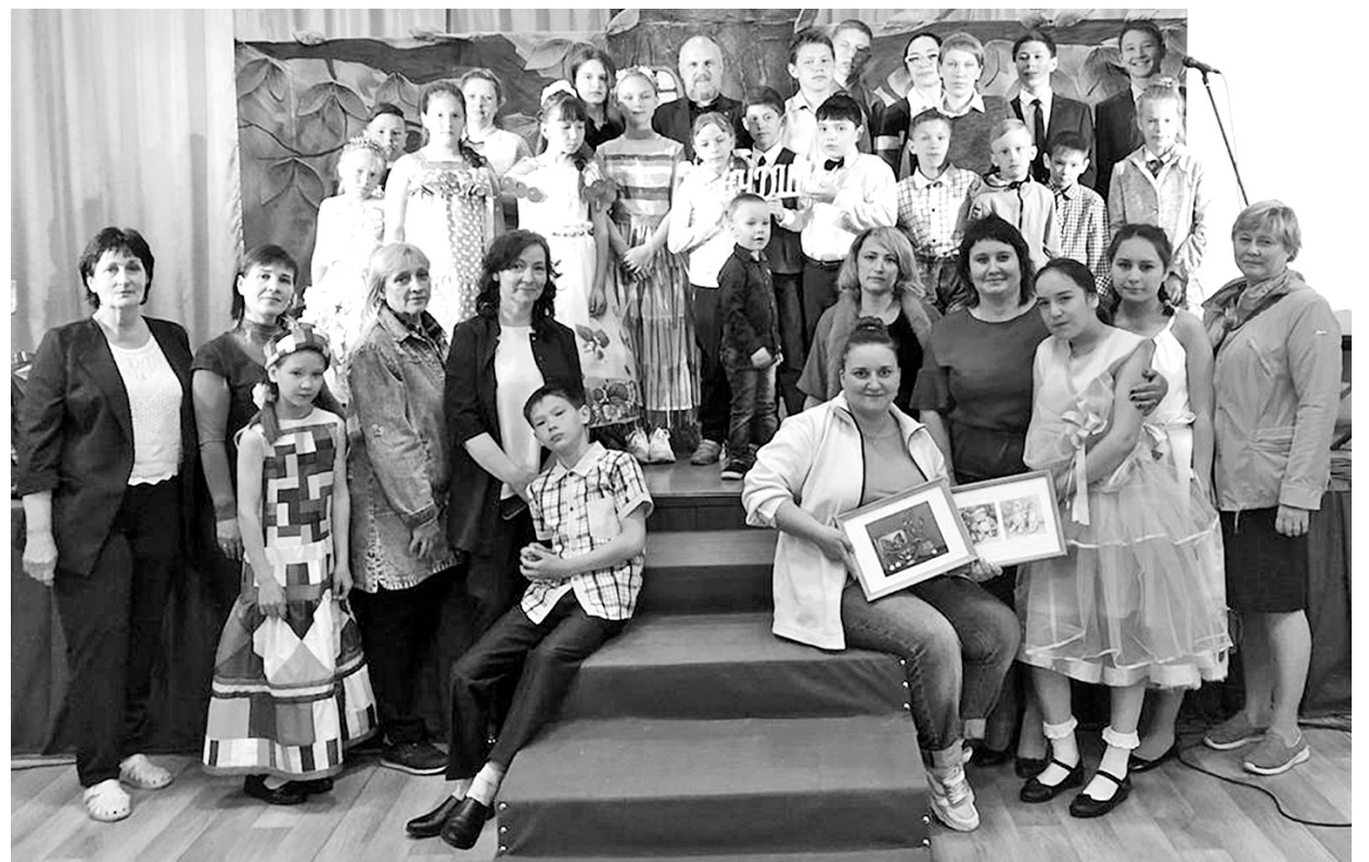
Саянские энергетики вместе с педагогами и воспитанниками Абазинского детского дома

ную благотворительную программу, направленную как на воспитание нового поколения профессиональных энергетиков, так и на формирование благоприятной социальной среды и улучшение качества жизни во всех регионах присут-