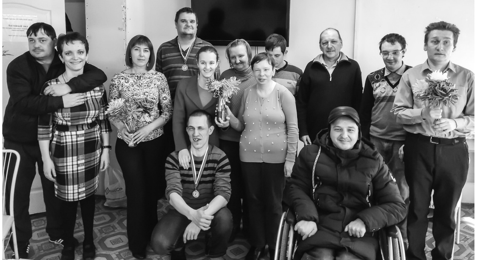
Радость будней творим своими руками

висты приняли участие в акции «Цветами улыбается земля» по благоустройству территории школы № 1 и общества инвалидов, а также в акции «Накорми животных!» по сбору круп и сухарей для братьев наших меньших. Мастерцы общества для городского конкурса «Сударыня Масленица» изготовили масленичную куклу-чучело. АНО «Оптима» провело акцию «Клубок добра»: умелицы связали для детей варежки, носочки и шапочки. Откликнулись члены общества и на онлайн-формат празднования Дня Победы, поддержав акцию «Голубь мира», «Мелодии и рифмы Великой Победы». Не остались в стороне и от всеобщей беды - в рамках волонтерского движения #Мывместешили тканевые маски для детей и взрослых. В первом полугодии людям с инвалидностью, попавшим в тяжёлую жизненную ситуацию, выдавались продуктовая помощь и обеденные наборы, а в течение года - хлебобулочные изделия, овоще-фруктовая продукция и необходимые вещи.