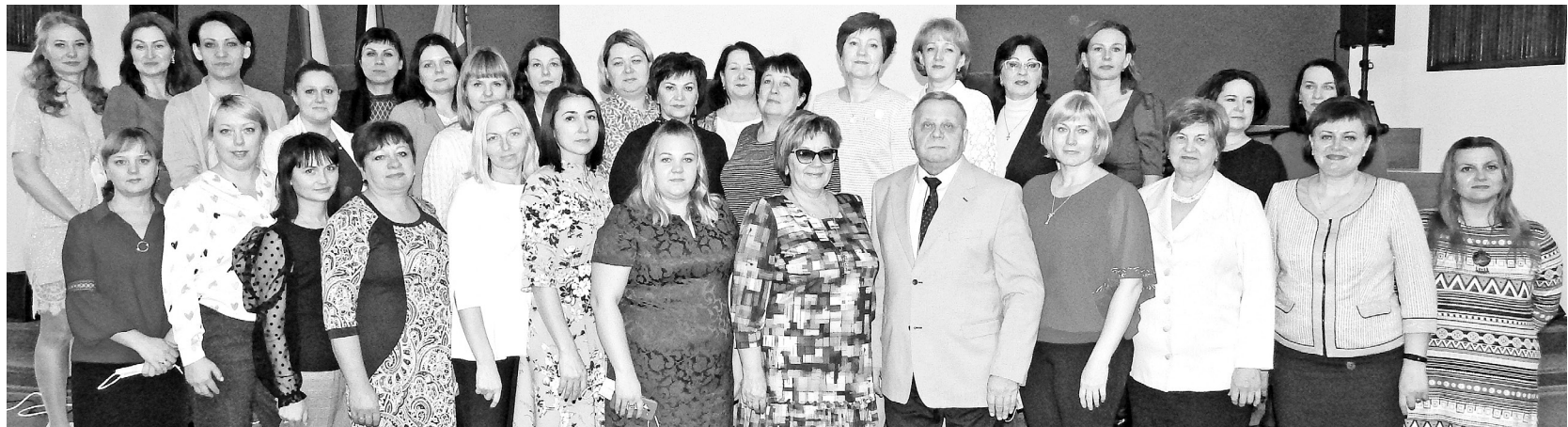
Коллектив к празднованию юбилея готов!

- Будучи директором первой школы, я чётко определился со своими целями, задачами, потому что за моей спиной стоял коллектив одной-единственной школы. А вот в роли руководителя гороо я первые месяцы вникал: что с ЭТИМ делать? Достаточно скоро понял: ответственность за всю городскую систему образования возлагается не на каждого отдельно взятого сотрудника отдела, а конкретно на меня - руководителя. Все, кто работают в гороо, также понимают: они - специалисты, осуществляющие контролирую-