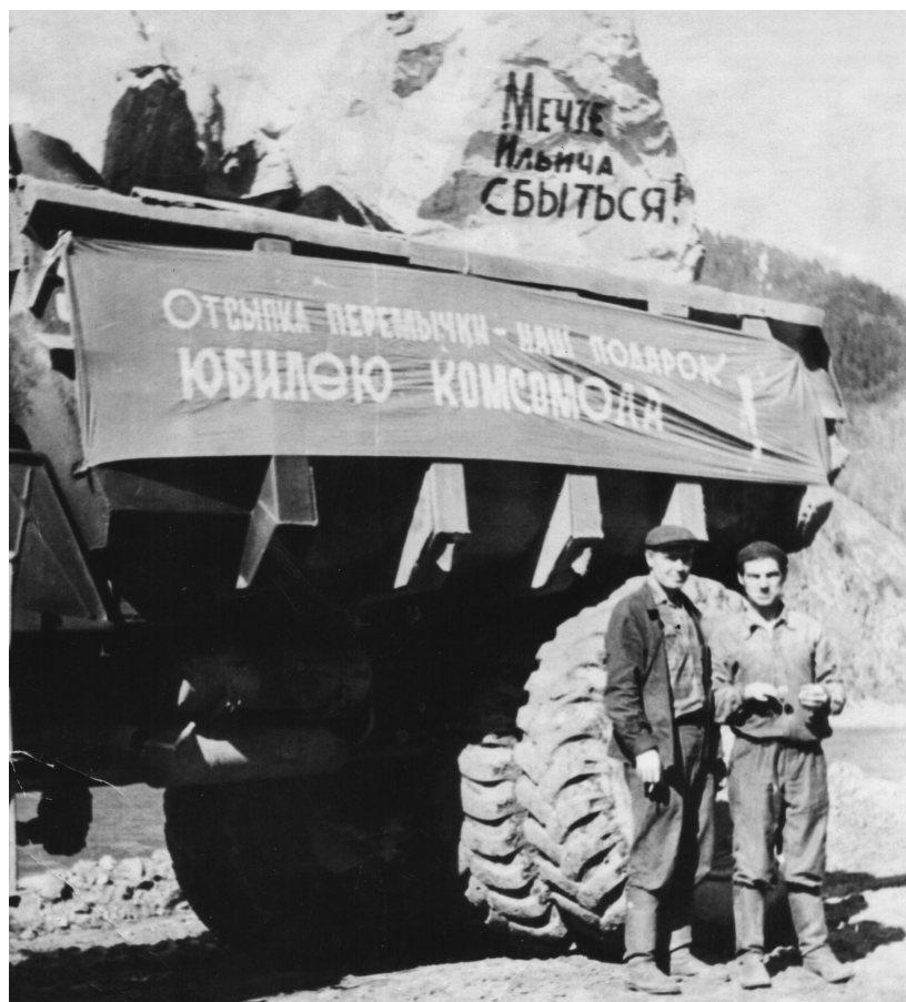
Боднар Борис Иосифович на фото справа

Ступил я на сибирскую землю 25 сентября 1963 года, устроился работать в управление «Абаканстройпуть» на строительство железной дороги Абакан - Тайшет. Скоро нашу бригаду с участка ГОРЭМ-38 перебросили в Означенное для подготовки базы и полотна для строительства ветки Камышта - Означенное. Поставили три солдатские палатки в районе современной автобусной остановки и приступили к строительству барачков под жильё и других