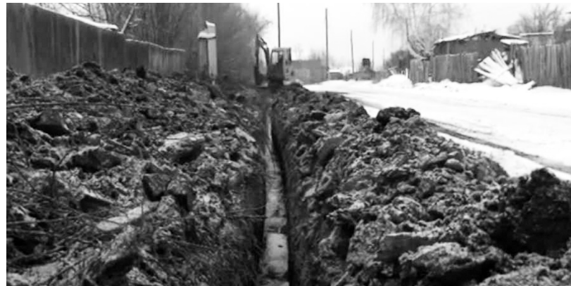
Дренажный канал спасает дорогу

В Майне, например, отдельные домовладельцы провели дорогостоящие мероприятия по гидроизоляции погребов. Они откачали из них воду, просушили помещения, забетонировали пол с последующим покрытием бетонного основания жидкой резиной, поверх которой сделали бетон-