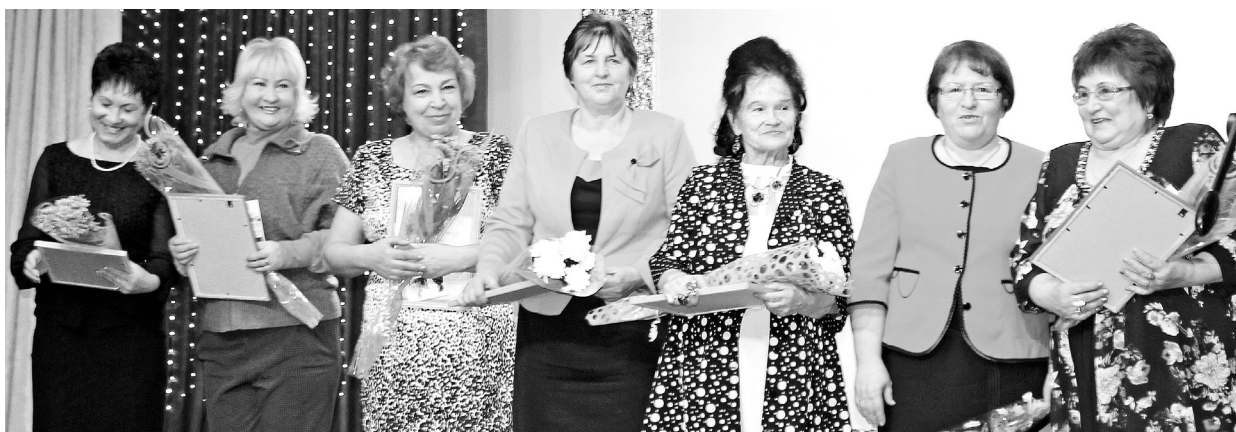
Ветераны гороо - на праздновании 40-летия отдела