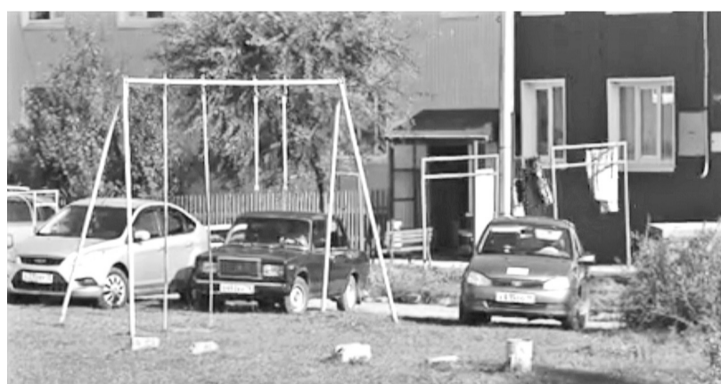
Заставленный машинами газон у дома № 2 по Дивногорской

- Некоторые автовладельцы, проживающие в нашем доме, имеют по две-три машины, одна из которых простаивает на газоне месяцами. Бывает, что хозяин авто, работающий вахтовым методом, оставляет машину у детской площадки или загоняет её под деревья, окаймляющие зелёную зону. Пример тому - вот та чёрная «шестёрка», на которую весь дом любителюется с незапамятных времён. Стоит под вязом