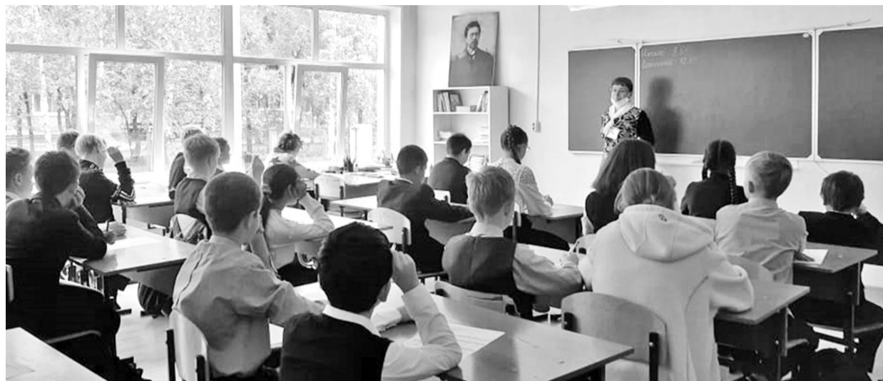
Над проверочными работами корпят шестиклассники школы № 2

Роспотребнадзора по профилактике ковида. ВПР проводятся на втором-третьем уроке. Где-то приходится освобождать учителей-предметников на время проведения проверочных работ, но все относится к этому как к объективной данности.