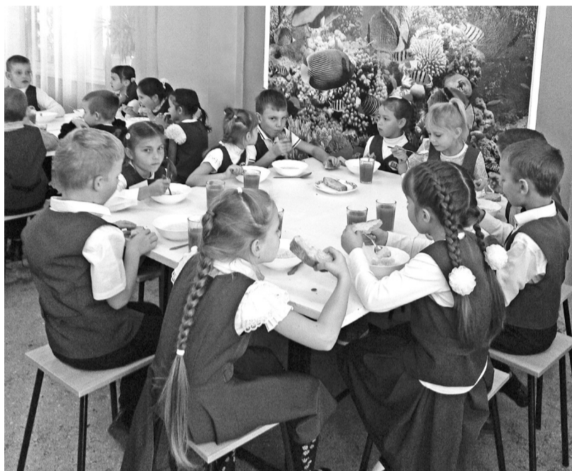
Аппетит приходит во время еды...