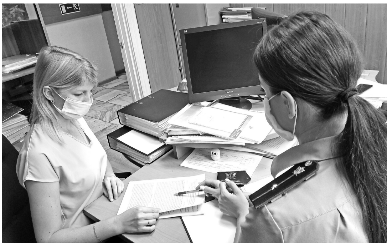
Личный приём пока с учётом ограничительных мер

Если гражданам привычнее портал госуслуг, то можно воспользоваться и им, что уже сделали более полтора тысячи жителей Хакасии. Но наиболее популярным является сервис «Личный кабинет стороны исполнительного производства». На сегодня им воспользовались свыше 16 тысяч человек. Личный кабинет стороны исполнительного производства в этом году для этого конкретного числа пользователей заменил не только очереди к судебным приставам, но и всю бумажную документацию. Взыскатели и должники: жители региона и юридические лица, пользуясь данным сервисом, оперативно получают полную информацию о ходе и всех стадиях исполнительного производства. Без лишнего посещения структурных отделов граждане и представители юридических лиц направляют в Службу судебных приставов обращения, заявления, ходатайство или жалобы