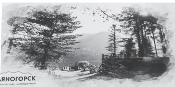
Макеты почтовых открыток с видами и логотипом Саяногорска

что приносят неоценимую пользу обществу. Юбилей города - самое время познакомиться с маленькими героями большой истории. Некоторые из них уже высветились на страницах газеты, кого-то предстоит узнать. В финале конкурса организуем встречу с этими людьми, наградим тех, кто выступил в роли литераторов.