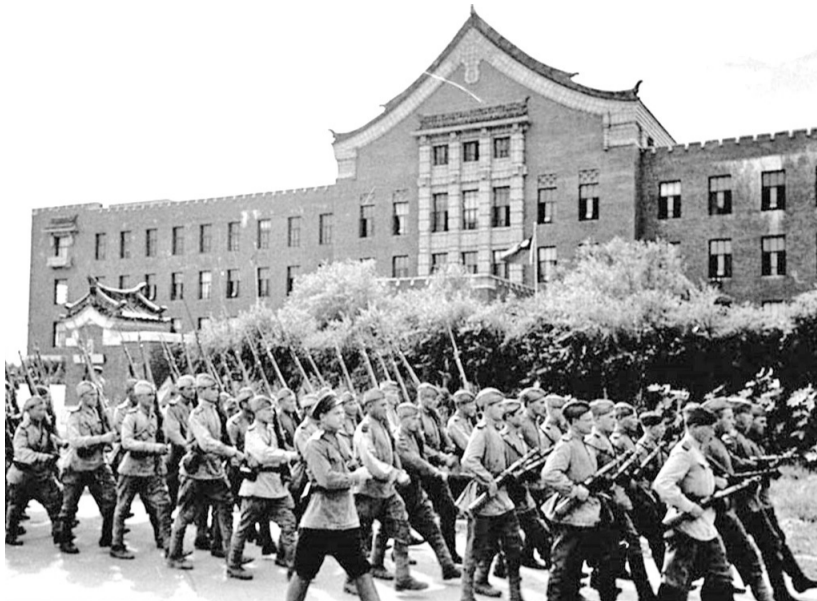
Август 1945 года. Марш советских войск в городе Ксинджин (ныне Чанчунь) в бывшей Маньчжурии

Дальневосточная победа... Начиная с этого года памятная для населения всей страны дата - День окончания Второй мировой войны - будет отмечаться не второго, а третьего сентября. Данное нововведение установлено поправками в закон «О днях воинской славы и памятных датах России». Ранее это изменение было принято Госдумой и одобрено Советом Федерации.