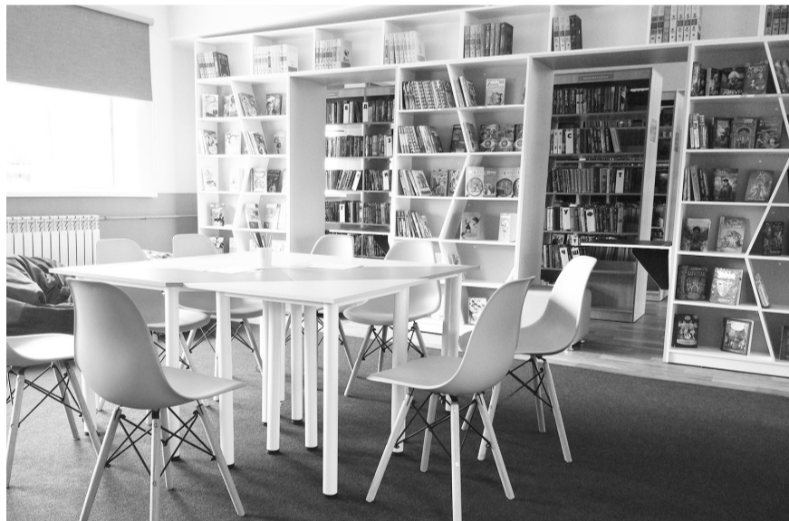
Детская зона для игр и чтения