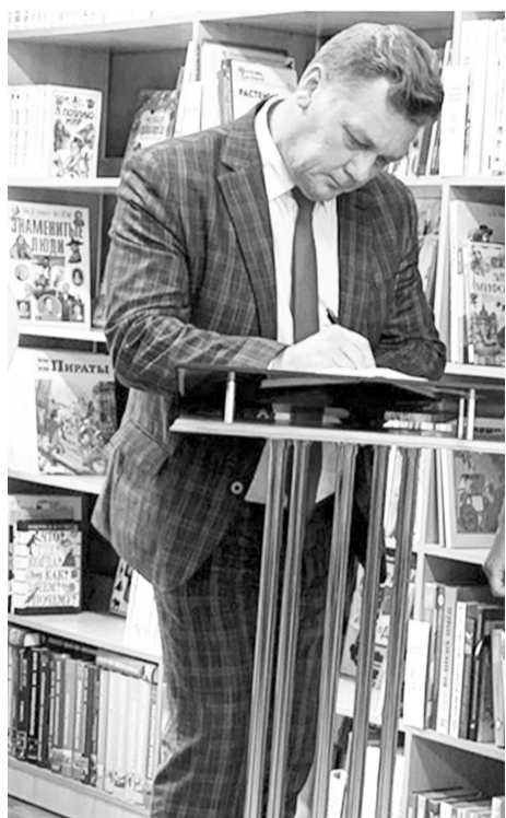
Запись в книге отзывов от Михаила Валова