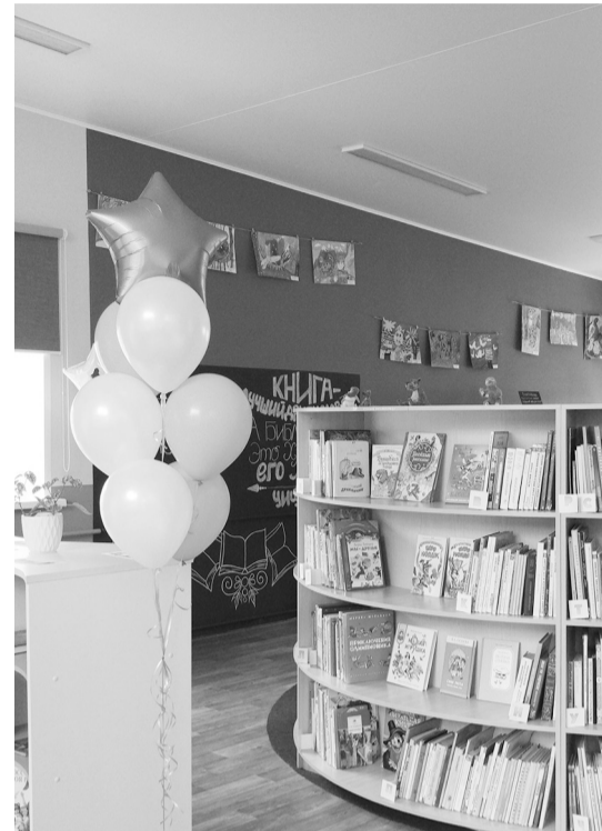
Новая библиотека - настоящий праздник для муниципалитета!