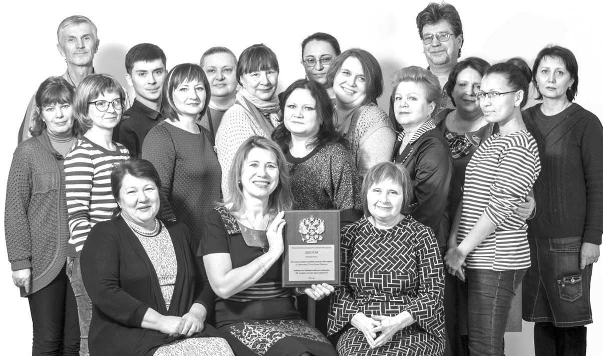
В 2017 году школа «Колорит» вошла в список 50-ти лучших детских школ искусства России