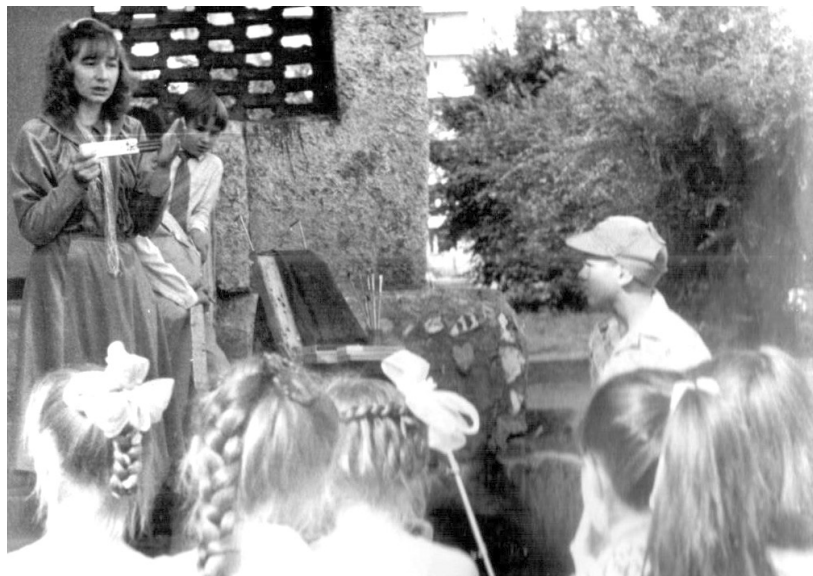
Памятный момент открытия (1990 год).