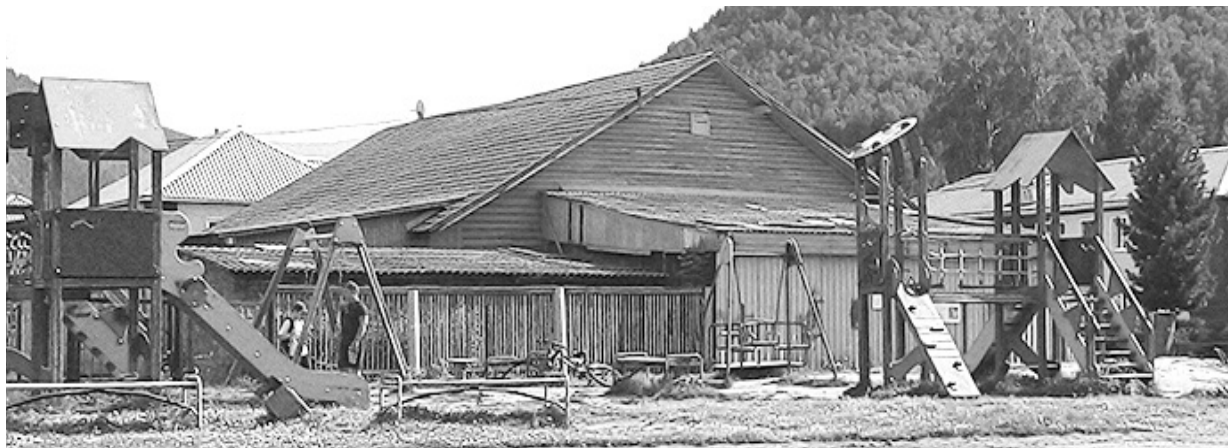
Малые формы на детской площадке ждут ремонта