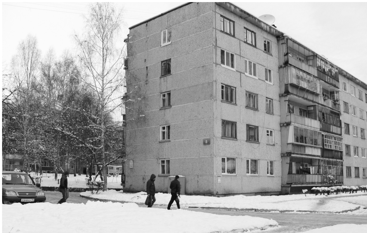
Дом № 8.