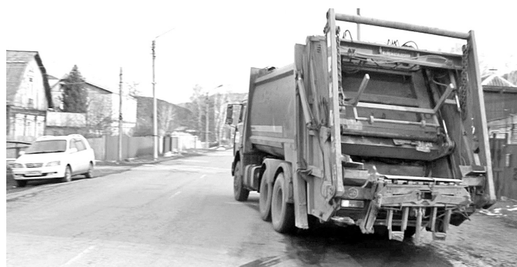
Крупногабаритный груз не загрузать!

С 1 января 2019 года в России, в том числе на территории муниципального образования город Саяногорск, стартовала «мусорная» реформа по обращению с твёрдыми коммунальными отходами (далее - ТКО). Услуга по обращению с ТКО является коммунальной.