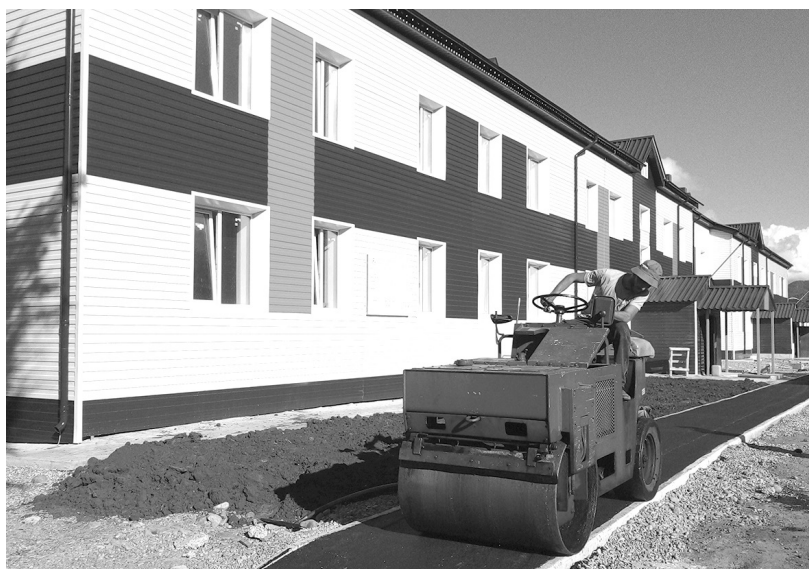
Последний штрих - бетонная дорожка