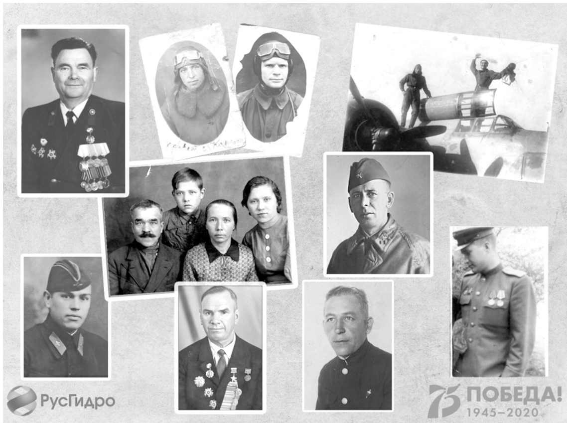
В памяти живёт героическое прошлое