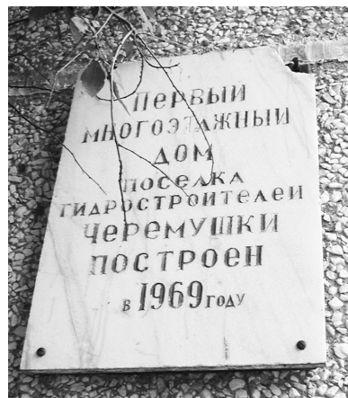
Мраморная доска на доме № 8