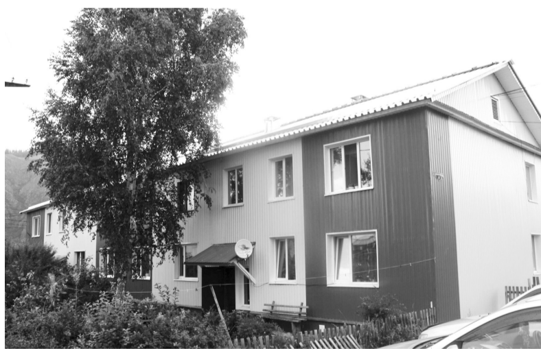
Дом в Майне после капремонта - как иерушка

Региональная программа капремонта - это поадресный перечень многоквартирных домов (далее - МКД), расположенных на территории Хакасии. В ней прописаны временные периоды, в которые регоператор планирует отремонтировать кровлю и фасад, заменить инженерные сети и лифтовое оборудование (при его наличии) в каждом конкретном доме. Составлялась программа в 2013 году. Данные об объектах (а их более 2,5 тысяч) в Минстрой Хакасии подавали муниципалитеты (а им, в свою очередь, управляющие компании), после чего информация заносилась в специальную компьютерную систему, которая и сформировала план