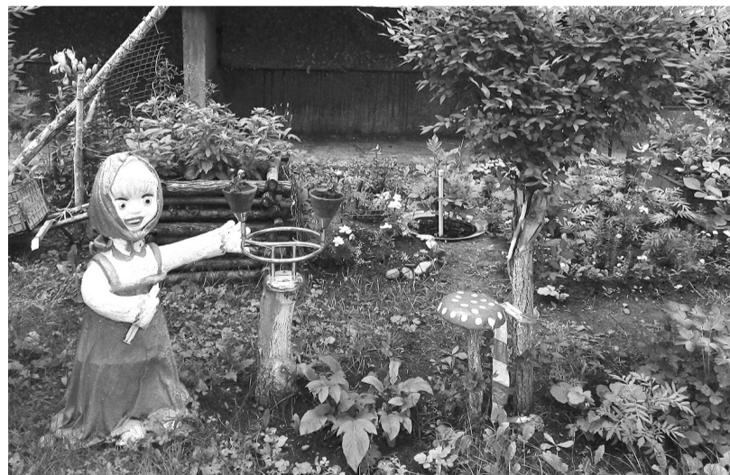
Фантазии активистов дома № 15 нет предела!

Но на такие муси-пуси никак не ведутся собственники жилья на первом этаже в одном из подъездов пятиэтажки, под балконом которых - трава по пояс. Ни одним цветочком здесь давно не пахнет, потому что кусок земли под балконом они приспособили под перевалочную базу. Собираясь на отдых, можно не делать лишних телодвижений при доставке вещей, рюкзаков,