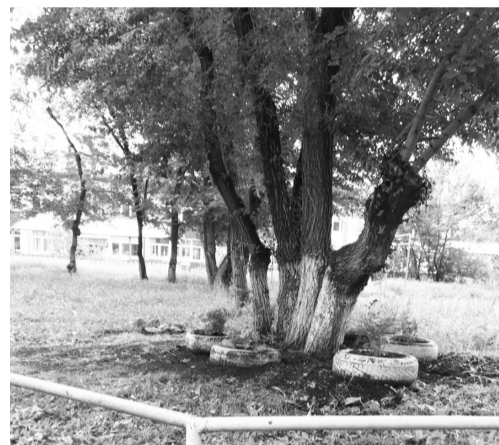
А вот так стало!