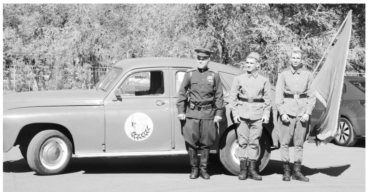
Легендарная «Победа» вновь на улицах города

А сумели сделать всё, что в нынешних условиях самоизоляции могли себе позволить. Наверное, получилось, потому что преданность и гордость за наших отважных предков ощу-