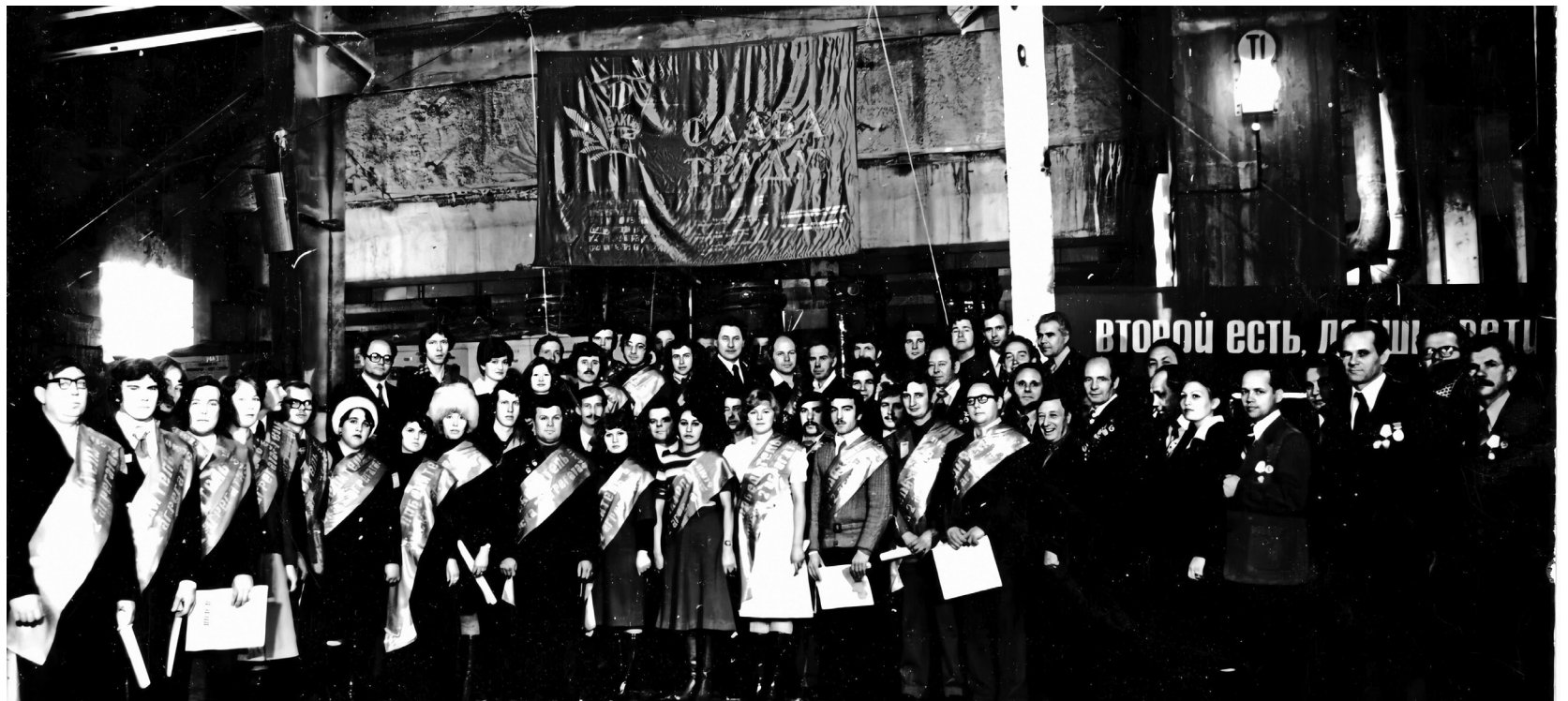
Победители соцсоревнования в честь пуска второго гидроагрегата, поднявшие вымпел «Слава Труд!»