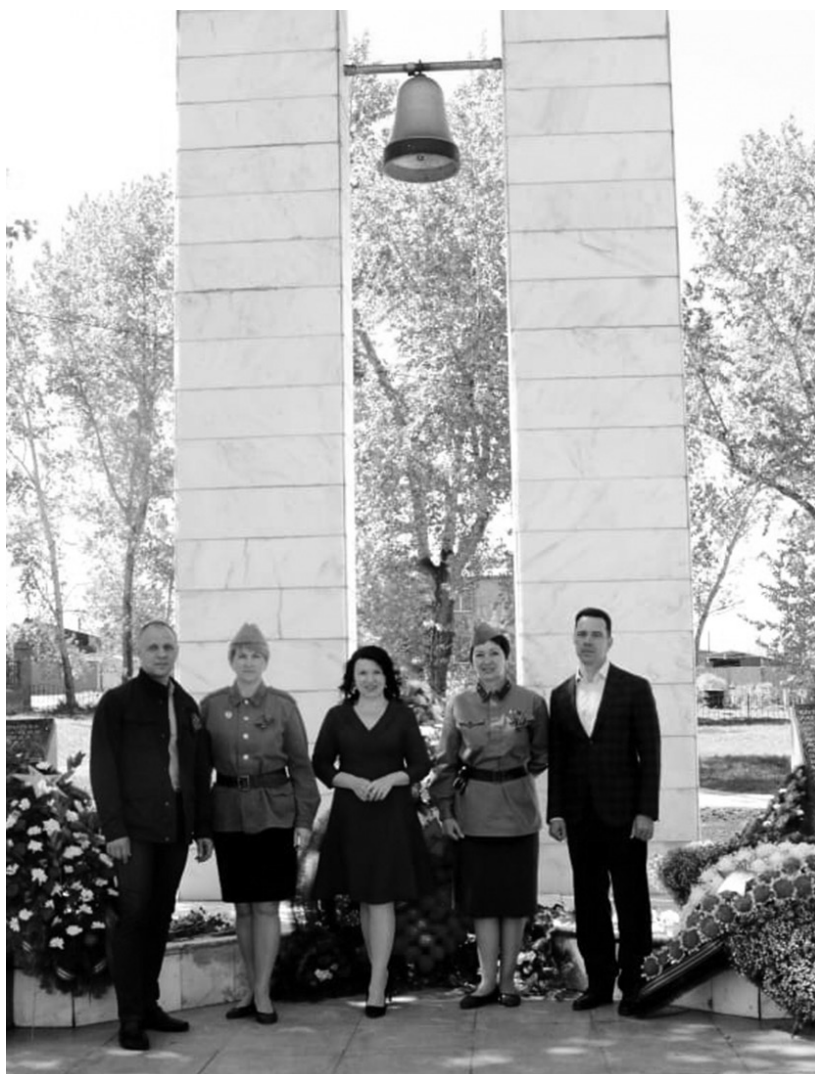
Звучи в сердцах, Колокол памяти!