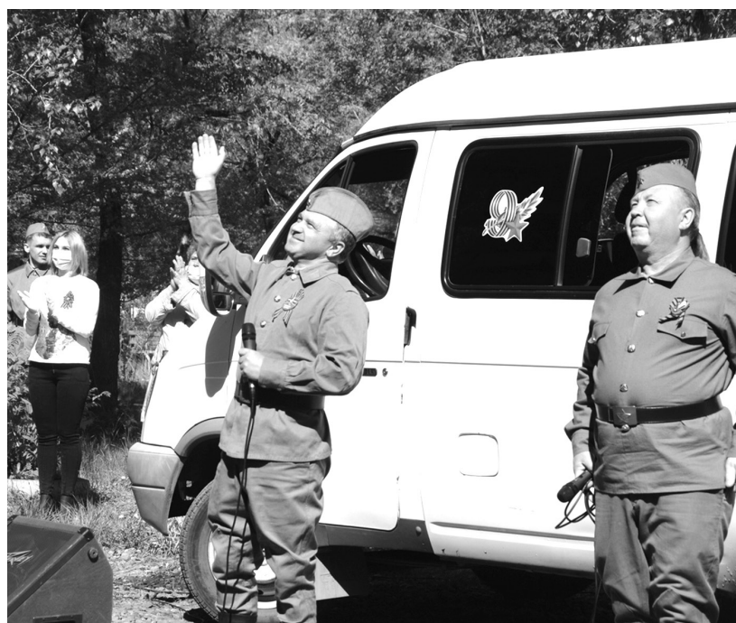
«Визитовцы» поздравляют ветеранов