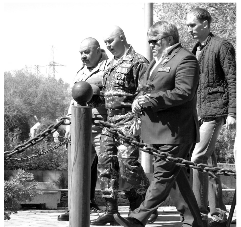
День памяти погибшим воинам-землякам от благодарных потомков