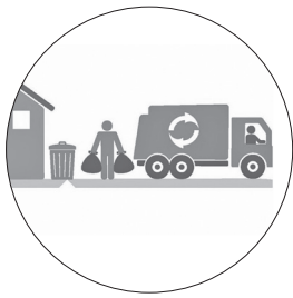
График вывоза мусора в Майне изменился