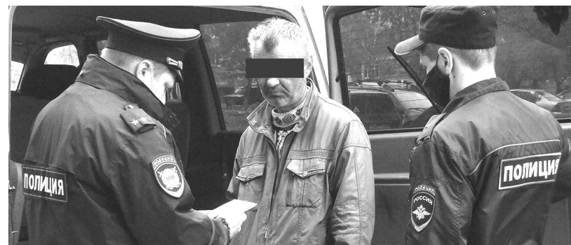
При выходе из дома не забудьте взять документы

Оказавшись по другую сторону патруля, было любопытно увидеть себя и своих знакомых глазами стражей правопорядка. Согласно установленным ограничениям, гражданин должен иметь веские причины для выхода из дома. Но с первых же метров маршрута стало очевид-