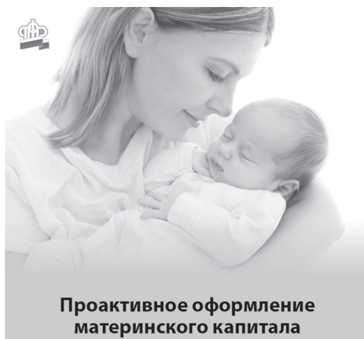
Проактивное оформление материнского капитала

Единственное, что нужно иметь потенциальному владельцу сертификата - доступ к электронным сервисам, то есть возможность войти в свой личный кабинет. Тем, кто ещё этого не сделал, нужно зарегистри-