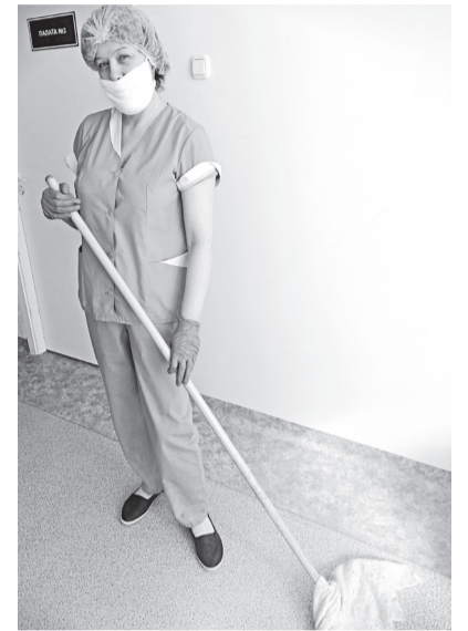
Берегись инфекции - делай дезинфекцию

Самое время заглянуть в стационар. Но зачем высоко подниматься? Можно из кабинета главного врача пройти до