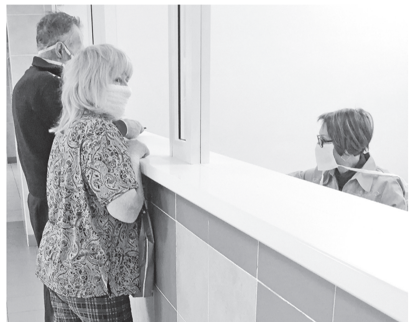
У регистратуры: Ох, не надо нам контактов

конца коридора, открыть заветную дверь, миновать лестничный марш, и вот оно, пульмонологическое отделение.