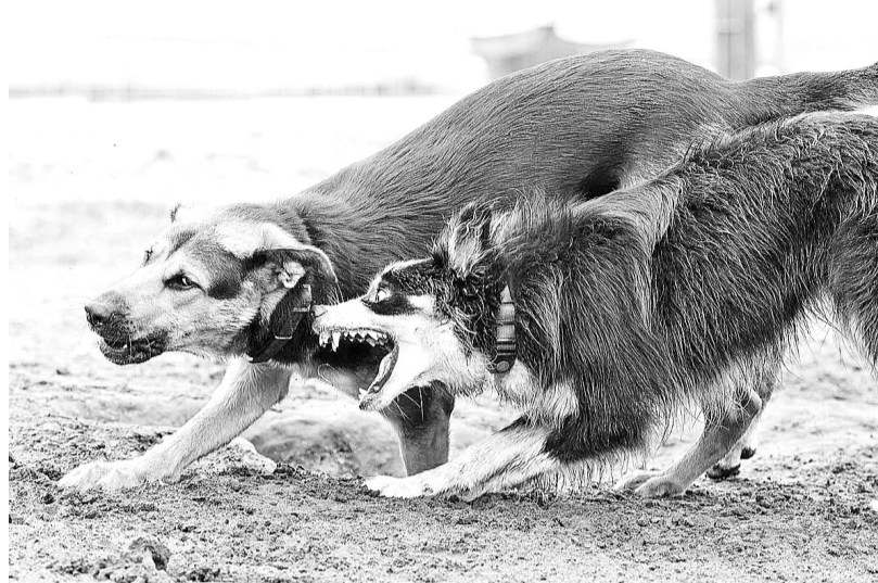
Нам навстречу - собачка, чья кличка Дружок...

- Мы хотим обратить внимание депутатов Госдумы на необходимость федерального