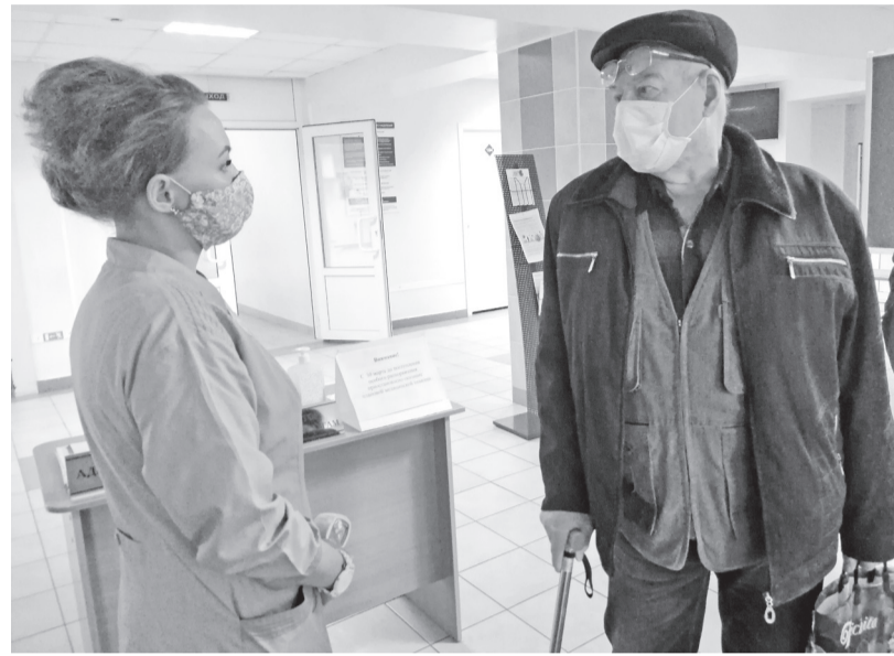
На входе в поликлинику: Соблюдайте меры профилактики

Из других больниц республики нам перераспределили аппараты искусственной вентиляции лёгких. (Свои аппараты есть, но они нужны в реанимационном отделении). Есть шприцевые насосы для введения медикаментов, а также отсосы. Единственное - нет мониторов, но Минздрав республики и этот вопрос обязался решить на период карантина - перераспределить в нашу пользу из других медицинских учреждений Хакасии. Если потребуется, обеспечит бригаду реаниматологов для работы в палатах интенсивной терапии инфекционного отделения. В настоящее время там организованы бригады из врачей, медсестёр и санитарок. Для них выделена чистая зона, где можно помыться, пройти санобработку после смены. В их распоряжении все необходимые средства индивидуальной защиты в условиях работы с особо опасной инфекцией - многоразовые и одноразовые костю-