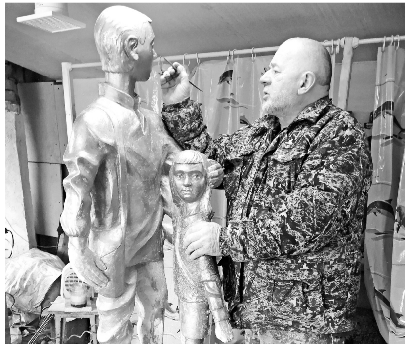
В мастерской скульптора