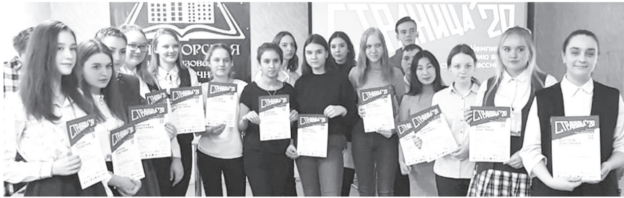
Юные участники битвы за интонацию и ударение