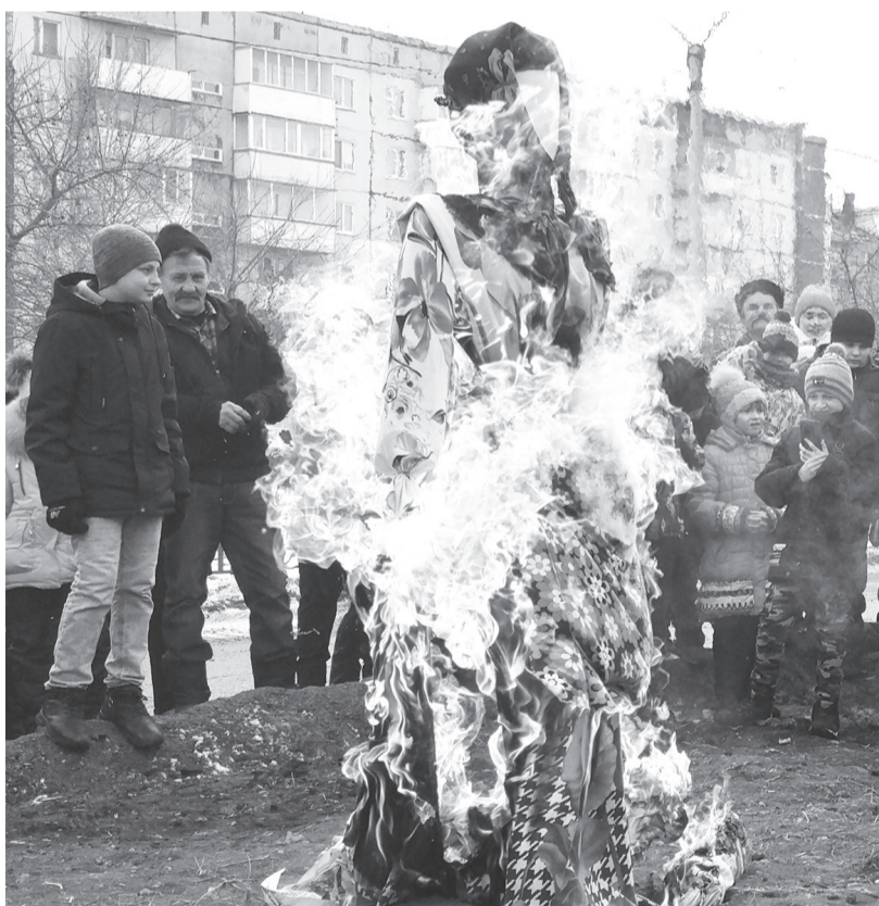
Гори, Масленица, жарко - будет солнце ярко!

ми яствами, рядом присаживаются люди, а там уже и очередь образовалась... Потому что вкусно, не то слово!