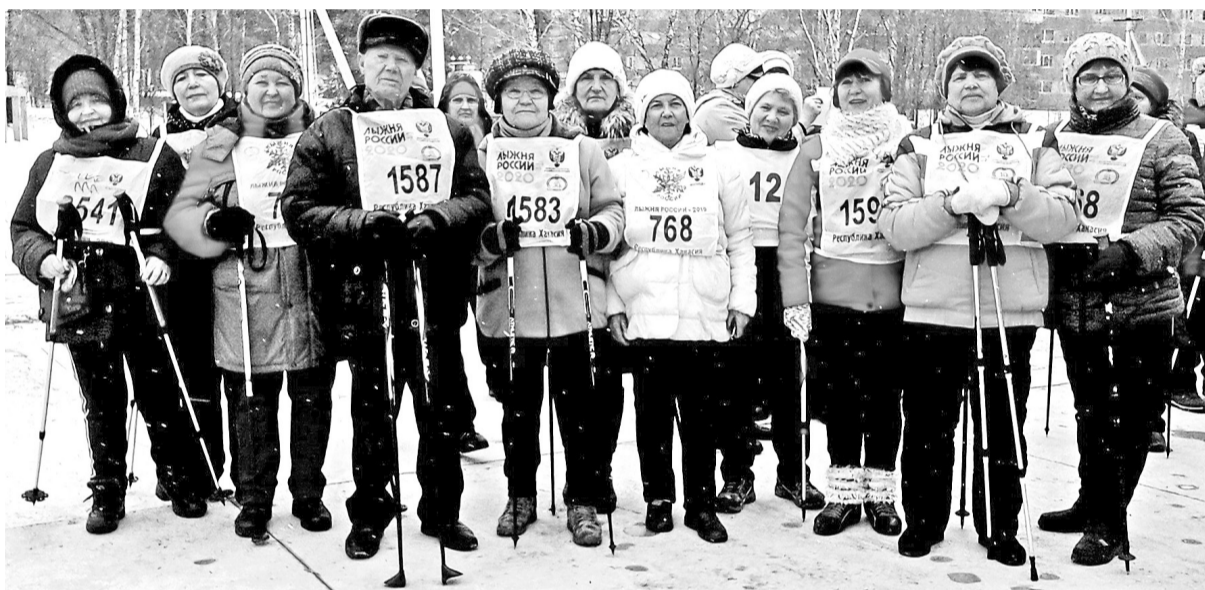
Прошагали дружно в последний зимний день

В последний день зимы в Черёмушках прошло спортивно-массовое мероприятие по скандинавской ходьбе «Шаг за шагом», организованное филиалом ПАО «Рус-Гидро» - «Саяно-Шушенская ГЭС им. П.С. Непорожного».