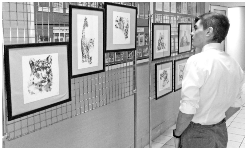
Прекрасное нам не чуждо

- Данный проект реализован совместно заповедниками «Саяно-Шушенский» и «Хакасский» при активной поддержке республиканского отделения Русского географического общества и компании РУСАЛ. Все посетители увидят, насколько