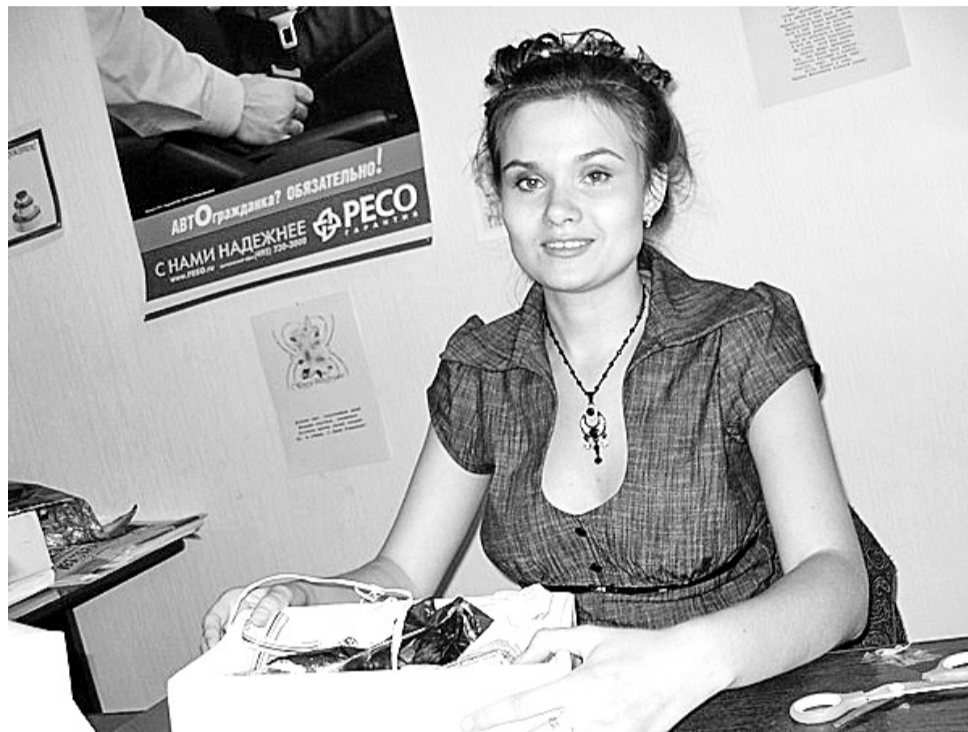
Войти в положение клиента? Пожалуйста!