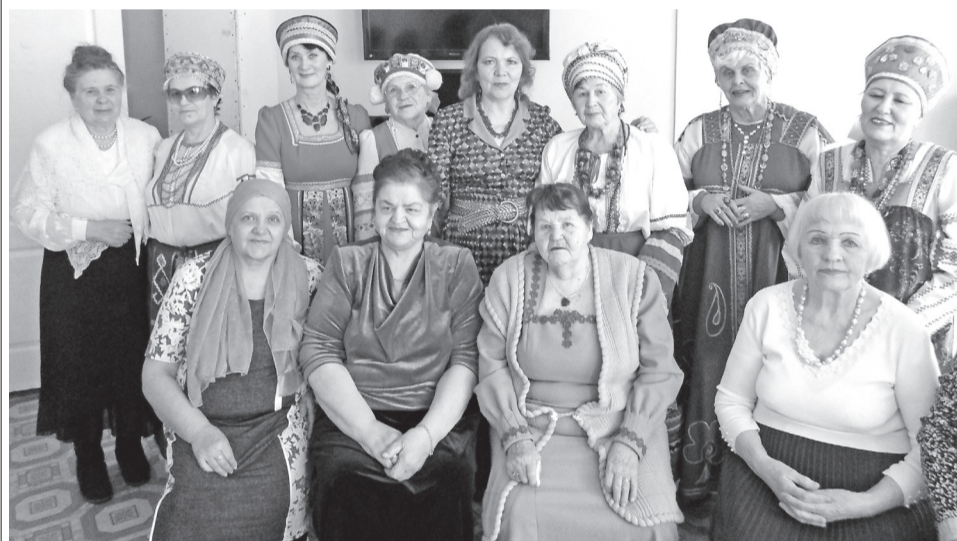
Хорошее настроение на фольклорном празднике «Для милых дам»