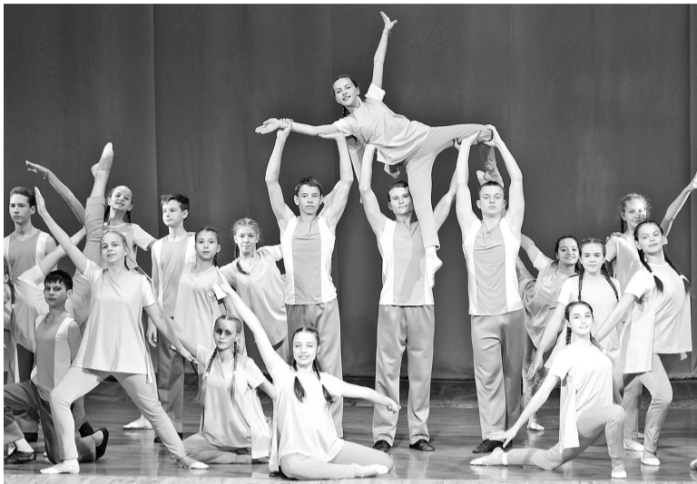
Танец - это маленькая жизнь

Образцовый ансамбль эстрадного танца «Ритм» Дворца культуры «Энергетик» принял участие в VI Международном конкурсе-фестивале «Семь ступеней».