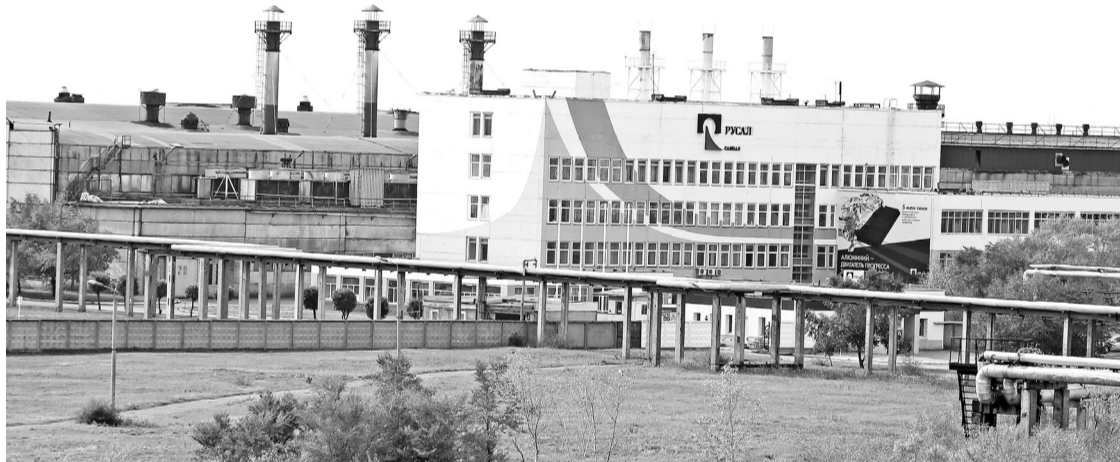
САЯНАЛа как белый лайнер

- Фольгопрокатный завод САЯНАЛа 25 лет назад выдал первую продукцию - алюминиевую заготовку шириной 1350 мм и толщиной 10 мм.