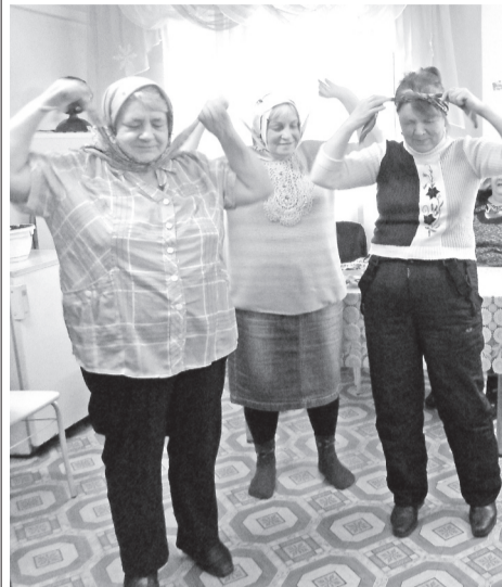
«Гуляй, народ, - Масленица у ворот!»

Саяногорское общество инвалидов представило на суд читателей фотографии от Валентины Шабановой. Как мы видим, люди «серебряного» возраста любят петь и веселиться.