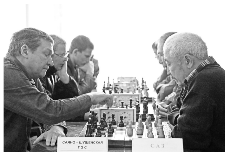
Шахматы - игра для интеллектуалов

Турнир проходил по круговой системе: команды сыграли между собой по одному разу. В результате напряжённой борьбы призовые места распределились следующим образом: третье место у команды ПАО «Иркутскэнерго», на втором - сборная Саяногорска, на первом - команда Саяно-Шушенской ГЭС.