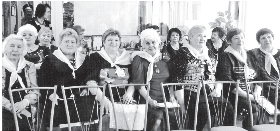
В гостях у клуба «Мудрость»