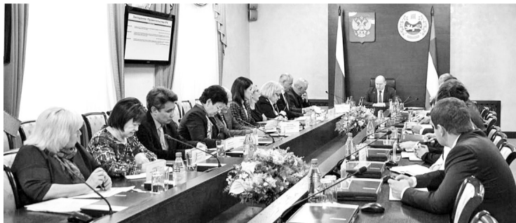
Бюджет - забота общая

Основные параметры документа представила министр финансов Хакасии Ирина Войнова. Планируется, что доходы республики в 2019 году составят более 24 млрд рублей, расходы - 26,5 млрд рублей. Дефицитность бюджета определена на уровне 10%. Что касается распределения, то бюджет республики сохраняет социальную направленность. Выплата заработной платы бюджетникам, предоставление различных мер социальной поддержки предусмотрены в полном объёме. Так, на 2019 год с учётом субвенций муниципальным