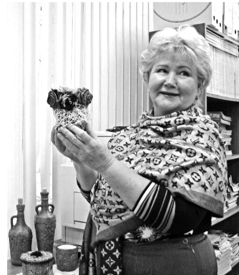
Выставка по проекту «Творчество без границ»