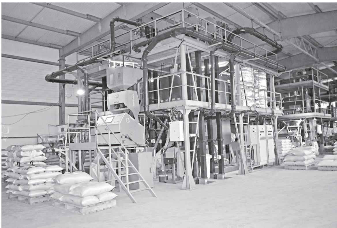
Новейшее оборудование, на котором в этом году начато производство гречневой крупы

А в перспективе - не просто увеличение объёмов производства, но и более широкий выход на розничный рынок. Сегодня доля розничных продаж у предприятия не превышает 20% от общей реализации. Для рядового покупателя самая удобная форма фасовки - в упаковках по 1-2 кг, а такого производства тесинцы пока не освоили.