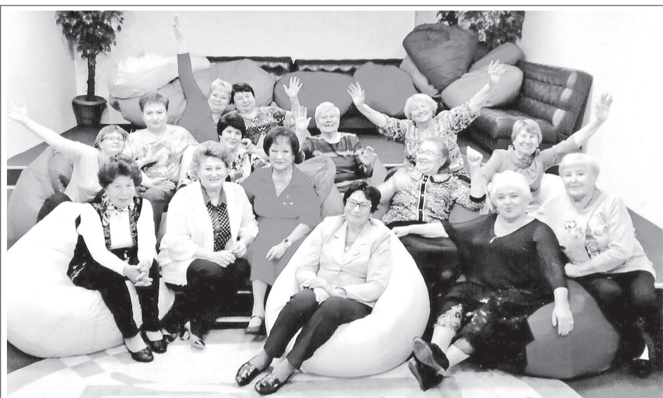
Встреча друзей совета ветеранов здравоохранения и пенсионеров г. Саяногорска на празднике к Дню пожилого человека