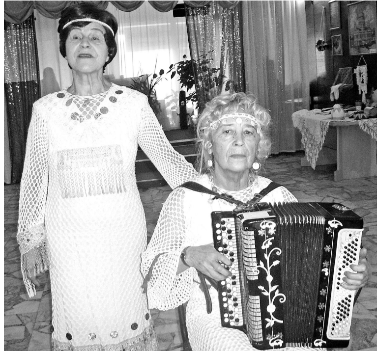
Их связала творческая дружба