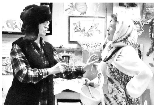
Таково житьё деда и бабки...

А в валенках - сюрпризы-подарки. Работники библиотеки подготовили выставку-подборку о том, как валять валенки, как их украшать.