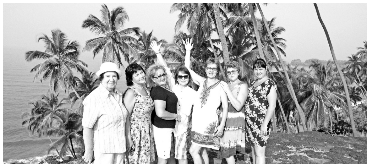
Неутомлённые солнцем сибирячки по дороге в португальский форт Кабо де Рама

Разве могла я, будучи девчонкой, читающей на советских афишах «Индийский фильм до 16-ти лет», мечтать о том, что спустя годы грёзы о далёкой и загадочной стране воплотятся в незабываемое путешествие?!