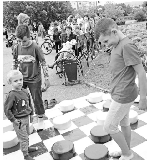
Шашки - игра серьёзная

Меж тем на импровизированной сцене - ступеньках администрации - разыгрывается очередной конкурс (а их было немало: начиная от сочинения эссе о лете, заканчивая конкурсом на самые длинные волосы). Ребятам предлагают по-своему расшифровать известные аббревиатуры. И, надо сказать, варианты подбираются самые фантастические! И очень смешные. А вы сами попробуйте превратить «ВДВ»,