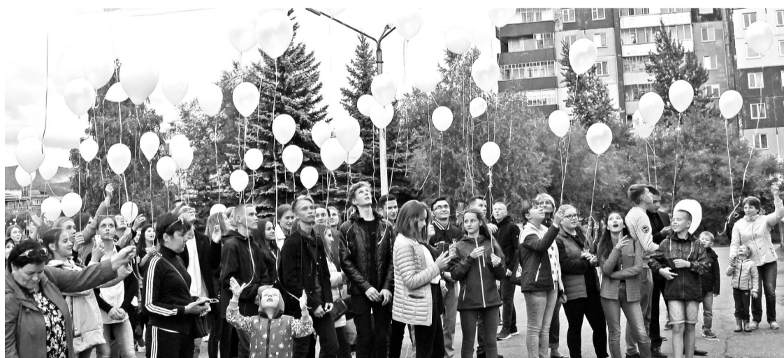
Белые шарики - светлые души летят к облакам

«Беслан в нашей памяти навечно. Мы должны быть вместе», - эти слова, предваряющие встречу на площади, ещё долго на разные лады