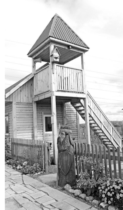
Этнокультурный комплекс растёт и хорошеет

Впрочем, проект реконструкции школы № 6 предполагает и обновление школьного оборудования, а также замену освещения, сантехники, вентиляции... Всего на два корпуса школы планируется потратить 275,8 миллиона рублей; в этом году выделено 66,4 миллиона, в том числе - 55,3 миллиона рублей из средств компании. На сегодня в учебном учреждении, отремонтированы кровля, несколько классов, вовсю ведётся ремонт спортзала, который после обновления обещает отвечать самым современным требованиям.