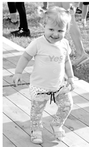
Маленькая незнакомка пляшет зумбу на форуме молодёжи