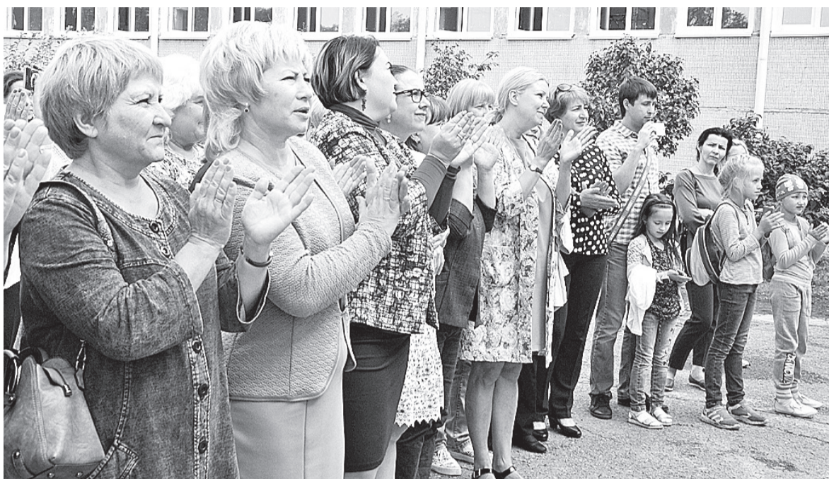
Счастьем лучатся глаза педагогов

На протяжении всех дней представители алюминиевого завода вместе со специалистами администрации города вели постоянный контроль качества ремонтных работ. Последние недели строители трудились с утра и до позднего вечера, чтобы успеть выполнить запланированные объёмы до начала нового учебного года. Каждый день в школе начинался с мини- совеща-