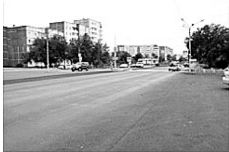
Улица Ленина - центральная и важная

Глава республики сердечно поблагодарил руководство компании РУСАЛ, «нашего стратегического партнёра», за сотрудничество и поддержку.