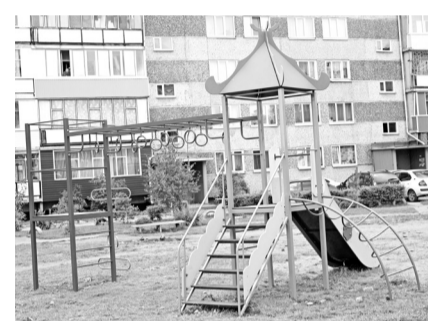
Вот и Ленинградский микрорайон обзавёлся новой детской площадкой

- Мы выиграли грант РУСАЛа, благодаря чему на оснащение реабилитационного отделения освоили более 6 миллионов: 3,5 миллиона - собственных средств и 3 - средств компании. Благодаря сложившимся партнёрским отношениям и поддержке наших градообразующих предприятий больные теперь могут получать своевременную и полноценную реабилитацию как после амбулаторного, так и после стационарного лечения, - рассказывает Людмила Валерьевна.