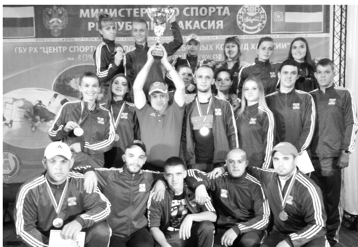
Дружная сборная команда Саяногорска