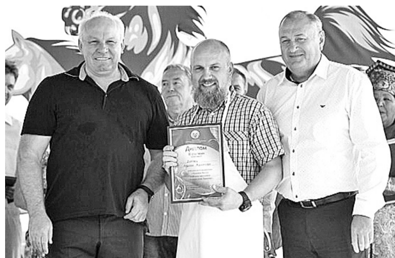
Сыр из хозяйства «Поместье Предгорное» стал победителем в конкурсе сельхозпродукции «Золотое руно Хакасии» в номинации «Чемпион вкуса»!