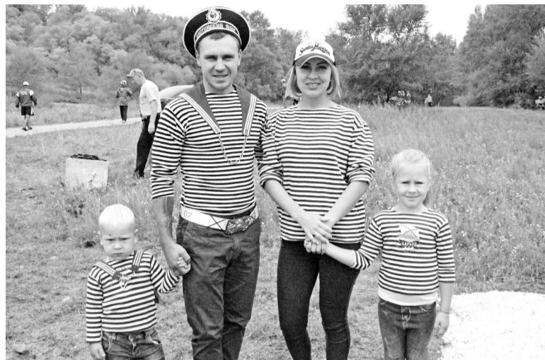
День Военно-морского флота - любимый праздник саяногорцев