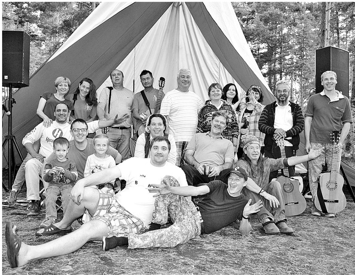
Городскому фестивалю авторской песни «Полянка» - 20 лет!