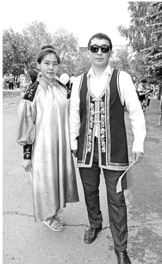
День России: многонациональная и многоконфессиональная колонна Дружбы