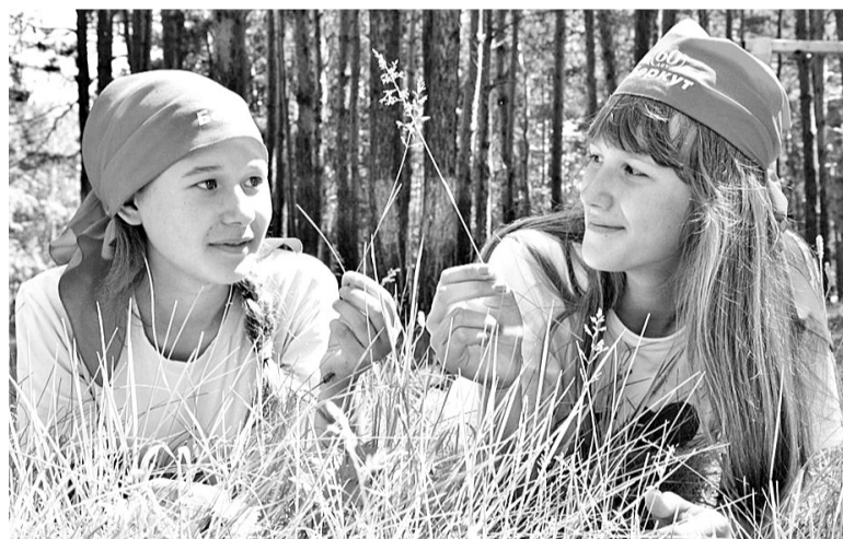
Отдых в лагере «Беркут» - это здорово!