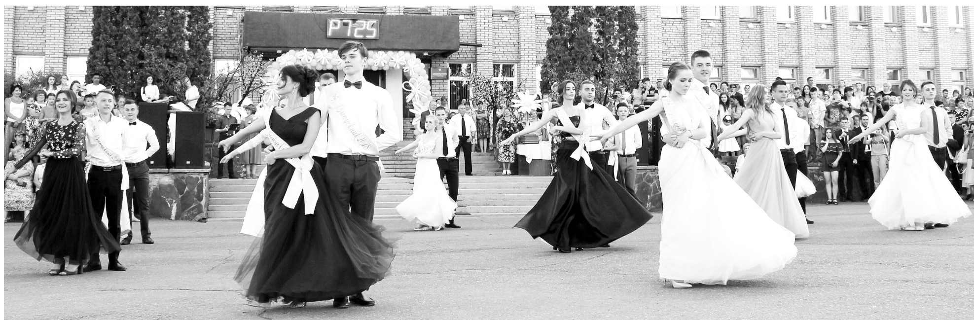
Счастье в ритме вальса. Выпускной-2018