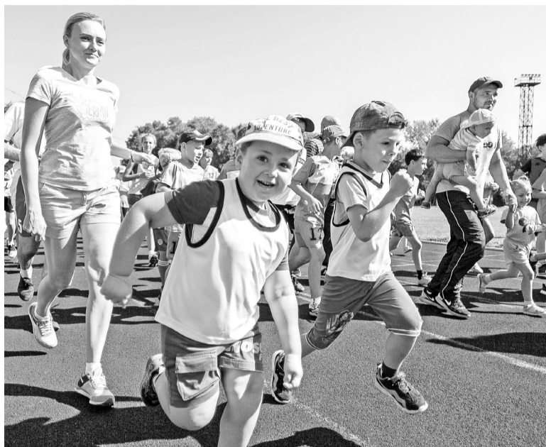
В День физкультурника бегут все!