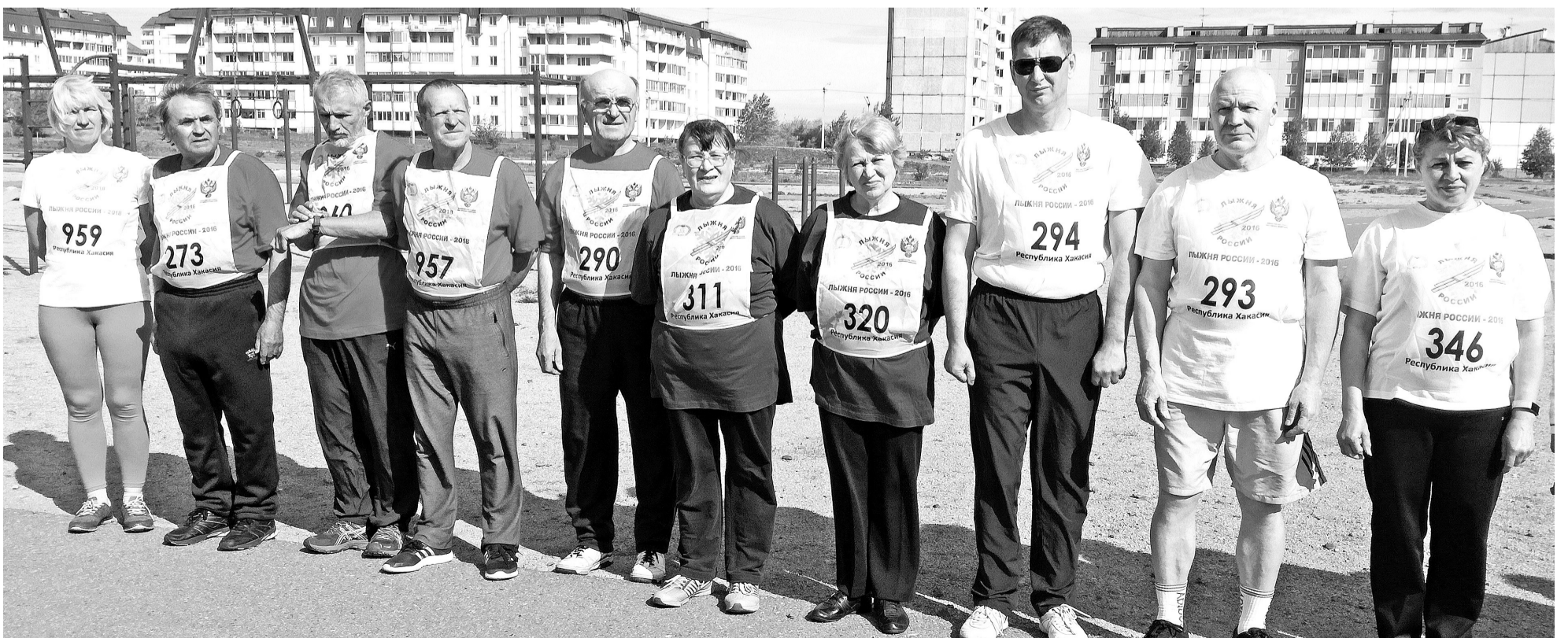
Участники спартакиады пенсионеров