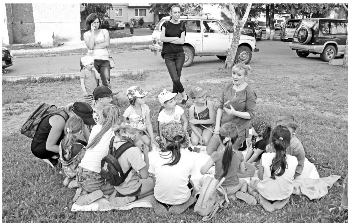
«Команда нашего двора» учит детей играть