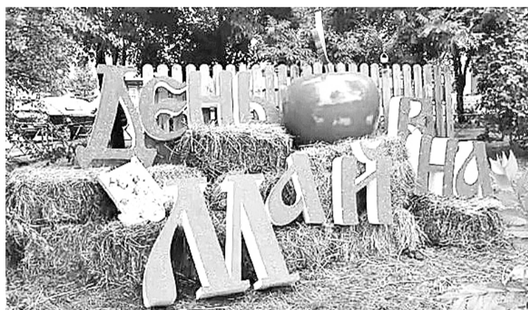
«Яблочный» посёлок Майна