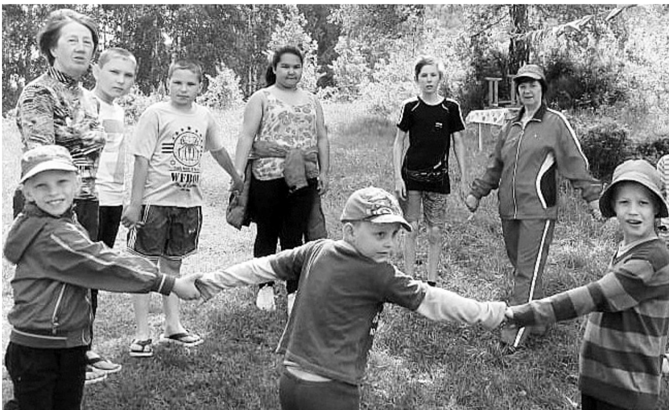
ТОС «Зона отдыха» - большая, дружная семья