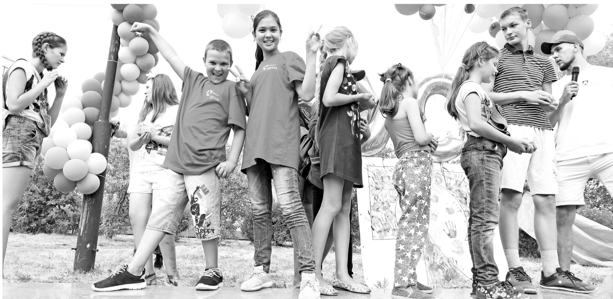
День металлурга празднует весь город