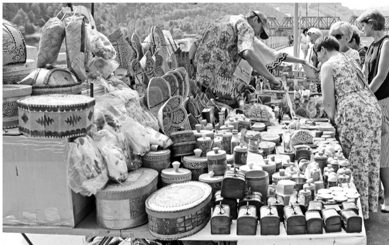
Изделия из бересты привлекали гостей

На конкурсе «Удивительный корнеплод» оценивались размер и необычные формы корнеплодов. Первое место заняла Татьяна Пахно. В этом