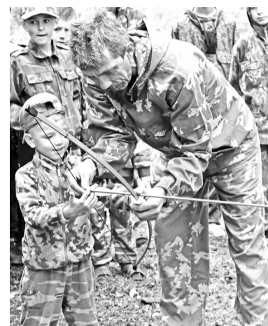
Стрельба из лука - это точность и дальность

- На мой взгляд, в глазах ребят повысился авторитет