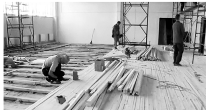
Ремонт спортзала школы № 6

Сразу пять социальных городских объектов находятся на особом контроле компании РУСАЛ. Градообразующее предприятие принимает непосредственное участие в их ремонте и благоустройстве.