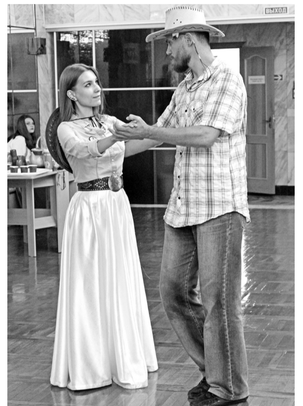
Бал на «Диком Западе»