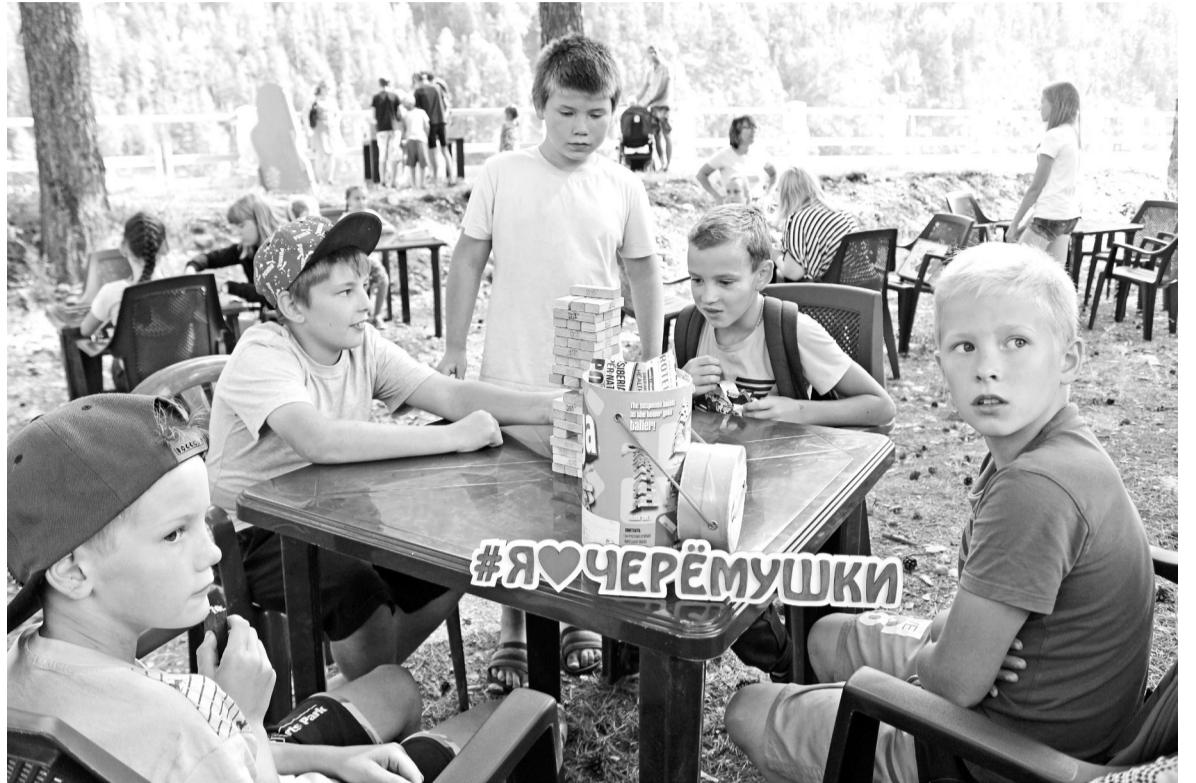
Юная поросль Черёмушек