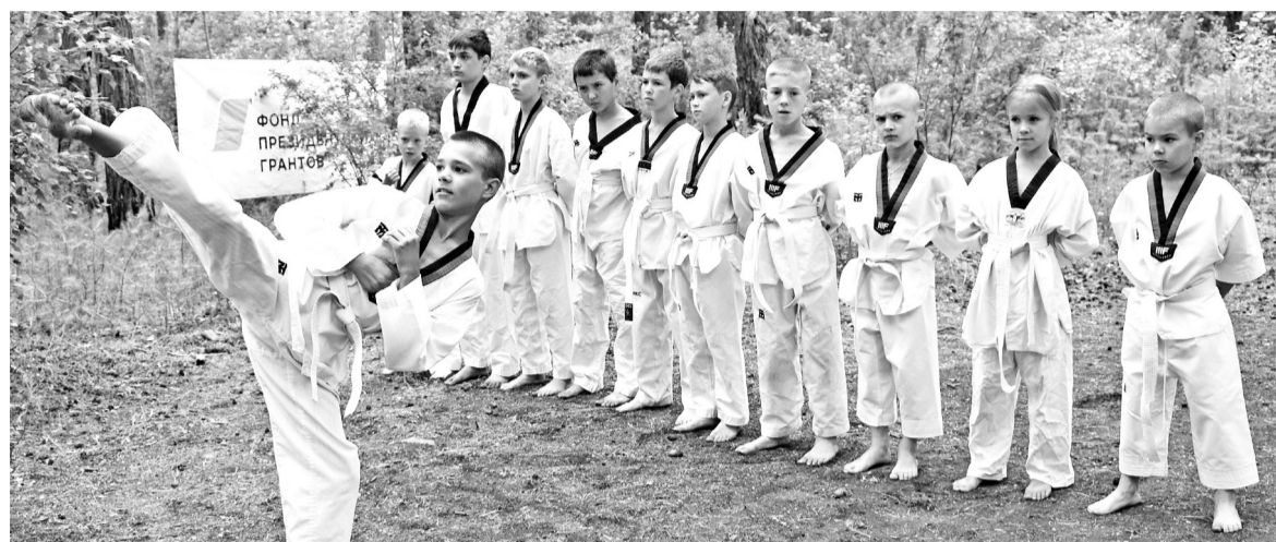
Тхэквондо - спорт настоящих мужчин

- В ходе учений инструкторы клуба «Десантник» (наши выпускники, они же волонтеры)