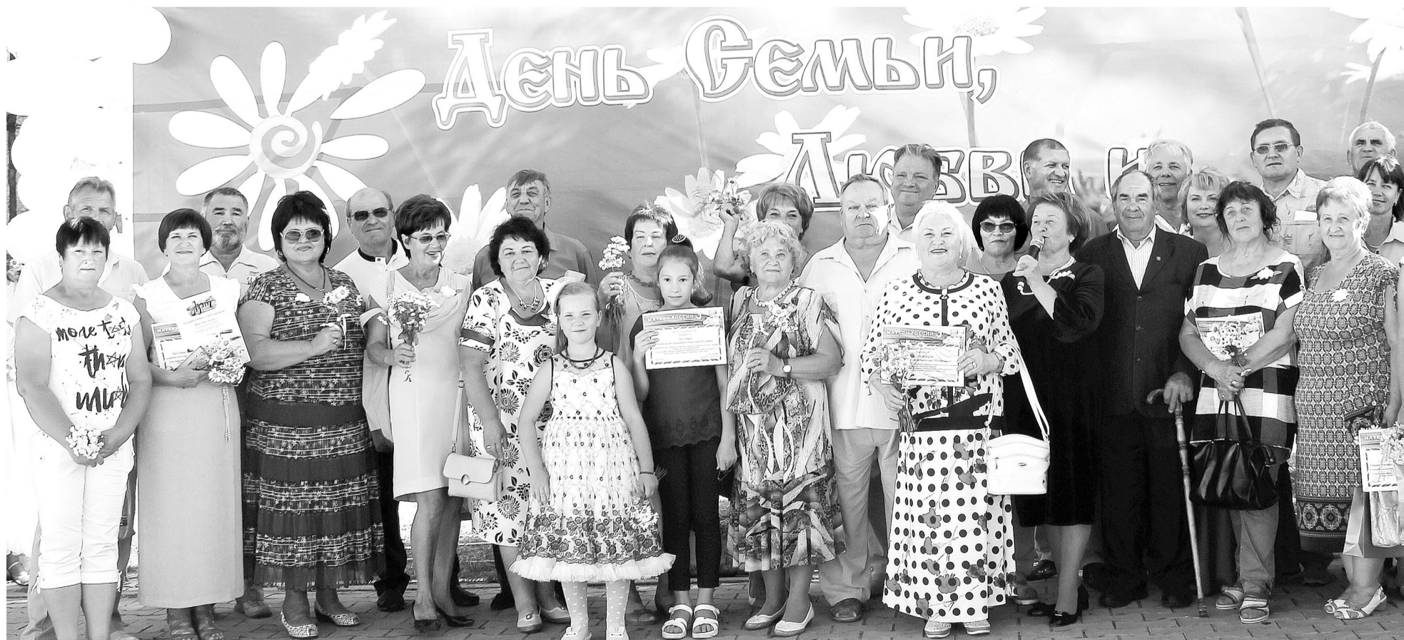
День семьи, любви и верности. В Саяногорске очень много счастливых семей!