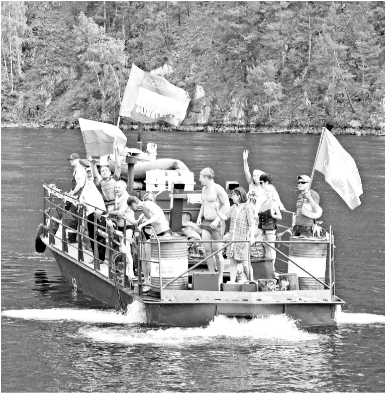
День посёлка Черёмушки - моржи готовятся к заплыву