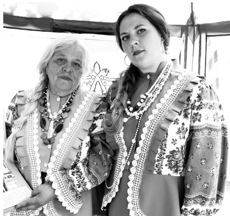
Первый открытый городской фестиваль «Развернись, душа казачья!»