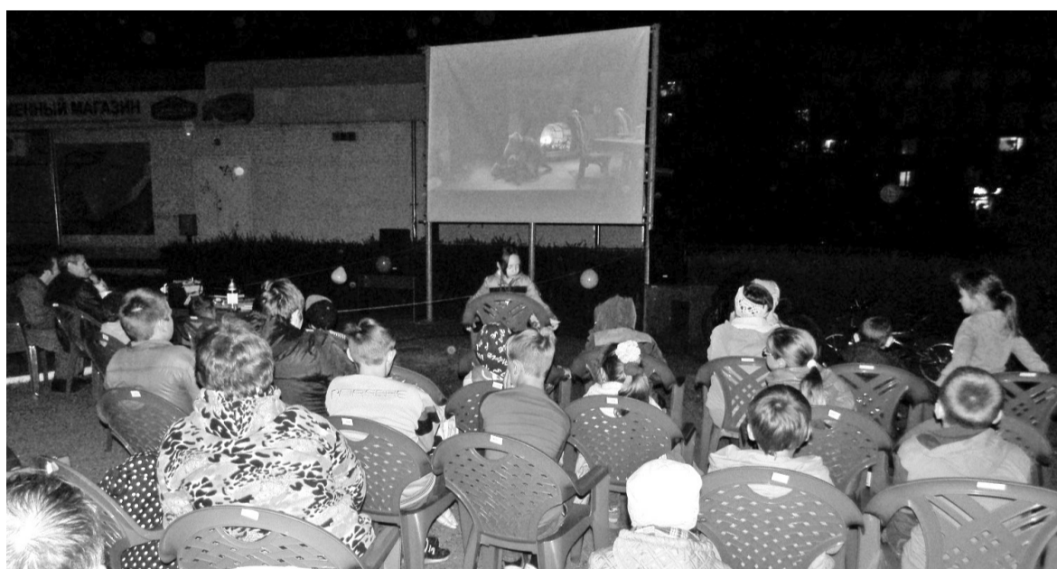
Саяногорцам очень понравился проект «Кинолето под звёздами»