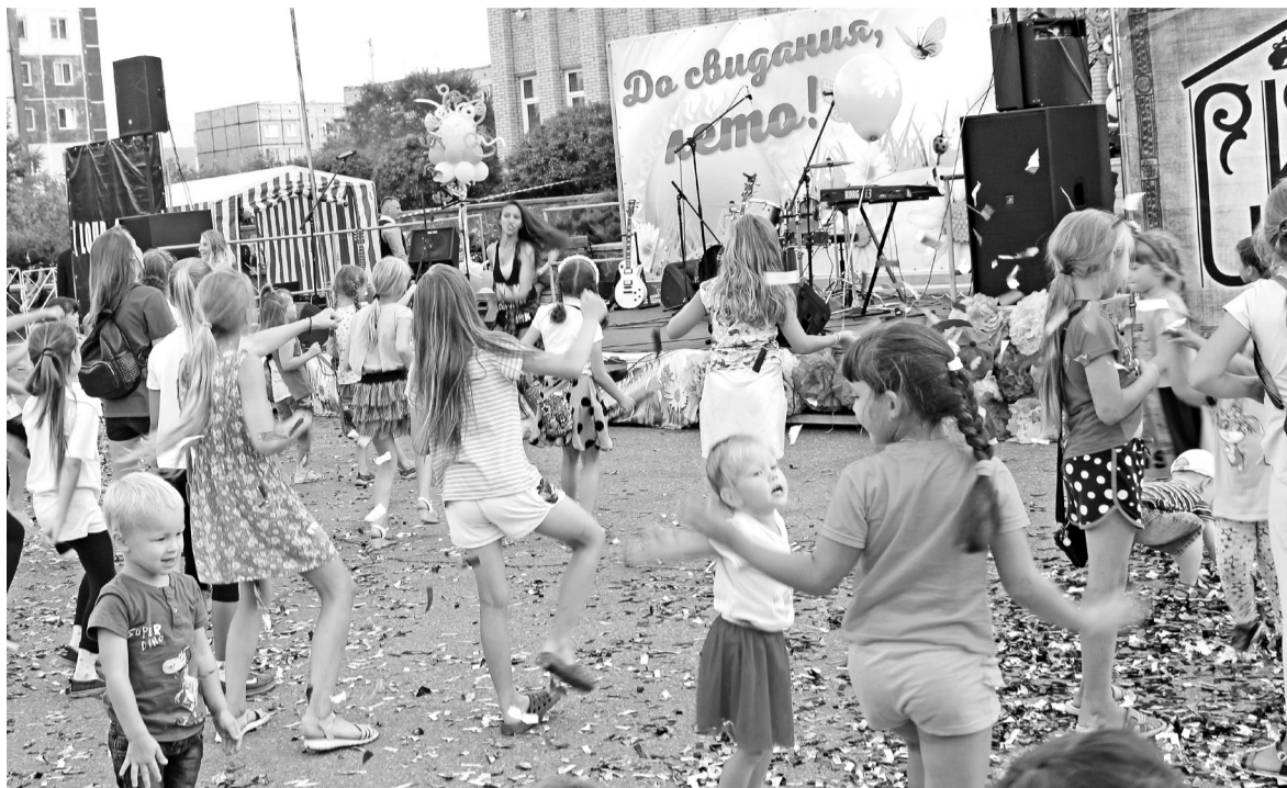
Саяногорская детвора дружно и весело провожает лето