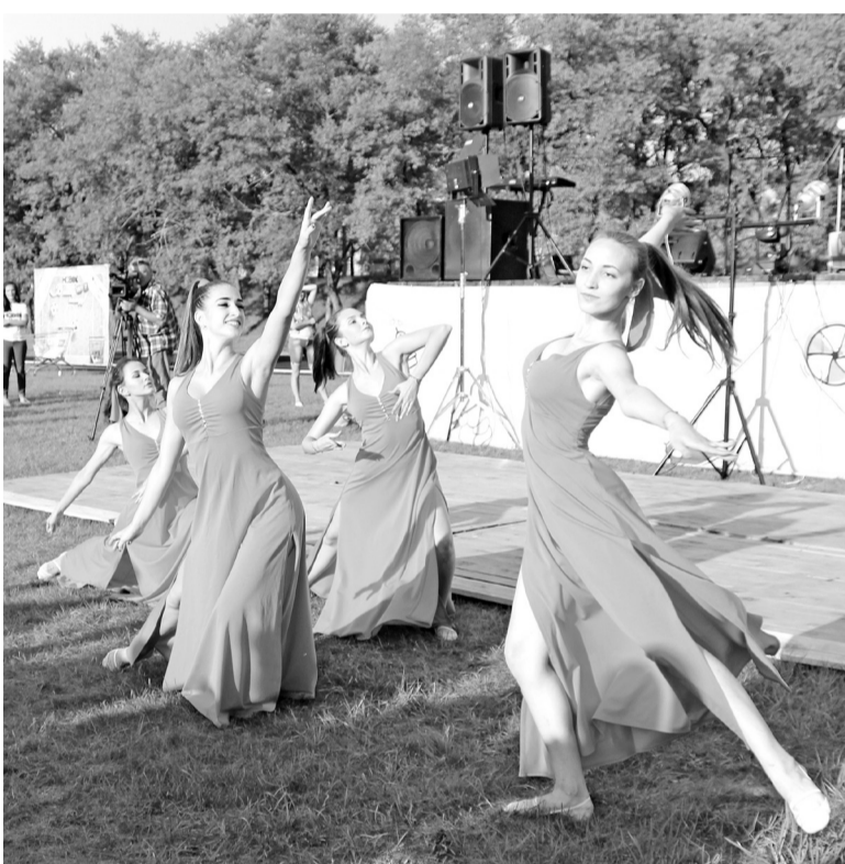
Образцовый ансамбль эстрадного танца «Экспромт» открывает дискотеку на Молодёжном форуме