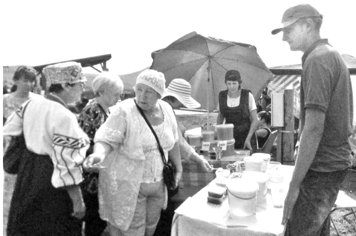
Мёд пахнет летом знойным...

Организаторы наметили открытие праздника на полдень, но народ спозаранку спешил отведать вкус лета знойного. Люди «перетекали» от одного пасечника к другому, поддевали ложечками аромат цветущих трав, и над площадками стоял густой медовый дух. По обычаю, пчеловоды в Медовый Спас угощали всех желающих свежим мёдом, чтобы получить богатый урожай в следующем году. И покупатели не упускали возможности полакомиться,