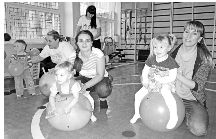
Физкультурные занятия в группе «Топотушки»

В результате работы групп кратковременного пребыва-