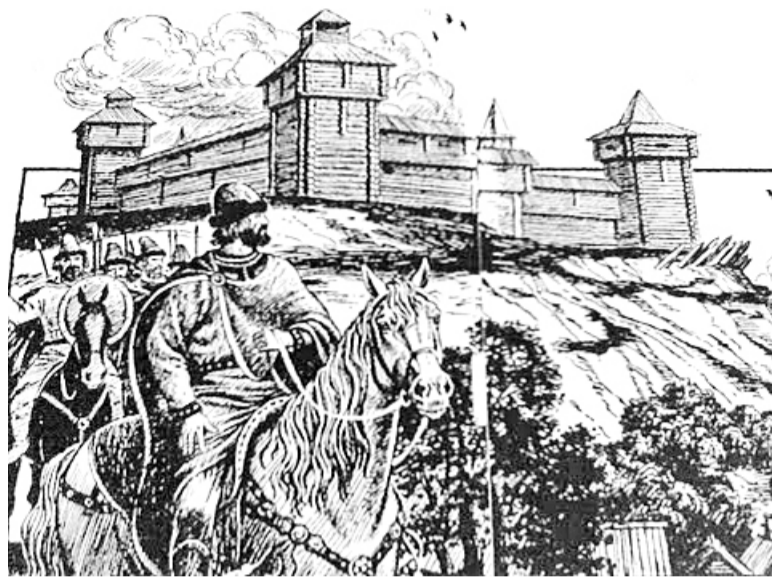
Красноярский острог, 1730 год

первый Абаканский острог, точно сказать невозможно, но уже в 1679 году джунгары и киргизы напали на Красноярск, который едва устоял. Абаканский острог сожгли.