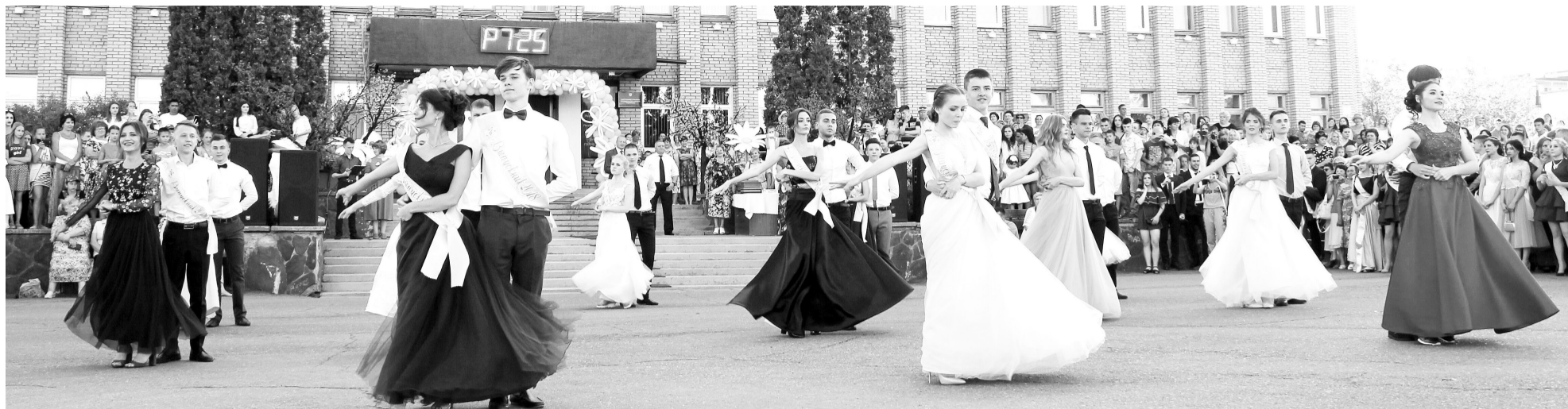
Счастье в ритме вальса