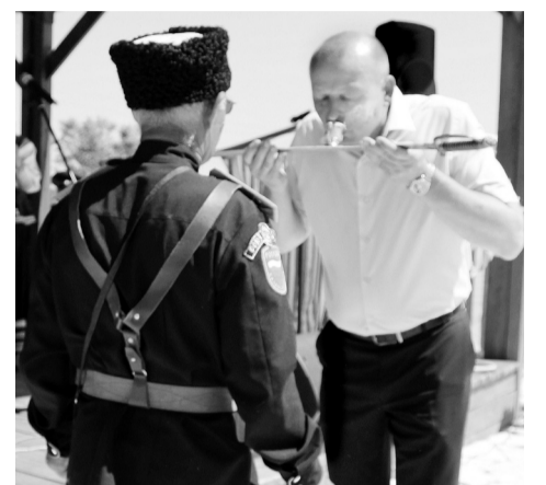
Чарку на сабле принимает Леонид Быков

- Пирог, сушки, баранки, ватрушки. Часто пили чай с кусковым сахаром вприкуску да вприглядку. Сахар в XIX веке продавали в «головах» - это огромные куски весом по 10-11 кило-