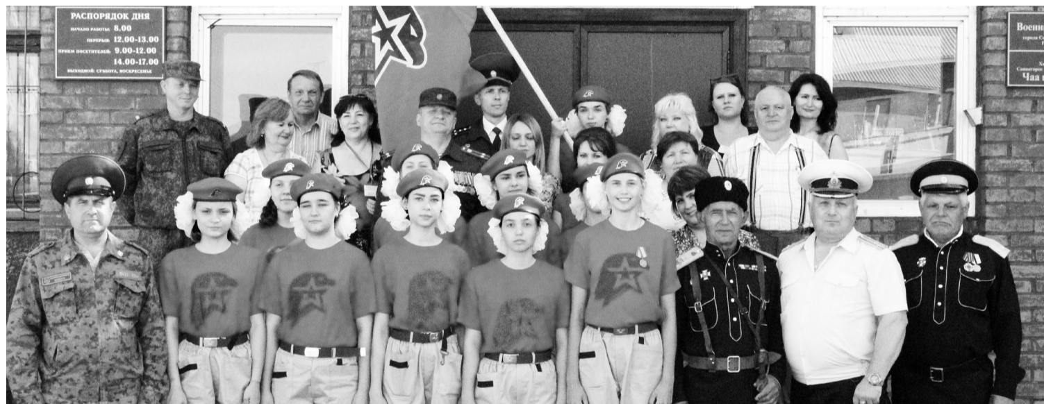
Верой и правдой служить России