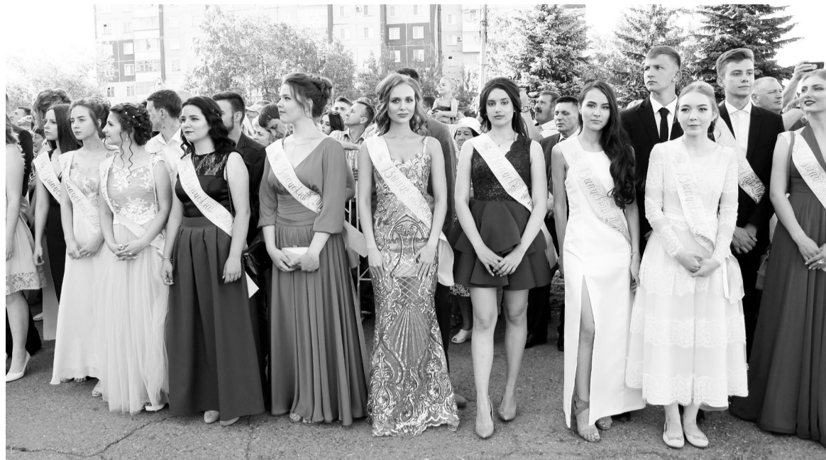
Хоть на красную ковровую дорожку!

Под нескончаемые аплодисменты Глава города вручил особо отличившимся выпускникам премии, а их родителям - Благодарственные письма.