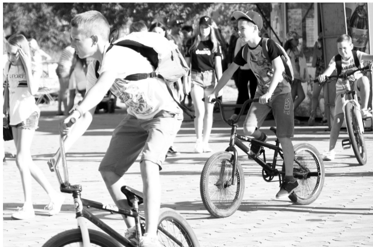
Дети колесили на велосипедах

Стадион встретил любителей экстремального спорта и предоставил возможность посетить уроки экстримзащиты. Возле ФОКа прошёл эстафета с заездами разных возрастных групп - от 5 до 35 лет, там же все желающие могли посетить мастер-класс по Workout - дворовой фитнес-тренировке. А возле здания администрации города прошла любимая большинством горожан зарядка выходного дня. Куда ни глянь - развлекательные мастер-классы, фотозоны, детские кафе... Как ни странно, до самого вечера не иссякали потоки народа к предложенным развлечениям. В 18 часов на площади у