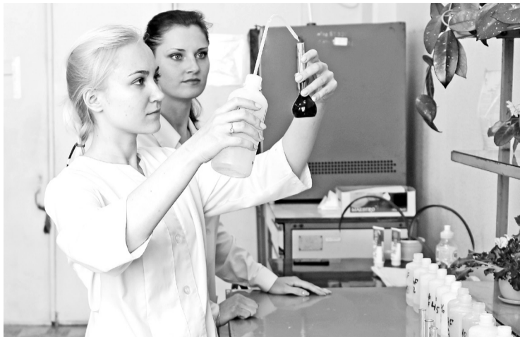
Приобщение к профессии

Большинство практикантов - студенты Саяногорского политехнического техникума (СПТ), обучающиеся по специальности «Металлургия цветных металлов». Иные учебные организации города направляют практикантов по профессиям «машинист крана», «машинист компрессорных установок», «машинист насосных установок». Студенты вузов - Сибирского федерального университета, Хакасского технического института,