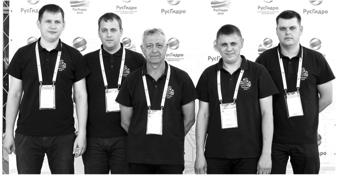
Команда СШГЭС: наши победили!

Следующим испытанием - без преувеличения самым