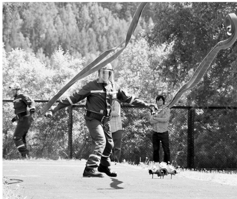
Пожарная эстафета - этап непростой

зрелищным и впечатляющим - стало оказание первой доврачебной помощи. Это, пожалуй, самый психологически тяжёлый этап: участникам необходимо помочь пострадавшим, которых отыгрывают натуралистично загримированные актёры - и всё это под выматывающее душу аудиосопровождение в виде криков, стонов, детского плача и взрывов.