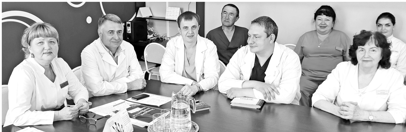
Идёт планёрка. Ежедневно врачи решают десятки неотложных вопросов

присоединились поликлиника, детский стационар, стационар для больных терапевтического профиля и хирургический, определивший дату рождения СМБ - 1 июля.