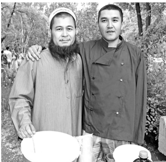
Знатоки кыргызской кухни