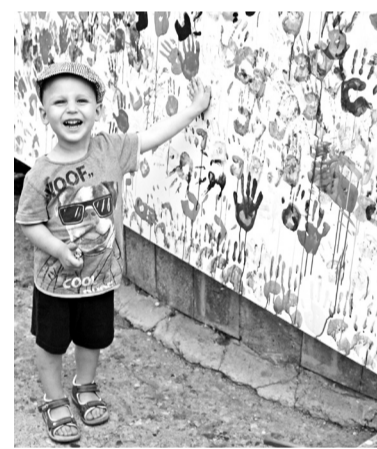
Маленькое очарование! Его ладошка есть в общем рисунке Дружбы

- У тюркских народов украшения всегда наделались особыми свойствами, - окунает в историю своего народа мастерица. - Украшения выступали