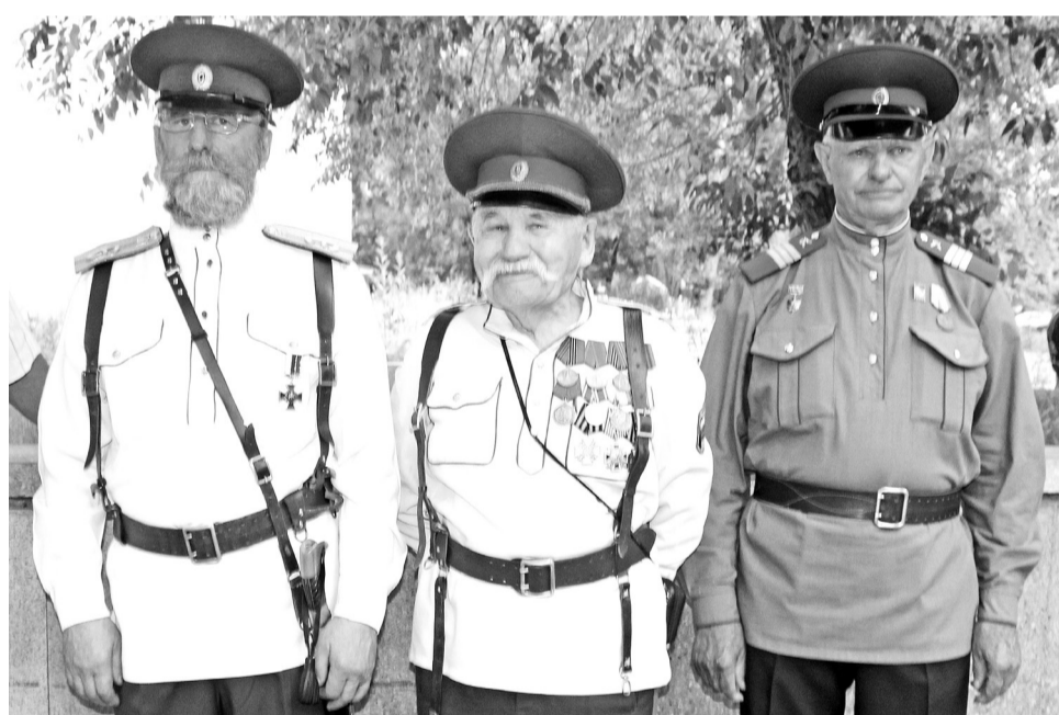
Любо, братцы, любо. Любо, братцы, жить...

фантастики! Как говорят по-русски немцы: «Фантастиш!». Такое воздушное и вкусное творение кулинаров, которое буквально тает во рту, пробую впервые. Конечно же, беру рецепт кулинарного шедевра и мечтаю сотворить подобное чудо.