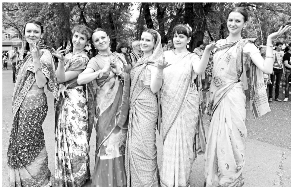
Саяногорские последователи религиозного течения, основанного на поклонении Кришне