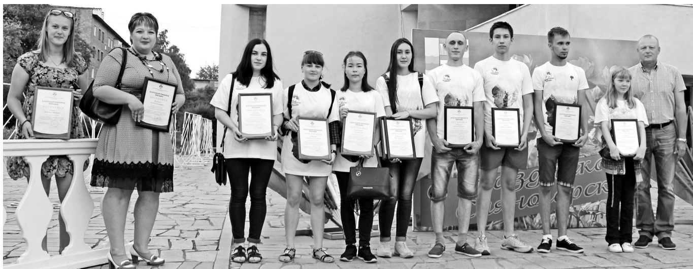
«Волонтеры Победы» всегда в первых рядах