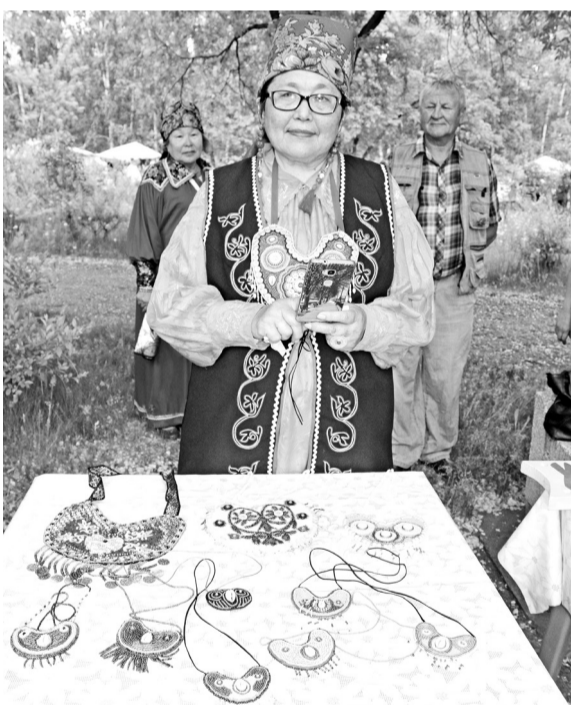
У каждого пого - своя история