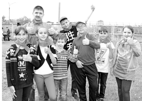
Команда «Пионеры» дома № 8 Интернационального микрорайона

Команда Устиновичей «Орлы» представлена, кроме