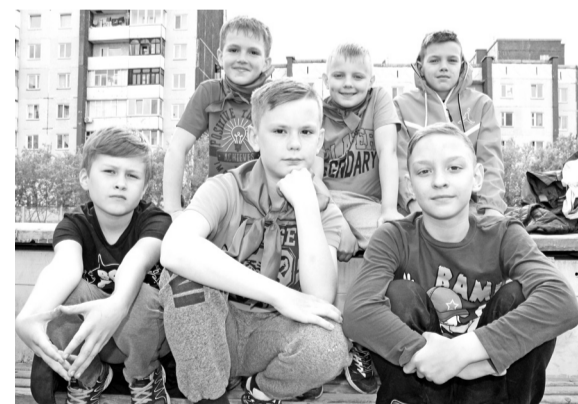
Смелые «орлята» из команды-победительницы «Орлы»

Как не подойти к дворовой команде «Пионеры» дома № 8 Интернационального микро-