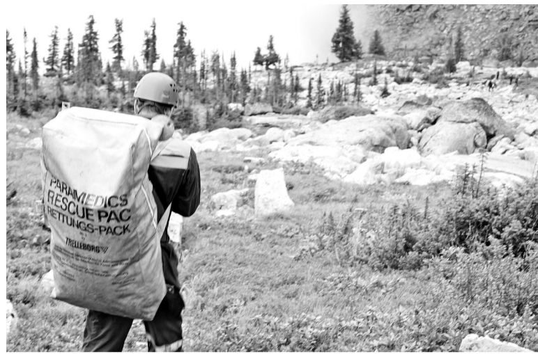
Спасательная операция на горе Борус

В случае, если вы потерялись или заблудились, не стоит паниковать, берегите свои силы. Если доступна сотовая связь, то сразу сообщите близким или спасателям о вашем положении и состоянии. После звонка не продолжайте дальнейшее