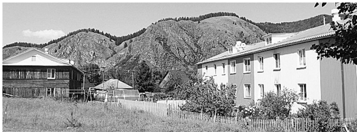
Дом в Майне после капремонта