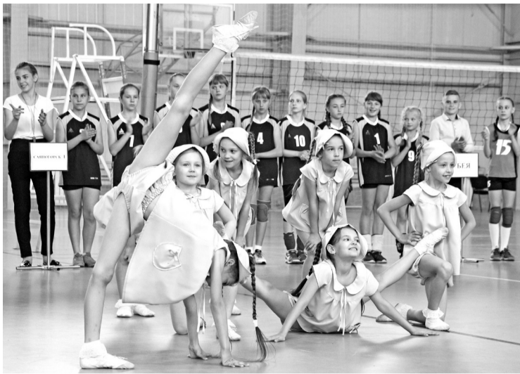
«Экспромтовцы» показали класс!