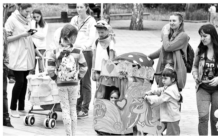
Оригинальное «дефиле» на колёсах

После концерта открылся «Бульвар чудес», где дети могли не только проверить свою меткость на гигантской рогатке, собрать клоуна, восполь-