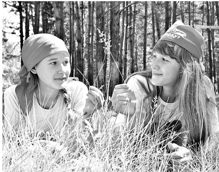
В лагере «Беркут»