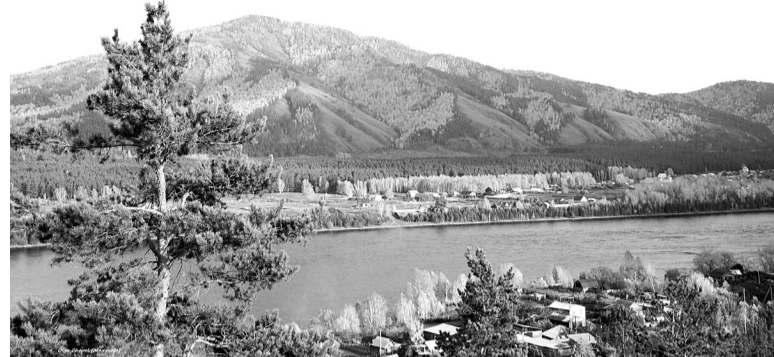
К Умай-таг с чистыми помыслами...

Это Баштак, где сегодня возрождается горнолыжный спорт. Согласно переводу с хакасского языка, название состоит из двух частей: «баш» и «так» («таг»). Первое слово