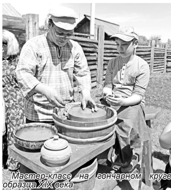
Мастер-класс на гончарном круге образца XIX века

- Рушник - атрибут всех народных праздников и обрядов. На Руси он издревле имел не только эстетическое предназначение, но и ритуально-обрядовое. Это единственный ритуальный предмет из языческого прошлого, который используется в народном быту для украшения и защиты. Пояс в славянской традиции - знак дороги, который является оберегом для его носителя, способствует удаче и благополучию. Народ верил в могущественную силу пояса. Об этом свидетельствуют рукописные книги престолярной