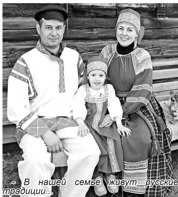
«В нашей семье живут русские традиции...»

Отведав исконно русские яства, спешим на крестьянский двор, отведённый для фотозоны. Наши современники переодеваются в русские сарафаны, рубахи, шаровары и с огромным