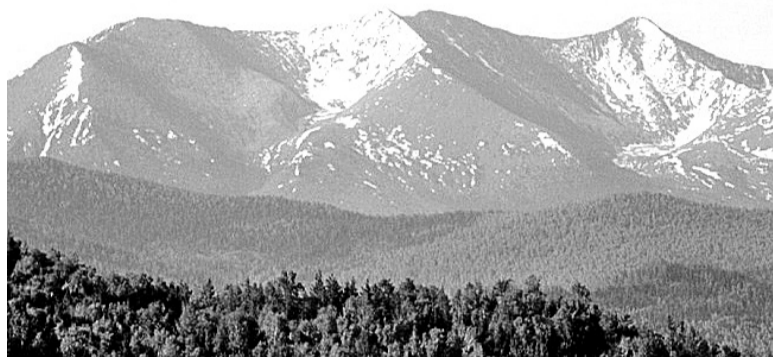
Величественный Борус - визитная карточка Саяногорска

За каждым географическим названием скрывается история, оживают легенды, и читается интереснейшая летопись саянской земли