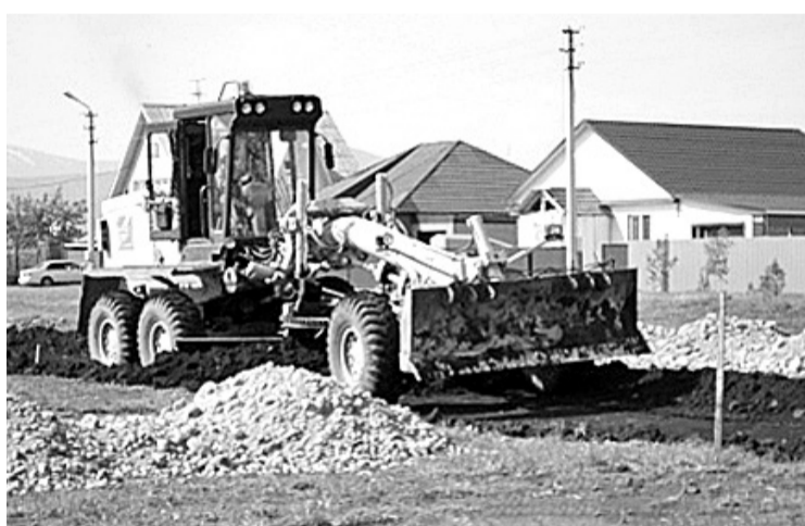
Кипит работа в ТОС «Клубничная поляна»

Я отправил в администрацию города письмо с просьбой сохранить посаженные мною и моим соседом по улице деревья, а также выделить место для спортивной площадки. Надо отдать должное органам местного самоуправления: приехала представительная комиссия под началом заместителя Главы МО г. Саяногорск по ЖКХ, транспорту и