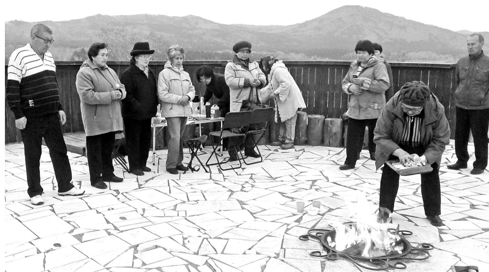
Горит костёр Памяти

Все понимали торжественность момента. Минуты молчания почтили память всех погибших за Родину. Прошёл небольшой митинг, а потом собравшиеся пели песни о войне: «Журавли», «День Победы», «Тёмная ночь», «Синий