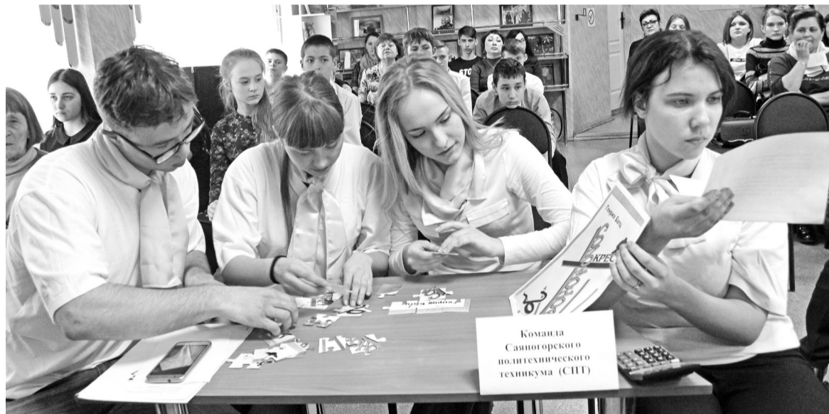
Команда СПТ: пазлы - дело серьёзное