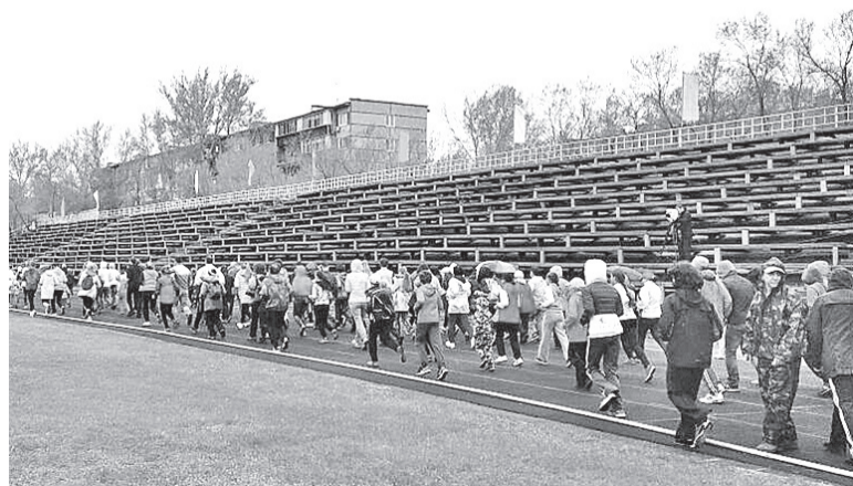
Первый день пробегов