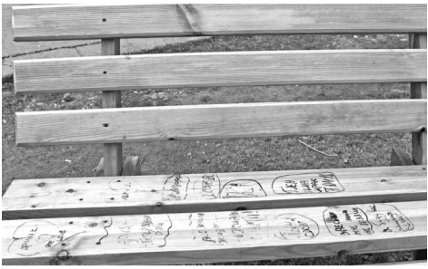
Лавочка, исписанная «литературными опусами» вандалов