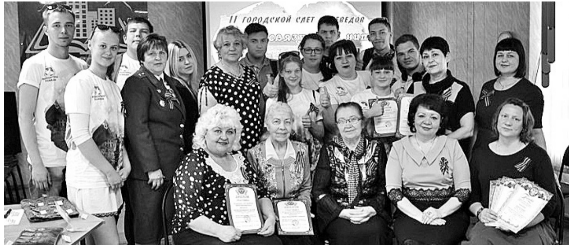
Хранители народной памяти, которые любят и чтят историю родного края