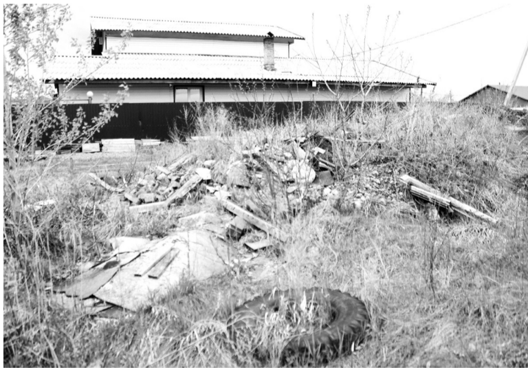
Строительные отходы на фоне красивого дома

ветки Камышта - Саяногорск 19 апреля был закрыт. Здесь достаточно длительное время утилизировались все виды отходов, в том числе строительные. Хотя, будем предельно честными, свалка строительного мусора за магазином «Шины. Диски Bridgestone» сформировалась не сегодня и даже не вчера. Однако вернёмся в день нынешний.