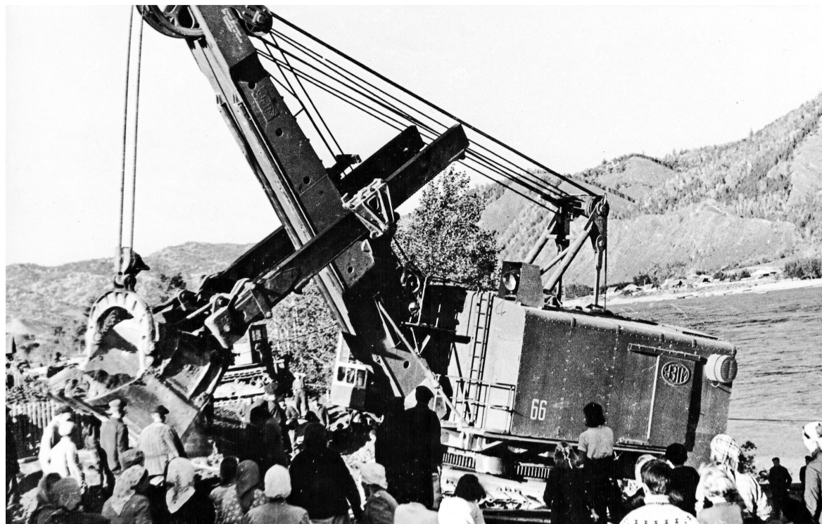
12 сентября 1963 года прибыл из Дивногорска со строительства Красноярской ГЭС первый экскаватор ЭКГ-4,6