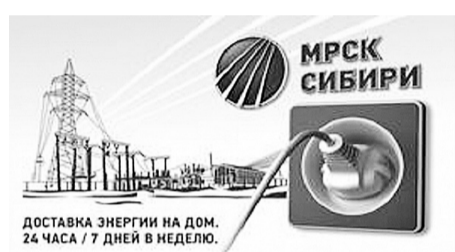
ДОСТАВКА ЭНЕРГИИ НА ДОМ. 24 ЧАСА / 7 ДНЕЙ В НЕДЕЛЮ.

Лишение АО «Хакасэнергосбыт» статуса гарантирующего поставщика