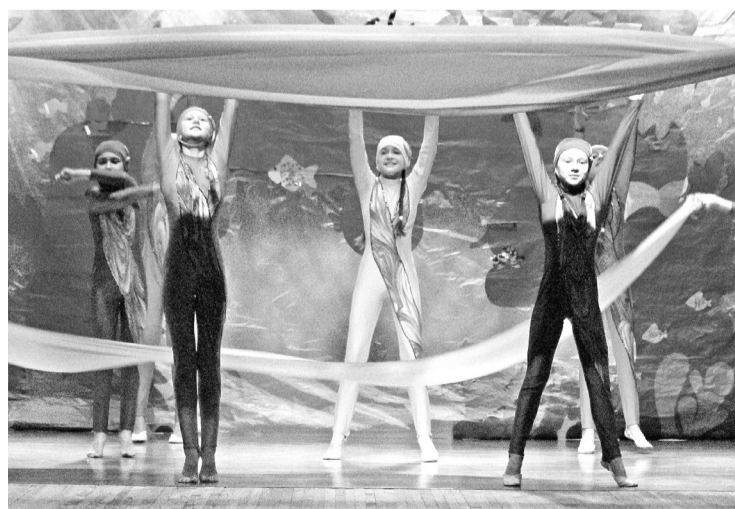
Выступление юных артистов

Кукольный театр «Сказка» из ЦДТ получил призы за лучшее музыкальное оформление и лучший актёрский ансамбль. Всего же юные артисты увезли