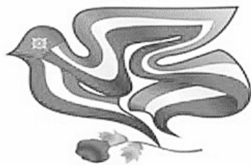
Республиканский фестиваль творчества молодежи

Творческие ребята из Саяногорска продемонстрировали свои таланты на республиканском молодёжном фестивале «Весна в Хакасии».